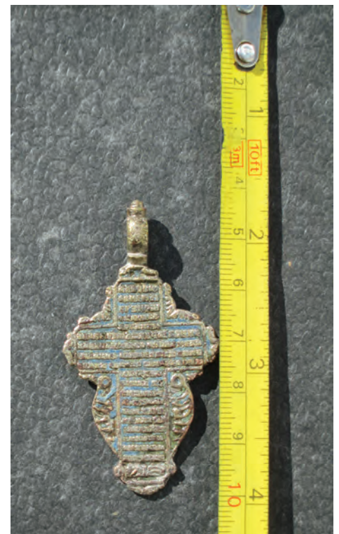
Fig. 4. Reversul Crucii

Животворящий Крест Господень, помогай мне со Святою Госпожою Деву Богородицею и со всеми святыми во все века. Аминь.”