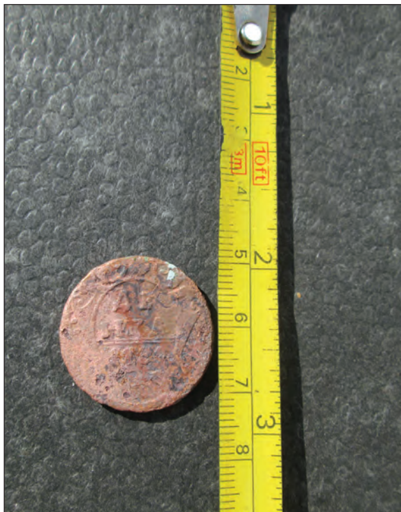
Fig. 4. Avers Monedă

Pe revers se află Vulturul bicefal-simbol imperial 9 , având într-o gheară un sceptru, iar în cealaltă o cruce.