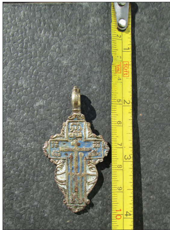
Fig. 3. Aversul Crucii