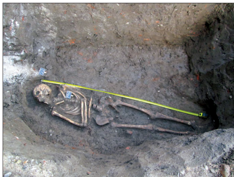
Fig. 2. Mormântul M4

Iconografic, în partea de sus a crucii se află inscripționat titlul celui care era răstignit. Din ordinul pe care Pilat la dat, deasupra capului lui Iisus, în momentul răstignirii Lui au fost pusă o tăbliță inscripționată cu patru inițiale. În prezent, de cele mai multe ori aceste inițiale apar inscripționate în alfabet latin sub forma I.N.R.I (prescurtare latină a expresiei: Iēsus Nazarēnus, Rēx Iūdaeorūm ), dar, uneori, sunt întâlnite și în versiunea alfabetului grecesc sub forma I.N.B.I (prescurtare grecească a aceleiași expresii: Ἰησοῦς ὁ Ναζωραῖος