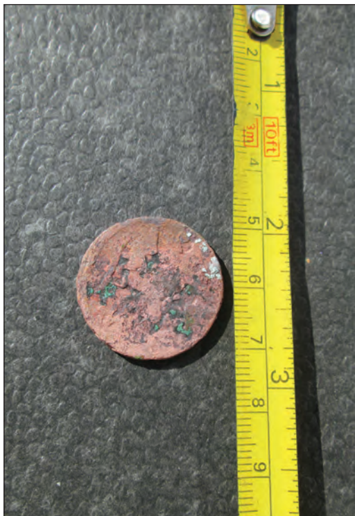
Fig. 5. Revers Monedă