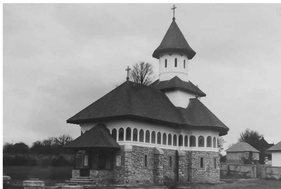
Fig. 11 Biserica din Mărăști (ANR-ANIC, fond Societatea Mărăști, dosar 86)