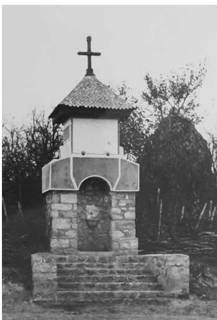
Fig. 8 Fântâna monumentală de la intrarea în sat