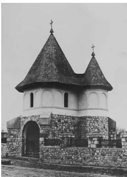
Fig. 10 Clopotnița bisericii (ANR-ANIC, fond Societatea Mărăști, dosar 86)