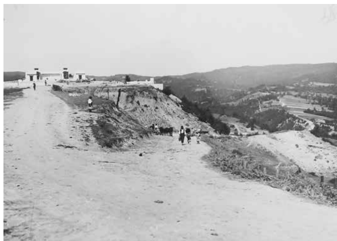
Fig. 1 Vedere spre Mausoleu și câmpul de luptă (ANR-ANIC, fond Societatea Mărăști, dosar 86.)