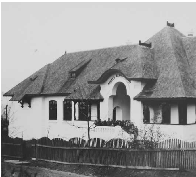
Fig. 15 Școala „Regina Maria” (ANR-ANIC, fond Societatea Mărăști, dosar 86)