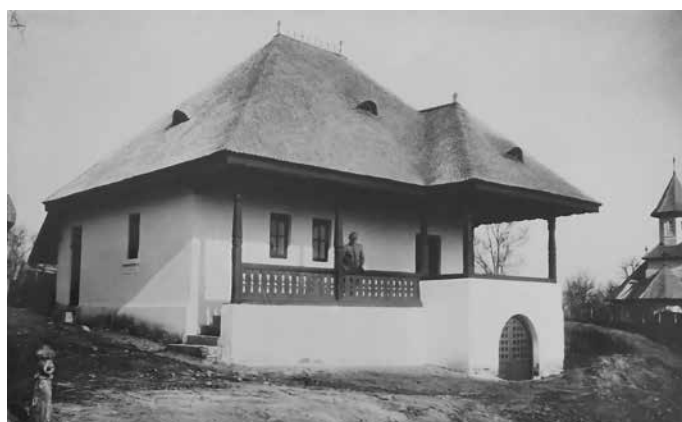
Fig. 19 Casă tip