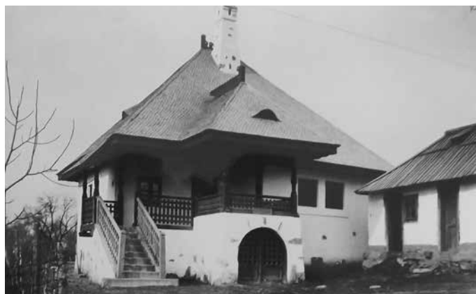
Fig. 18 Casă tip (ANR-ANIC, fond Societatea Mărăști, dosar 86)