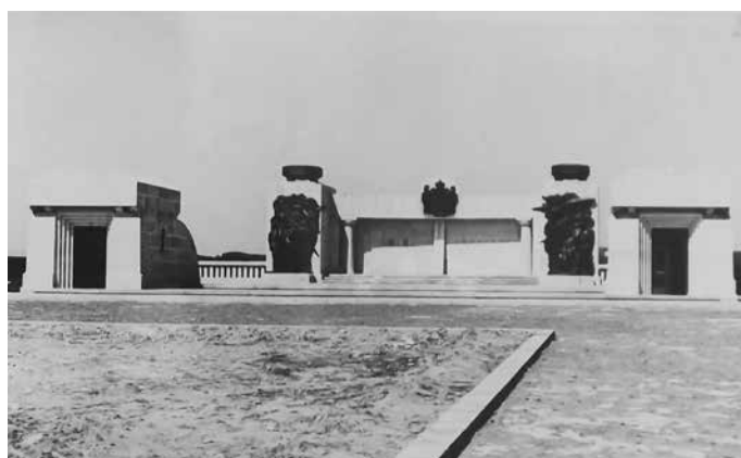
Fig. 20 Vedere spre mausoleu