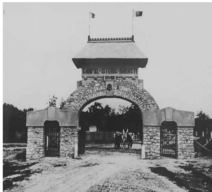
Fig. 16 Arcul de Triumf (ANR-ANIC, fond Societatea Mărăști, dosar 86)