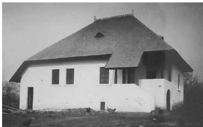
Fig. 17 Casă tip (ANR-ANIC, fond Societatea Mărăști, dosar 86)

În același timp trebuie studiate posibilitățile de valorificare a potențialului istoric al întregului sit, pentru promovarea turismului cultural și a turismului rural, spre a contribui și prin aceste mijloace la ridicarea unei zone sărace și abandonate azi, pe scurt, pentru a reînvia planul inițial al Societății „Mărăști”, prezidat de înalta și novatoarea concepție, ilustrată în Marele Război de regina Maria a României, de creare a unei localități moderne, conservând în același timp un valoros sit istoric.