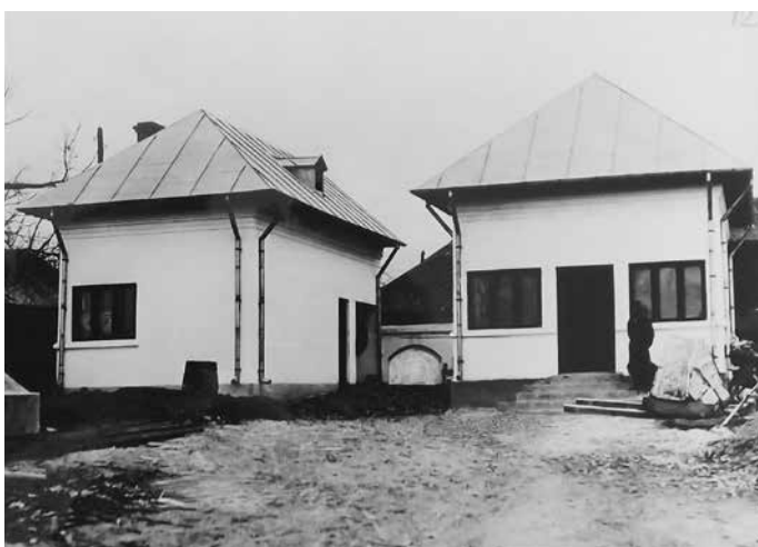
Fig. 5 Uzina electrică (ANR-ANIC, fond Societatea Mărăști, dosar 86)