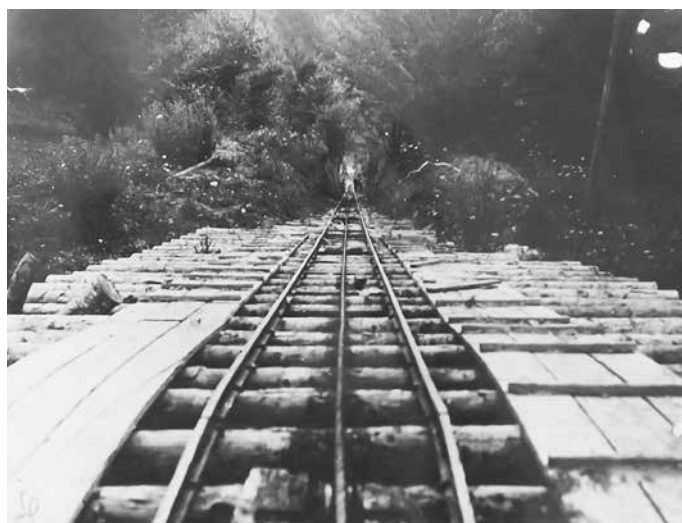
Fig. 4 Linia funicularului cu cremalieră (ANR-ANIC, fond Societatea Mărăști, dosar 86)