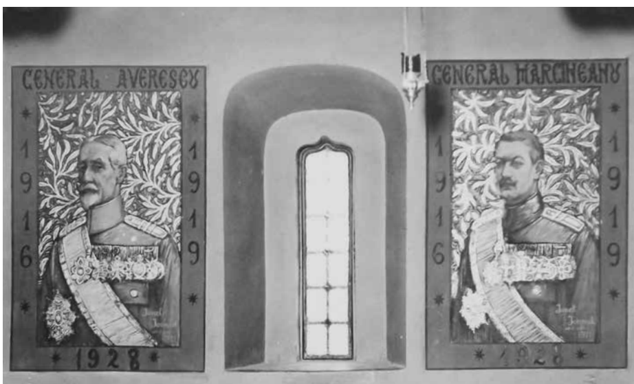
Fig. 7 Portretele generalilor Alexandru Averescu și Alexandru Mărgineanu în biserica din Mărăști