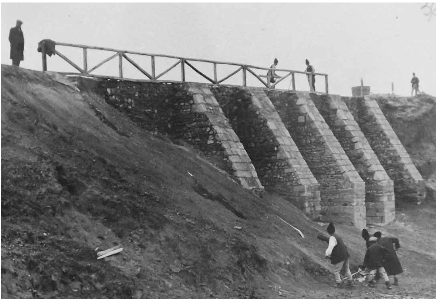
Fig. 2 Digul de consolidare (ANR-ANIC, fond Societatea Mărăști, dosar 86)