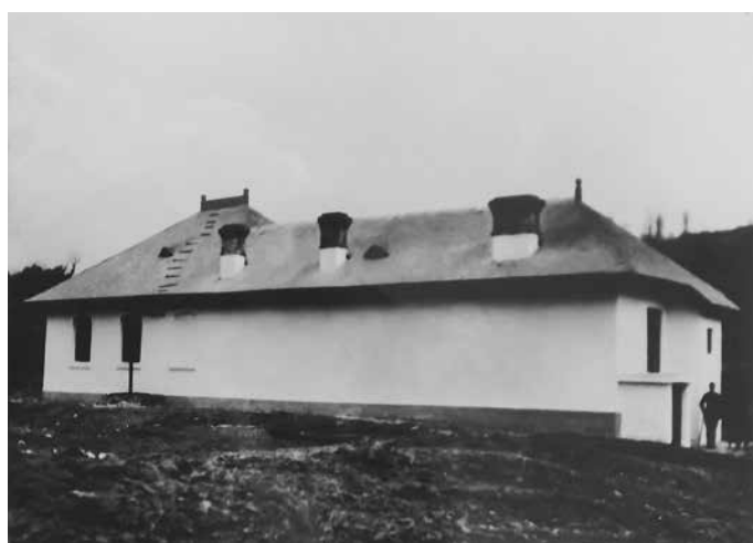
Fig. 6 Uzina de apă