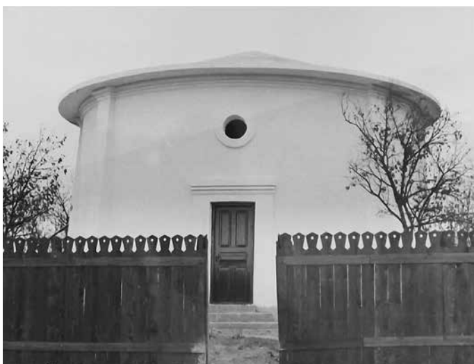
Fig. 3 Rezervorul de apă din sat (ANR-ANIC, fond Societatea Mărăști, dosar 86)