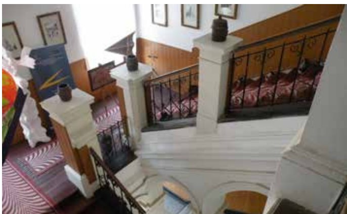
Fig. 6 Scara (11 octombrie 2017)