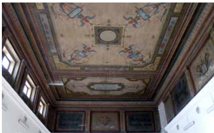
Fig. 7 Vedere de ansamblu a plafonului sălii de sport a școlii (foto Aurelian Stroe, 11 octombrie 2017)