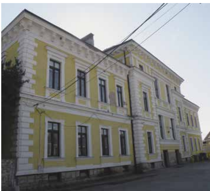
Fig. 4 Fațada la curte a școlii (11 octombrie 2017)