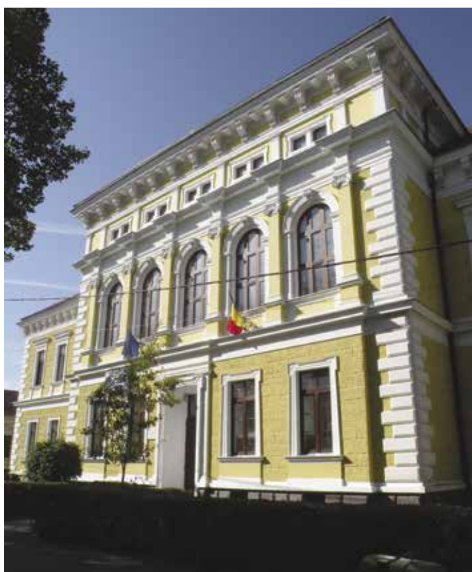
Fig. 5 Rezalitul de pe fațada principală a școlii (foto Aurelian Stroe, 11 octombrie 2017)