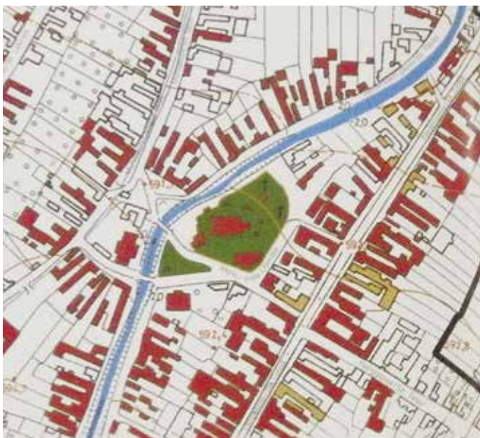
Fig. 2 Piața localității (Markt), azi Piața Libertății, detaliu, după Denkmaltopographie Siebenbürgen. Kreis Kronstadt/Topografia monumentelor din Transilvania. Județul Brașov, 3.4. (a. Biserica evanghelică fortificată, b. Școala, c. Casa parohială evanghelică, d. Fosta remiză a pompierilor, e. Primăria, f. Grădinița)