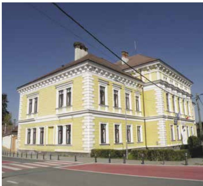
Fig. 3 Fosta școală confesională evanghelică, azi școală generală. (foto Aurelian Stroe, 11 octombrie 2017)