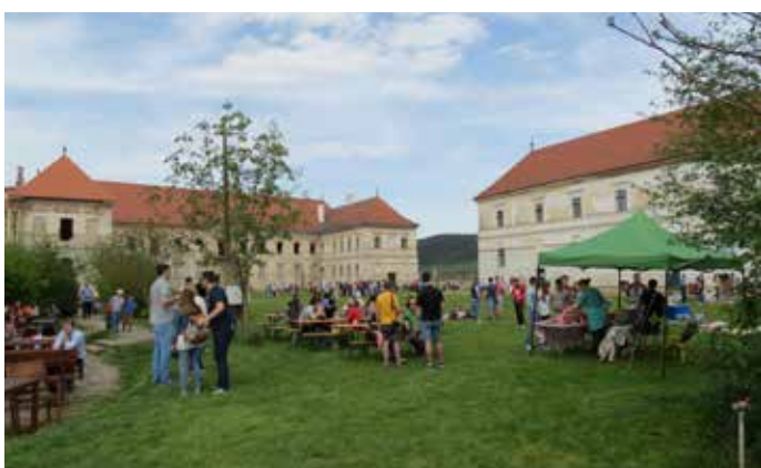
Fig. 19 Ziua Porților Deschise în aprilie 2016 (Transylvania Trust)