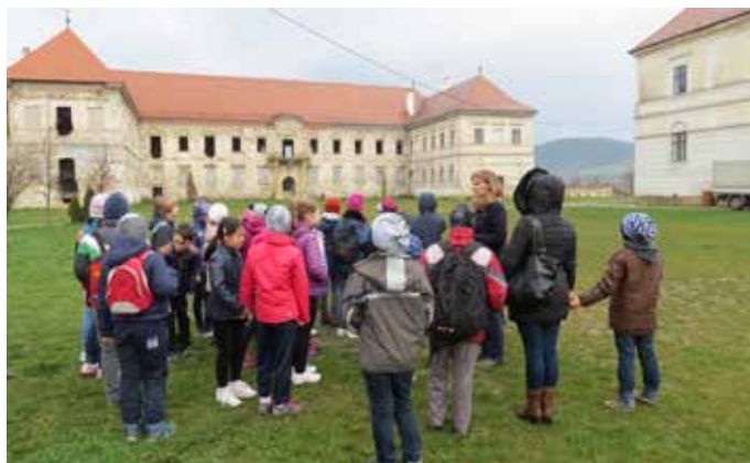
Fig. 16 Vizită ghidată în castel în cadrul Zilei Patrimoniului pentru Copii (Transylvania Trust, 2016)