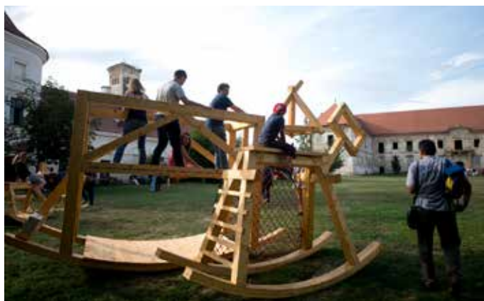
Fig. 14 Piesele exterioare realizate în cadrul proiectului ARTEC (Roxana Pop, 2016)