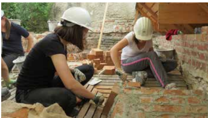
Fig. 9 Reconstruirea unei bolți deasupra grajdului baroc în cadrul Cursului de specializare în reabilitarea patrimoniului construit (Transylvania Trust, 2015)