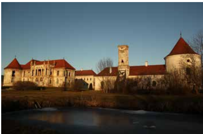
Fig. 5 Castelul dinspre vest (Angéla Kalló, 2017)