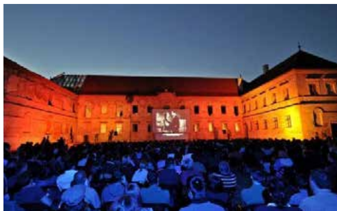
Fig. 21 Festivalul Internațional de Film Transilvania, 2011 (Nicu Cherciu)

Restaurarea și folosirea acestor edificii ar contribui în mare măsură la creșterea atractivității turistice a zonelor în care se află, ar crea locuri de muncă pentru localnici și ar stimula turismul cultural în zonă.