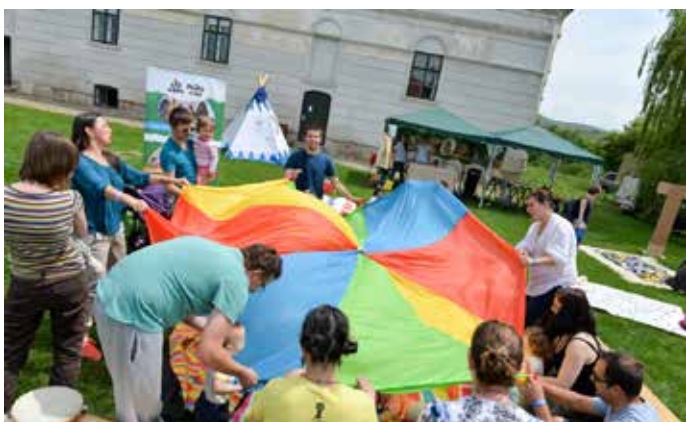
Fig. 17, 18 Activități pentru copii în cadrul Zilelor Castelului Bánffy