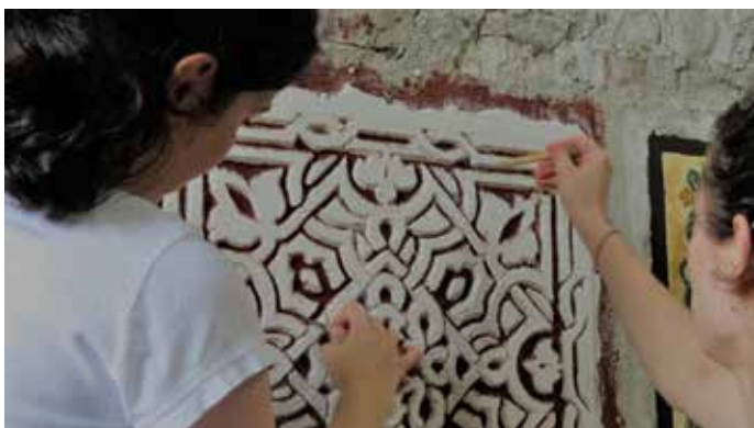
Fig. 11 Învățarea tehnicii sgraffito în cadrul cursului de specializare în reabilitarea patrimoniului construit (Transylvania Trust, 2017)