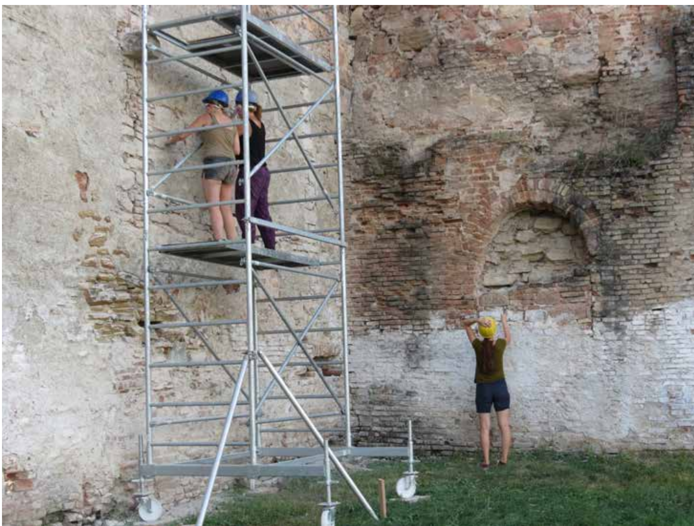
Fig. 12 Cercetare de parament cu studenți istorici de artă (Transylvania Trust, 2017)