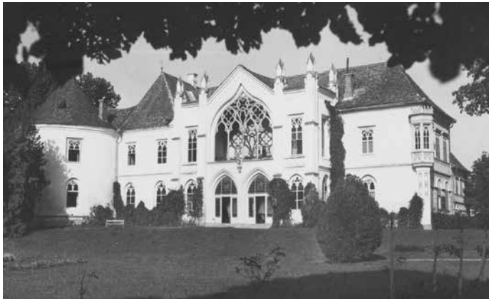
Fig. 3 Fațada de vest, neogotică a clădirii principale, rezidențiale, înainte de transformările din 1935 (Josef Fischer, Academia de Științe a Ungariei, Arhiva Institutului de Istoria Artei, MKCS-C-I-121/83)