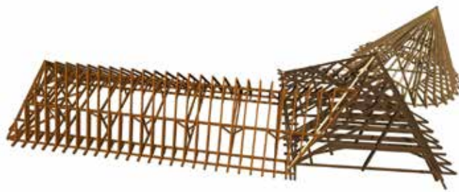
Fig. 6 Modelarea 3D în Archicad a ansamblului șarpantelor aferente clădirii principale executate în anii 2009-2011 - colțul nord-vestic, aripa vestică și turnul nord-vestic (echipa Irod M, 2009)