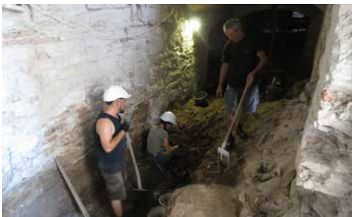
Fig. 13 Cercetare arheologică în subsolul castelului (Transylvania Trust, 2017)