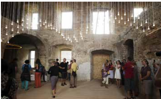
Fig. 15 Inaugurarea Centrului de Arte și Meserii (Roxana Pop, 2016)