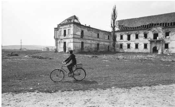
Fig. 4 Clădirea principală dinspre curtea interioară a castelului în 1996 (Krisztián Kiszely)