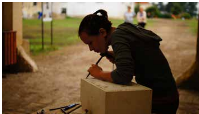
Fig. 10 Atelierul de pietrărie în cadrul Cursului de specializare în reabilitarea patrimoniului construit (Transylvania Trust, 2015)