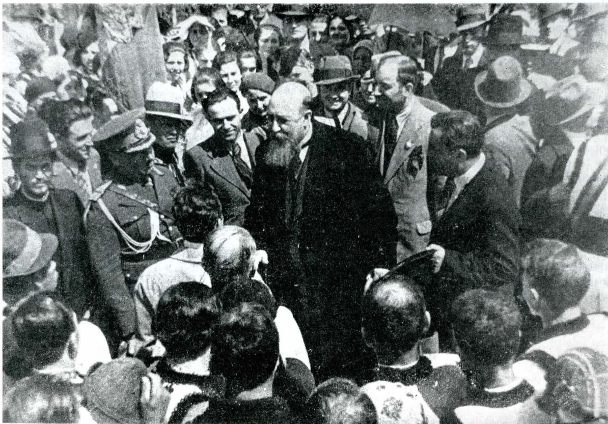
13. În vizită la Putna (colecție particulară)

„Prin invitația la Oxford a unei părți din membrii Congresului istoric am putut vedea un colț din evul mediu păstrat în toată evlavia, disciplina, frăția și ascultarea sa monastică între zidurile mănăstirii de învățătură din veacurile depărtate, pînă aproape de vremea cînd s-a stabilit în Anglia dominația normandă. [. . .] Ziduri întunecate se ridică, unele din ele cu piatra mîncată de ploile sutelor de ani, fără mișcîndu-se încet sub lumina caldă a verii; sînt fațade din veacul al XVIII-lea, sînt și din al XVII-lea, al XVI-lea, din evul mediu însuși. Scărițe de întunec, cu înguste trepte de piatră ca pentru suișul într-un turn de pază trec pe lîngă uși cu orbita adîncă, și ești mirat dacă, deschizînd vreuna, te găsești în biblioteca de cărți nouă, cu legăturile aurite, ale vreunui tînăr profesor. [. . .] O, ce mult «ev mediu» aici! Îl găsești oriunde, respectat în reîn-