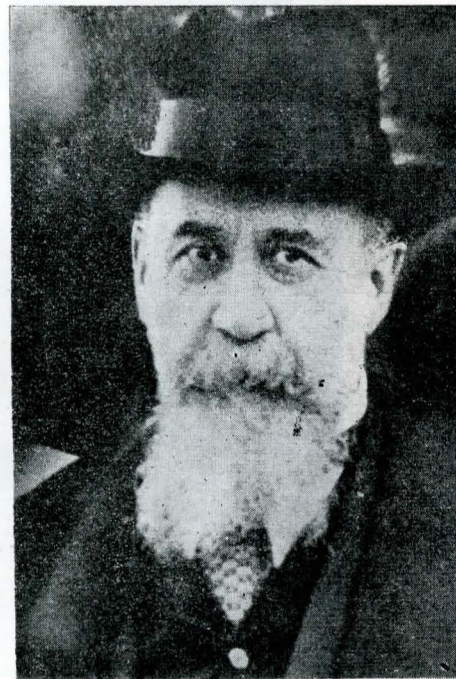
12. În vizită la Mănăstirea Agafton (colecție particulară)

11. NICOLAE IORGA (colecție particulară)