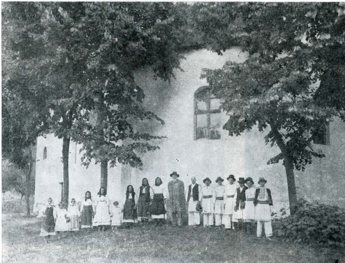
6. Cu poporenii în fața bisericii din Ieșelnița, județul Mehedinți.

„Pretutindeni, în orașele la care mă opream, căutam să deosebesc faptul primordial, punctul de unde pleaseră toate celelalte, vechea celulă generatoare, și, odată găsită aceasta, tot restul devenia inteligibil și interesant. Astfel vedeam în Buzău episcopia [...] azi închisă între vechile ei ziduri, și această com-