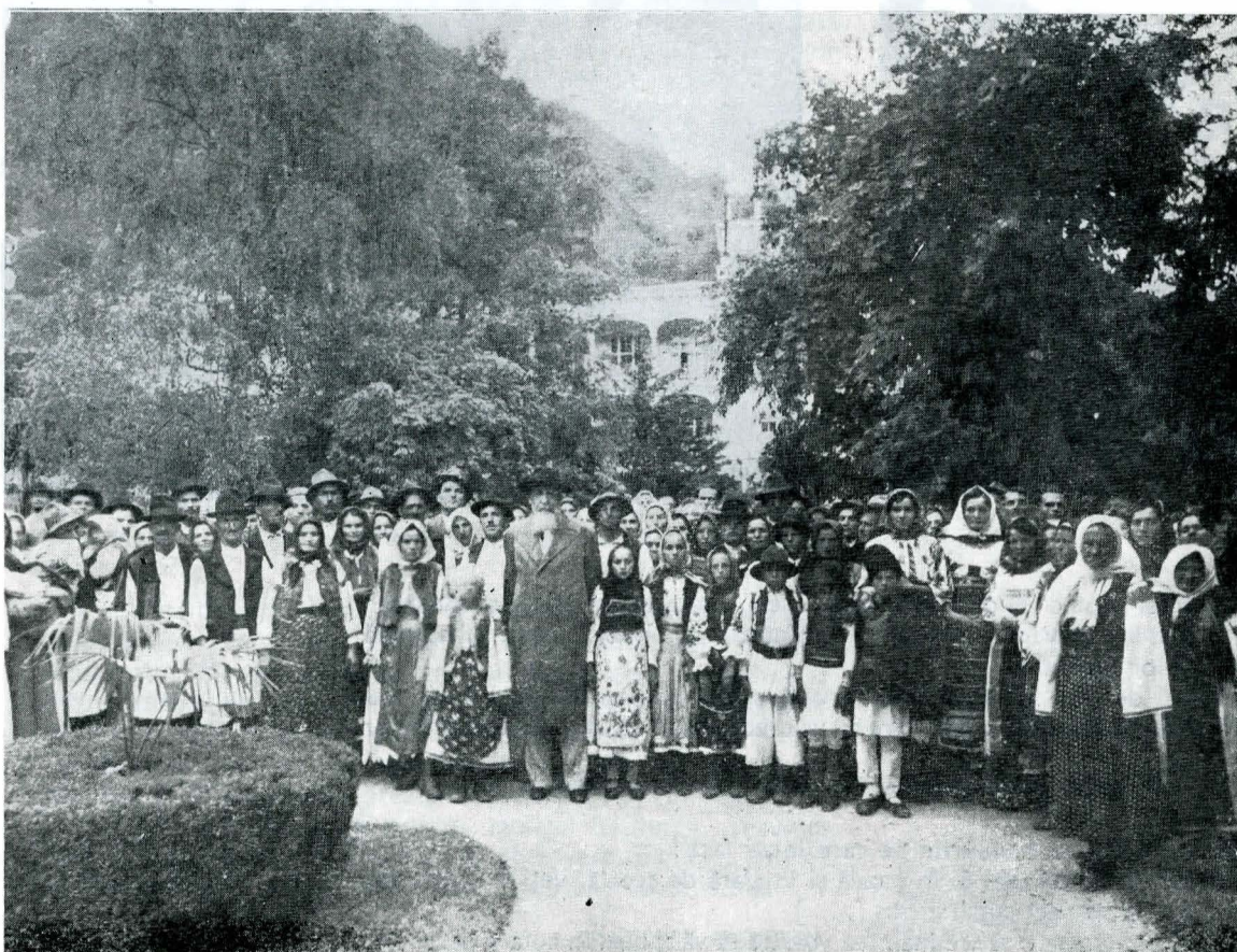
7. Împreună cu săteni din Globurău, județul Caraș-Severin, înaintea bisericii (clișeu C.M.I.).