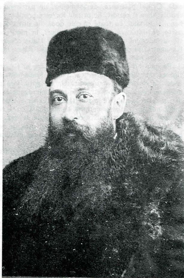
1. NICOLAE IORGA — călător la începutul secolului al XX-lea prin cea mai necunoscută dintre țări: România