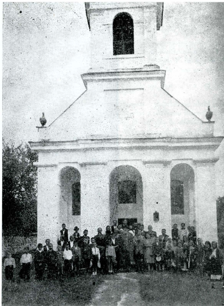
10. Apărător statornic al monumentelor istorice — instantaneu de la o conferință (clișeu C.M.I.).

afară din «reparație», neprefăcută, ceia ce e un avantaj, dar și neprijinită, nesusținută, ceia ce e o primejdie. Nu observați?: bisericile restaurate cît de plăpînde, cît de meschine, ca niște jucării, apar ele, desfăcute de toată vecinătatea lor? Nu mai au loc caracterul pe care ziditorii au voit să li-l dea și care rezultă, nu numai din zidul bisericii, ci din tot complexul de clădiri care formau fundațiunea sfîntă”.