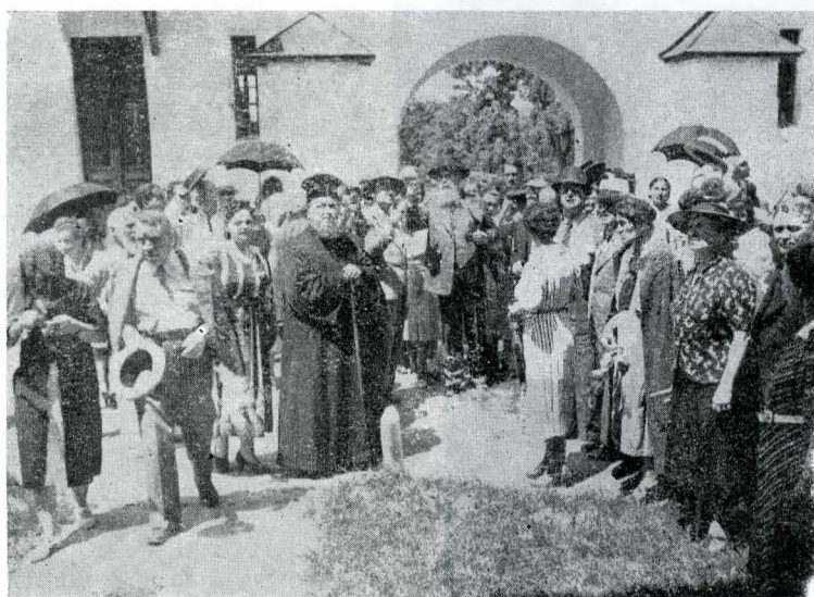
2—5. La Căldărușani.

N. Iorga, O viață de om , vol. III, București, 1934, p. 83.