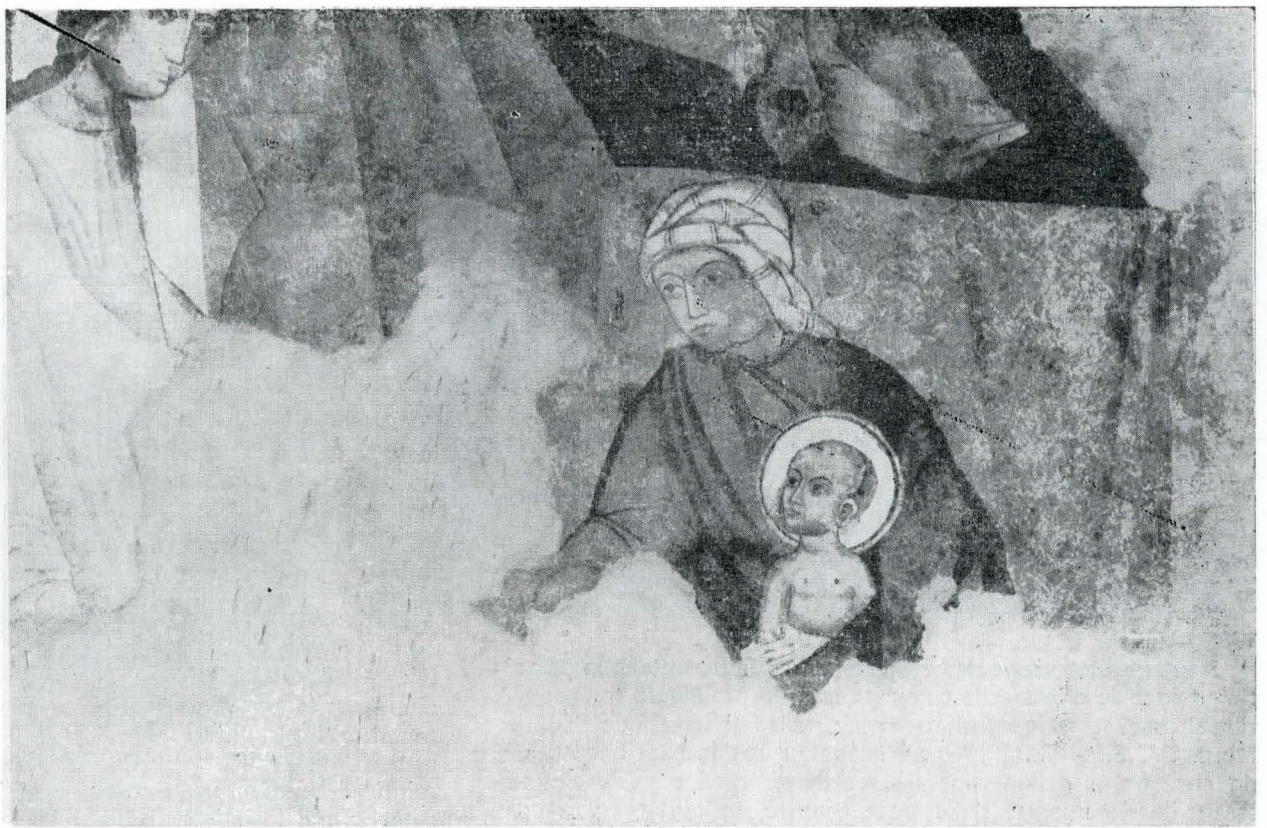
17. Frescă din sec. al XV-lea? Naos, perete nord, scena Nașterea Sf. Ioan Botezătorul, detaliu; imagine finală realizată după lucrările de conservare-restaurare.

de pictorul Cornel Boambeș, întreg edificiul a fost supus unor ample lucrări de restaurare de arhitectură, cu care prilej biserica a căpătat o imagine cît mai apropiată de cea reală.