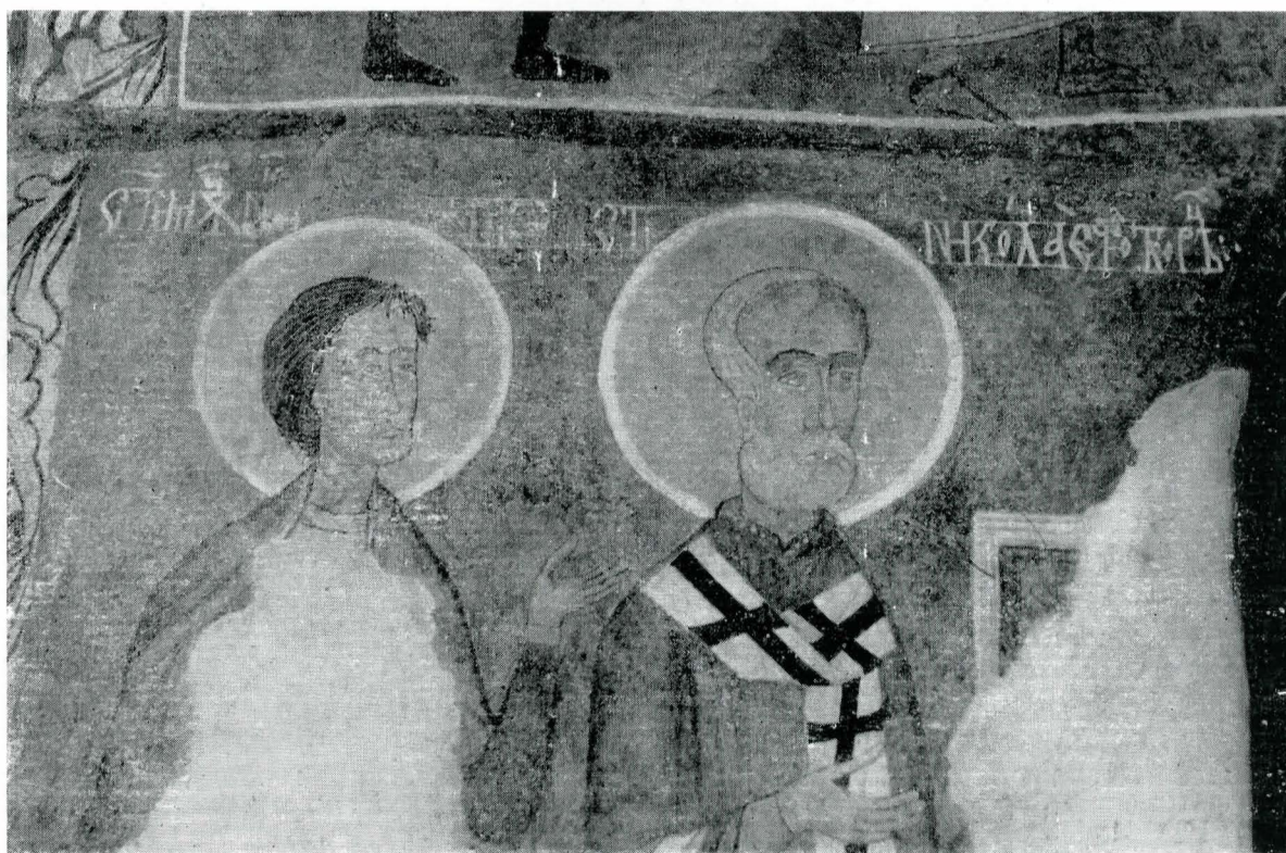
23. Frescă din secolul al XIV-lea. Pronaos, perete est, detaliu; imagine finală, după terminarea operațiilor de conservare-restaurare.

În ultima parte a lucrărilor de restaurare din anul 1988 s-a efectuat chituitura lacunelor și fisurilor la nivel în mai toate compartimentele bisericii, executându-se și injectările necesare în zonele, desprinse după ridicare, din naos și pronaos. Chituirile la nivel s-au efectuat din var / nisip fin + 10—12 straturi de cîlți, bine sclivisit și presat la margine. Lacunele mai puțin adînci, de suprafață, ale stratului de intonaco original au fost chituite cu carbonat de calciu în amestec cu emulsie de caseină Slanski.