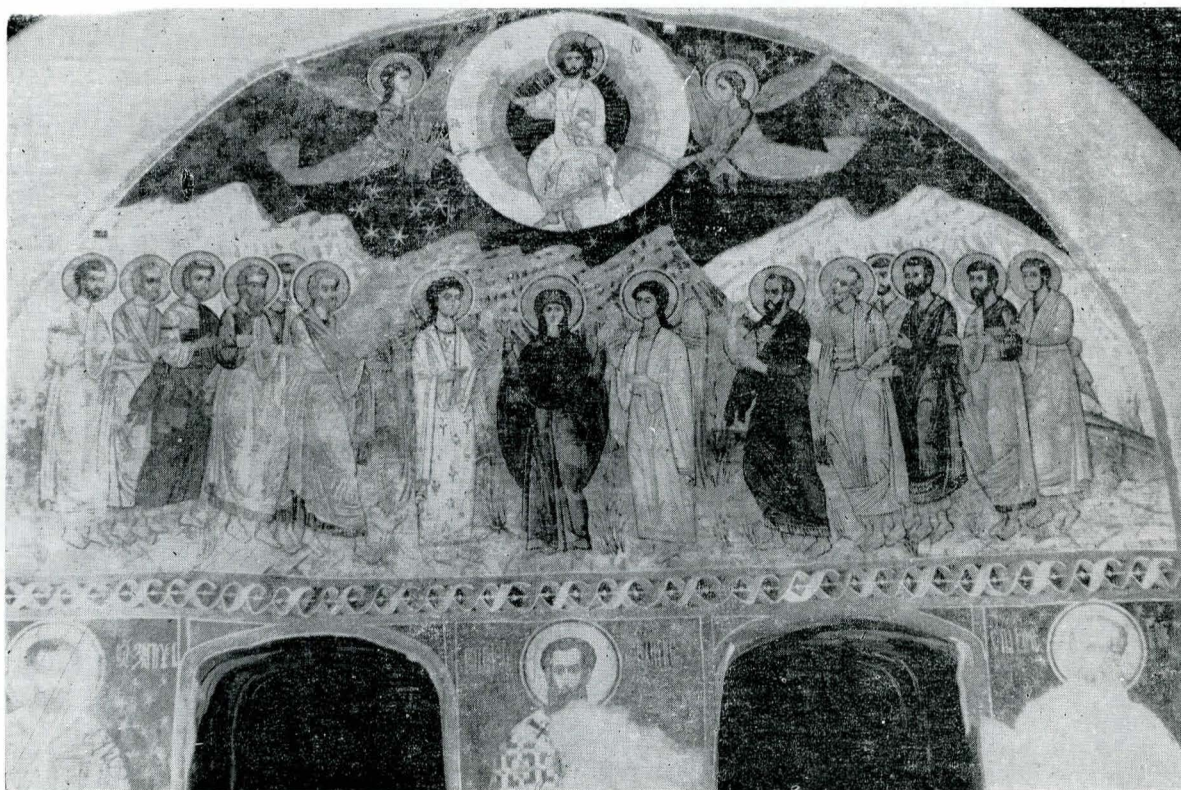
Frescă din secolele XVI—XVII? Naos, iconostas, scena Înălțarea și reg. Sf. Ierarhi, pictați pe stîlpii de susținere; imagine finală.

2. Naos-Pictura în tehnica frescă (colț iconostas est, perete nord, registrul inferior) reprezentînd două Scene de martiriu, una pe pereții de nord, incompletă, nou descoperită (cu ocazia sondajelor stratigrafice din anul 1987), unde apar trei personaje, dintre care în prim plan un martir îngenunchiat; o altă scenă pe pereții estic al iconostasului, de o frumusețe plastică deosebită, pare a înfățișa martiriul Sf. Paraschiva și al Sf. Chelasie, martirizat copil, reprezentate împreună și în unele sinaxare mai tîrzii din Moldova (Humor 1535, Voroneț 1547), etapă de pictură din secolul al XIV-lea. Compoziția tipic bizantină este gîndită în funcție de o axă de simetrie verticală cu martirii aplecați de o parte și alta a axei, avînd în planul următor doi călăi cu săbiile scoase, pe fundalul ocru-roșcat al scenei. Ca pigmenți au fost folosiți: