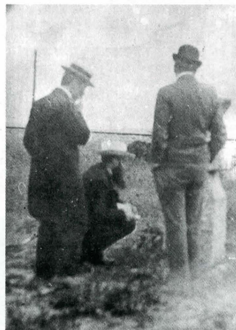
Pe pămînturile boierilor Coțofeni, la începutul veacului al XX-lea.

historique de la Roumanie , cu extra-sele publicate separat de Victor Brătulescu și, pentru București, de Liliana Iorga, ar fi putut să aibă o funcție educativă de care, pare-mi-se, nu s-au bucurat cum se cuvenea 28 . Nici sugestia lui N. Iorga de a se pregăti la Comisie o ediție critică și completă a jurnalului vizitelor canonice ale mitropolitului Neofit I n-a aflat ecou, deși este îndeobște cunoscută valoarea documentară a manuscrisului 2106 de la Academie în privința situației unor monumente din Țara Românească în anii 1746 — 1747 29 .