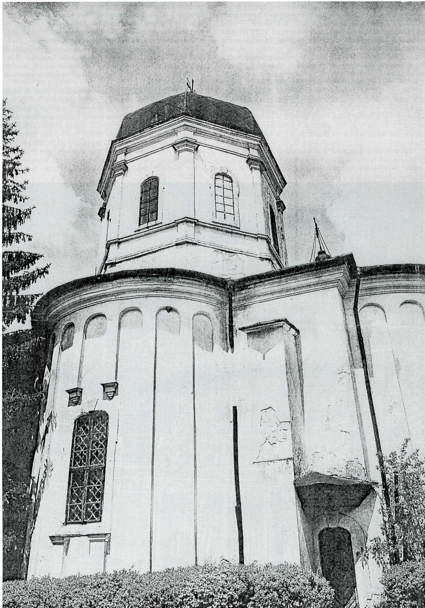
Biserica Adormirii Maicii Domnului. Vedere dinspre sud-est