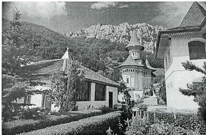
Vechea școală de la Râmeț (azi – muzeul mănăstirii)

Legenda spune că, într-o vreme – sau, folosind începutul Evangheliilor: în vremea aceea... –, apele repezi ale Geoagiului, care izvorăsc din munții Trascăului, au năboit peste matcă din pricina ploilor, ajungând până lângă zidurile mănăstirii Râmeț, și au răscolit micul cimitir care înconjură biserica, luând cu ele osemintele celor ce își dormeau somnul de veci acolo. Desigur, monahi și părinți din acea chinovie străveche. După ce a trecut viitura și apele și-au regăsit matca, domolite, de zidul altarului s-a fost lovit, nelăsându-se dus la vale cu celelalte rămășițe pământești ale fraților adormiți întru Domnul, capul unui monah cunoscut pentru evlavie și osârdia lui duhovnicească și care s-a identificat mai apoi cu acel cuvios Ghelasie de la Râmeț. Astăzi moaștele sale – capul – se odihnesc într-o răcliță în mica bisericuță, ea însăși un giuvaer de mare preț,