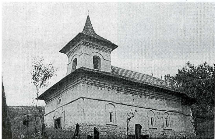
Biserica fostei Episcopii a Geoagiului (sec. XIV)

Apele tumultuoase, dar limpezi ale Geoagiului au săpat o vale îngustă în munții Trascăului, cunoscută sub numele de „valea mănăstirii”, întrucât în apropierea ei se află mănăstirea Râmeț, un monument de o rară frumusețe și valoare istorică, datând din secolul al XIV-lea.