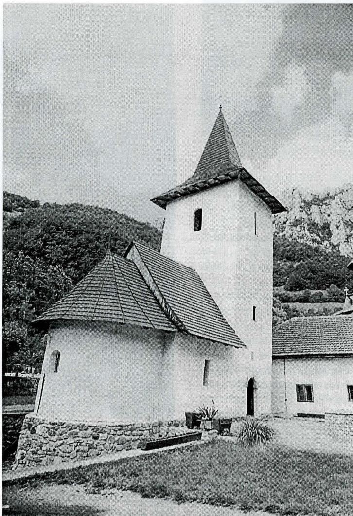
Biserica veche a mănăstirii cu hramul „Izvorul Tămăduirii“

De-aceea, cât încă mai sunt, – și se lasă dezvoltării lumii, năpădiți de ea și copleșiți de povara păcatelor pe care aceasta le-o încredințează în Sfânta Taină a Spovedaniei – nu-i totul pierdut!... Dacă, însă, mâniindu-se pe neamul acesta Dumnezeu, văzându-l mai biceșnic în credință, bună-cuviință și frică de