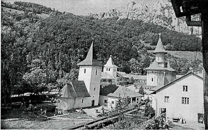
Vedere de ansamblu a mănăstirii Râmeț