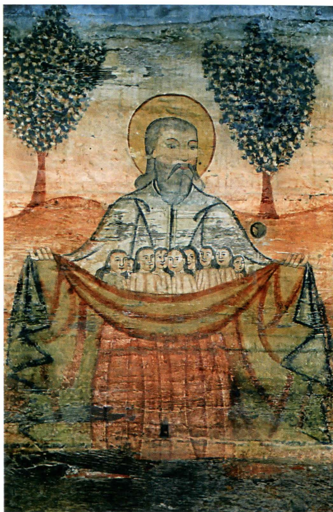
Fig.31 Pronaos, Judecata de apoi, Raiul , detaliu: Patriarh - după restaurare