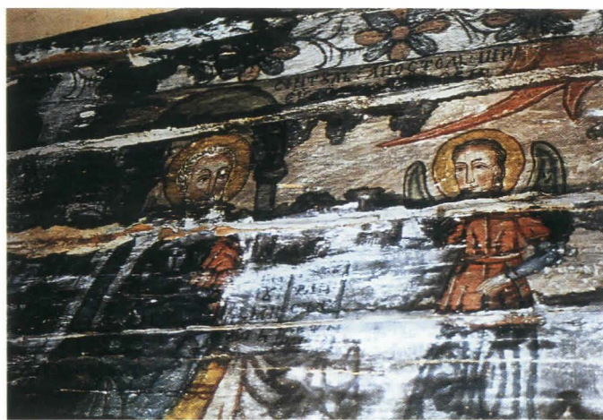
Fig.24. Sfânt Evanghelist, detaliu - în timpul restaurării: taninuri

aplicarea unor benzi de pânză de cânepă de lățimi cuprinse între 5 și 10 cm, în funcție de dimensiunile rosturilor dintre bârne. Benzile textile au fost aplicate cu clei organic atât la interstițiile dintre grinzile componente, la îmbinările lemnului, cât și pe micile porțiuni cu asperități ori cu noduri. Aceste fâșii de pânză formează totodată o zonă ce permite modificări de volum ale lemnului, în