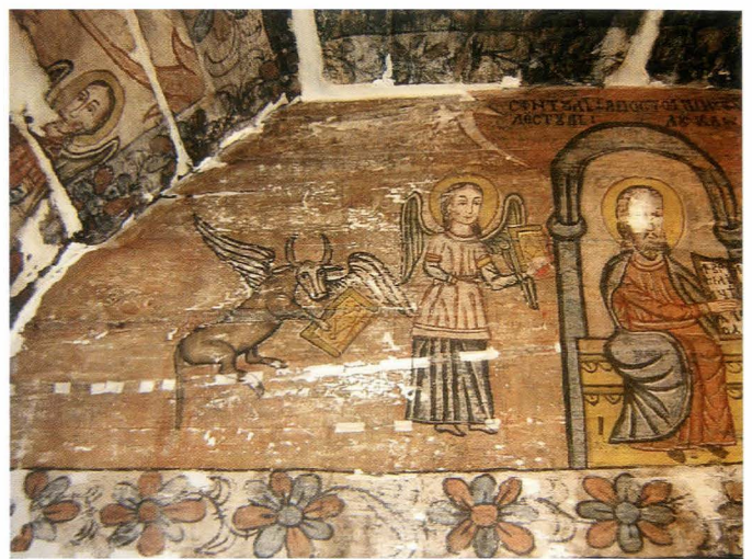
Fig.12. Sfântul Evanghelist Luca , detaliu - în timpul restaurării, faza de chituire

Programul iconografic: Deasupra mesei altarului, pe boltă este zugrăvită Maica Domnului cu Ioachim și Ana încadrată de Îngeri [Fig. 9, 10,], având la nord pe Evanghelistul Marcu , la sud pe Evanghelistul Matei [Fig. 11], iar la est