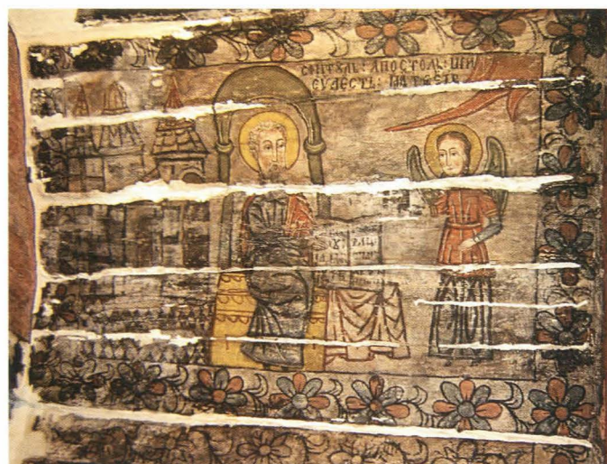
Fig.26. Sfânt Evanghelist, detaliu - în timpul restaurării, faza de chituire

urma variațiilor de temperatură și umiditate, fără a afecta direct stratul pictural. Pe zone limitate,