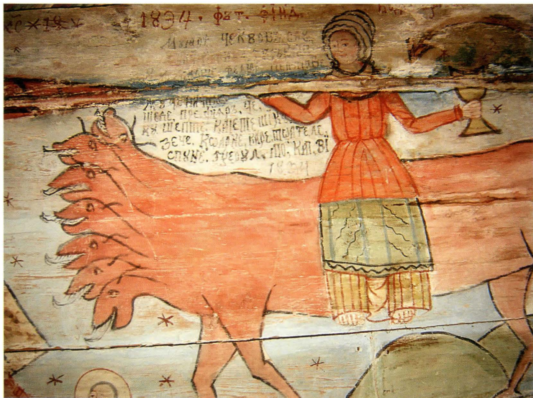
Fig.5. Pictura de sub cafas: Inscripția picturii din 1834, detaliu