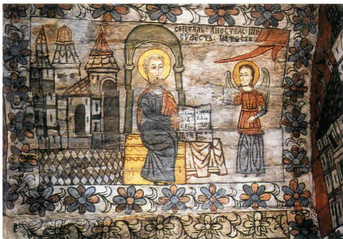
Fig.11. Sfântul Evanghelist Matei - după restaurare

de nord-est a altarului, piesă ce face parte din zestrea inițială a bisericii. Acesta, completat cu scena Învierii , pictată pe perete, reprezintă mormântul din care a înviat Mântuitorul.