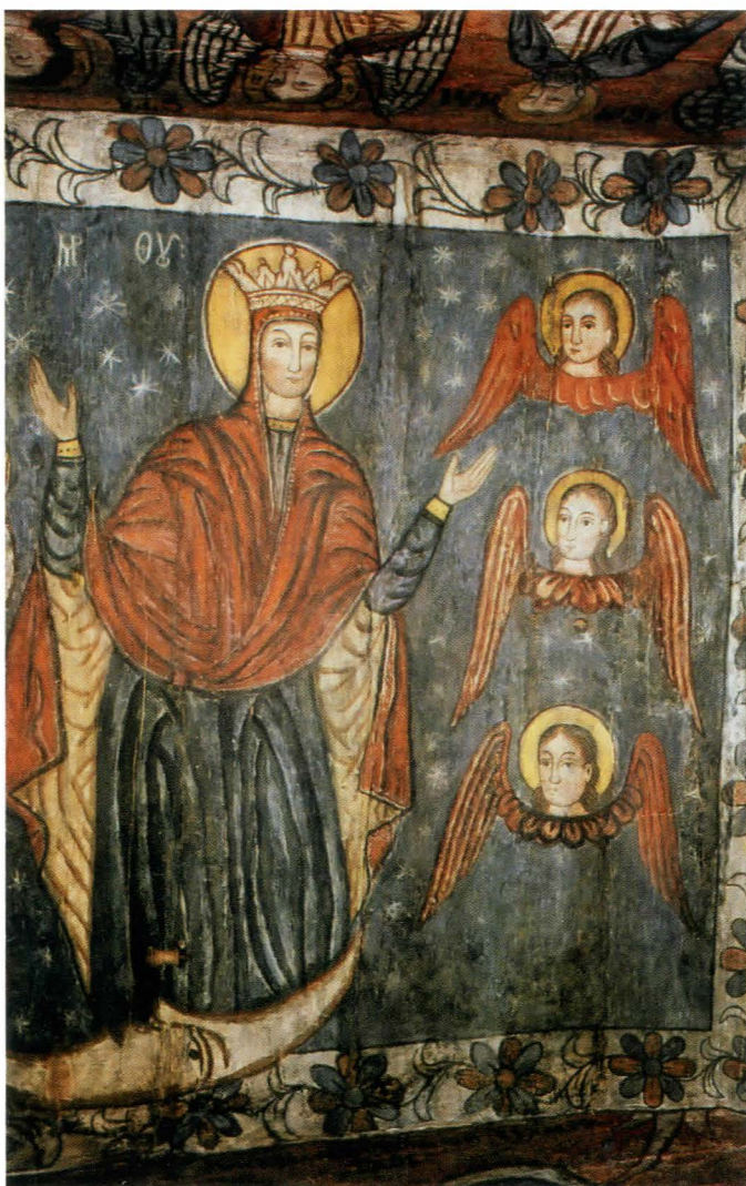
Fig.30. Maica Domnului cu Ioachim si Ana , detaliu - după restaurare