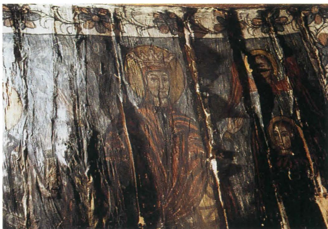
Fig.23. Maica Domnului cu Ioachim și Ana, detaliu - înainte de restaurare

aplicarea unor benzi de pânză de cânepă de lățimi cuprinse între 5 și 10 cm, în funcție de dimensiunile rosturilor dintre bârne. Benzile textile au fost aplicate cu clei organic atât la interstițiile dintre grinzile componente, la îmbinările lemnului, cât și pe micile porțiuni cu asperități ori cu noduri. Aceste fâșii de pânză formează totodată o zonă ce permite modificări de volum ale lemnului, în