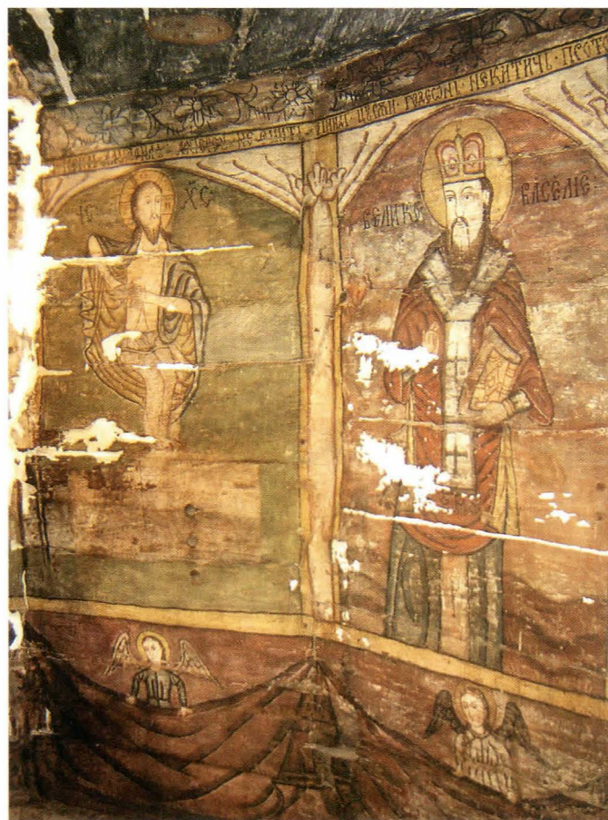
Fig.18. Învierea. Sfântul Ierarh Vasile – în timpul restaurării, faza de chituire

O altă zonă puternic degradată a fost spre sud, unde infiltrațiile de apă din boltă au continuat pe perete, spălând pictura. Totodată, s-au desprins