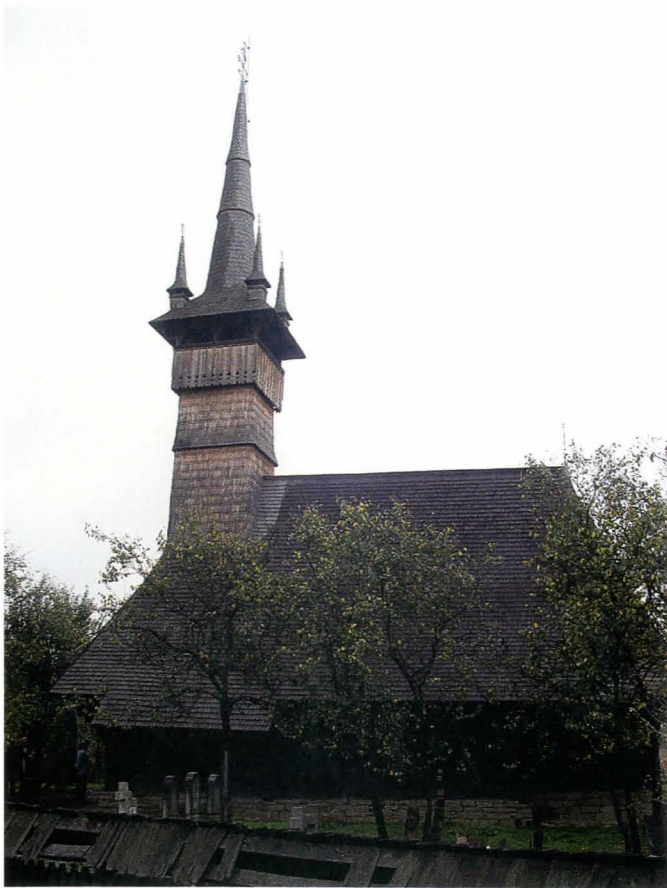
Fig.1. Biserica Sf. Arhagheli din Rogoz, vedere de ansamblu

Așezat pe valea Lăpușului, satul Rogoz - legat administrativ de orașul Târgu Lăpuș - este situat la 6km de acesta, fiind integrat din punct de vedere etnografic în Țara Lăpușului. Aici se regăsesc influențe din nord - dinspre Maramureșul istoric, din sud – dinspre ținutul Bistriței și din vest – dinspre Țara Chioarului. Aflat la confluența