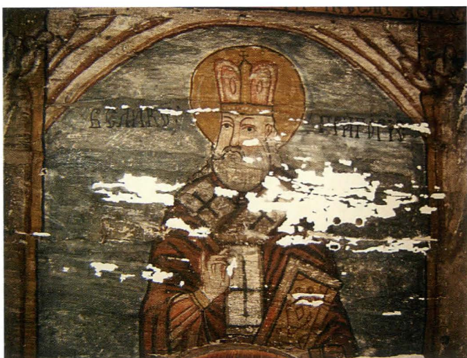
Fig.27. Sfânt Ierarh, detaliu - în timpul restaurării: faza de chituire

în altar pânza a fost înlocuită cu bucăți de hârtie de diferite dimensiuni, provenită din izvoade mai vechi, cu același rol de uniformizare a suprafeței ce urma a fi pictată.