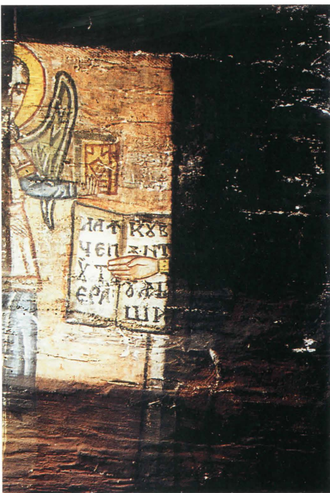
Fig.22. Altar - test de curățire