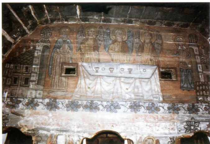
Fig.15. Sf. Treime.altar - ansamblu înainte de restaurare