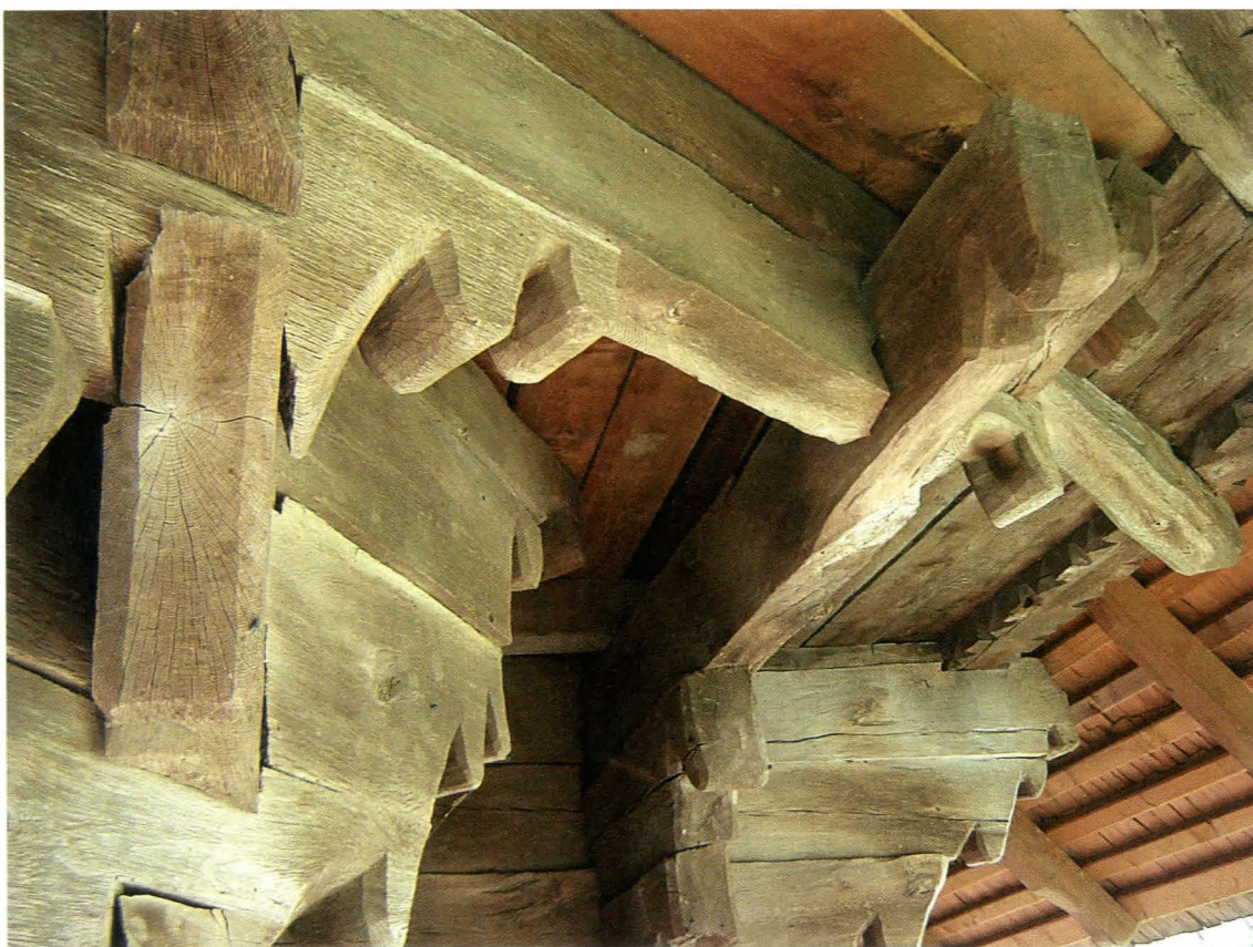
Fig. 2. Îmbinări de bârne la exteriorul pronaosului, detaliu

streașinii pe latura de miazănoapte a bisericii, creându-se astfel pe întreaga lungime un amplu spațiu adăpostit, prevăzut cu o masă pentru pomeni făcută dintr-un singur trunchi de stejar despicat în două, numită de localnici „masa moșilor”. Acolo se așezau cele mai înstărite familii din sat, al căror nume era incizat pe peretele de nord al bisericii în dreptul locului de la masă.