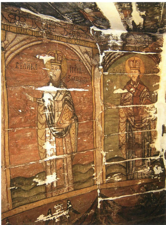
Fig.19. Ierarhi , altar - după restaurare