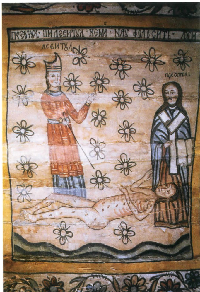
Fig.8b. Bolta naosului, Preotul și levitul - după restaurare

Naosul, cu o pictură diferită de cea din pronaos, păstrată în condiții mai bune, prezintă trei zone intens degradate: zona inferioară a pereților la care lumea a avut acces direct, zona mediană și zona superioară a bolții, cu infiltrații repetate și pictura din cafas, supusă unei uzuri intense.