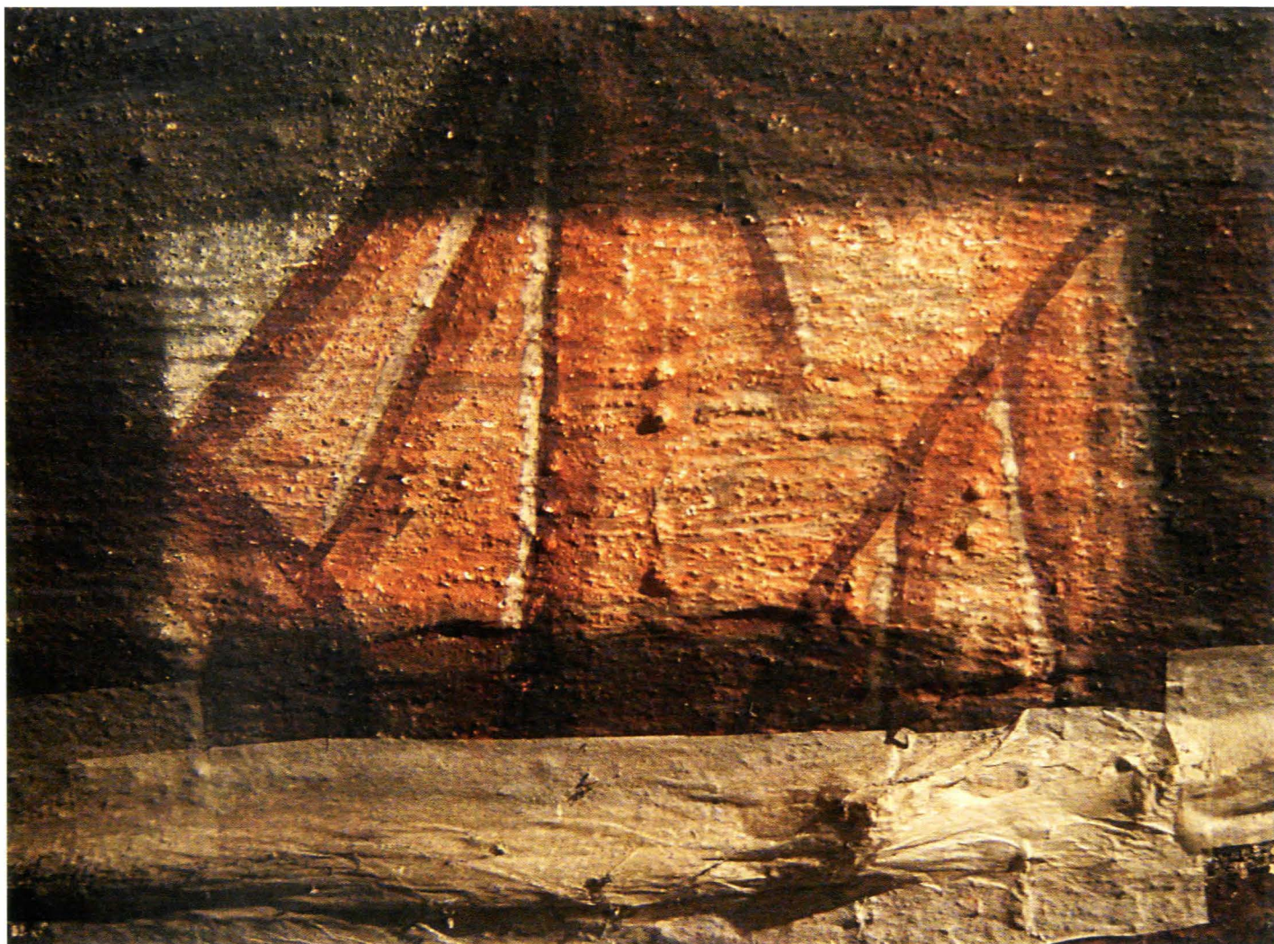
Fig.29. Test de curățire

rămase nesolubilizate s-a făcut mecanic cu ajutorul bisturiului și a solvenților organici în cazul aglomerărilor de ceară și grăsimi de pe suprafață.