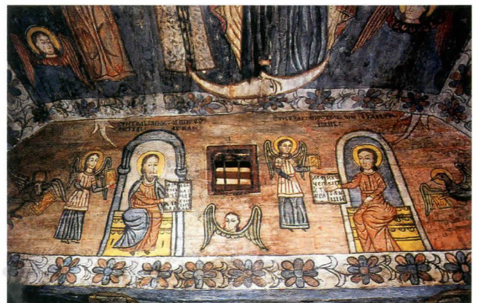
Fig.14. Bolta altarului - după restaurare

pe Evangheliștii Luca [Fig. 12] și Ioan Teologul [Fig. 13, 14].