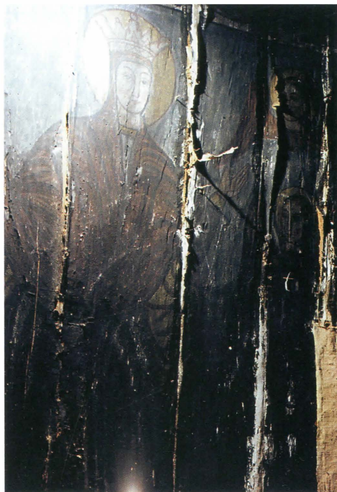
Fig.21. Maica Domnului cu Ioachim și Ana , detaliu, - înainte de restaurare