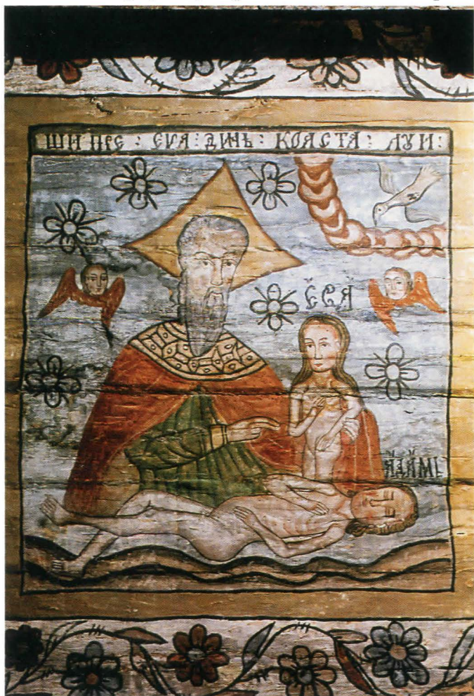
Fig. 6. Bolta naosului, Facerea Evei din coasta lui Adam - după restaurare

Programul iconografic aparține în principal tradiției ortodoxe cu influențe occidentale în modul de redactare și plasare a scenelor mai importante. Ca și în celelalte biserici de lemn din zona Lăpușului, pictura tinde să acopere