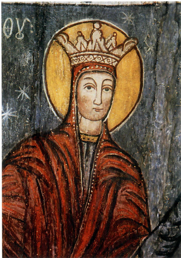
Fig.28. Maica Domnului cu Ioachim și Ana , detaliu, după restaurare

Lucrările de intervenție urgentă pentru consolidarea profilactică a stratului pictural , efectuate în campania 1997, au făcut posibilă începerea lucrărilor de consolidare a structurii de rezistență a monumentului, de înlocuire a unor elemente degradate și îndepărtarea intervențiilor necorespunzătoare, conform proiectului arhitectural de restaurare. Înaintea intervenției constructorului la structura bisericii, degradările active ale stratului pictural au fost protejate prin aplicare de foiță japoneză cu scopul de a preveni eventualele