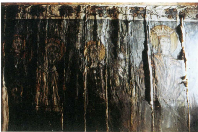
Fig. 9. Maica Domnului cu Ioachim și Ana , detaliu, înainte de restaurare