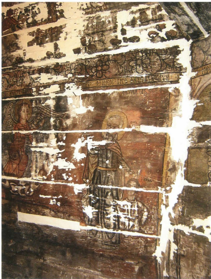
Fig.20. Jerfa lui Avraam , detaliu - faza de chituire

și s-au pierdut bezile textile originale ce acopereau interstițiile și îmbinările lemnului, lăsând curenții de aer să pătrundă liberi din exterior [Fig. 21, 26].