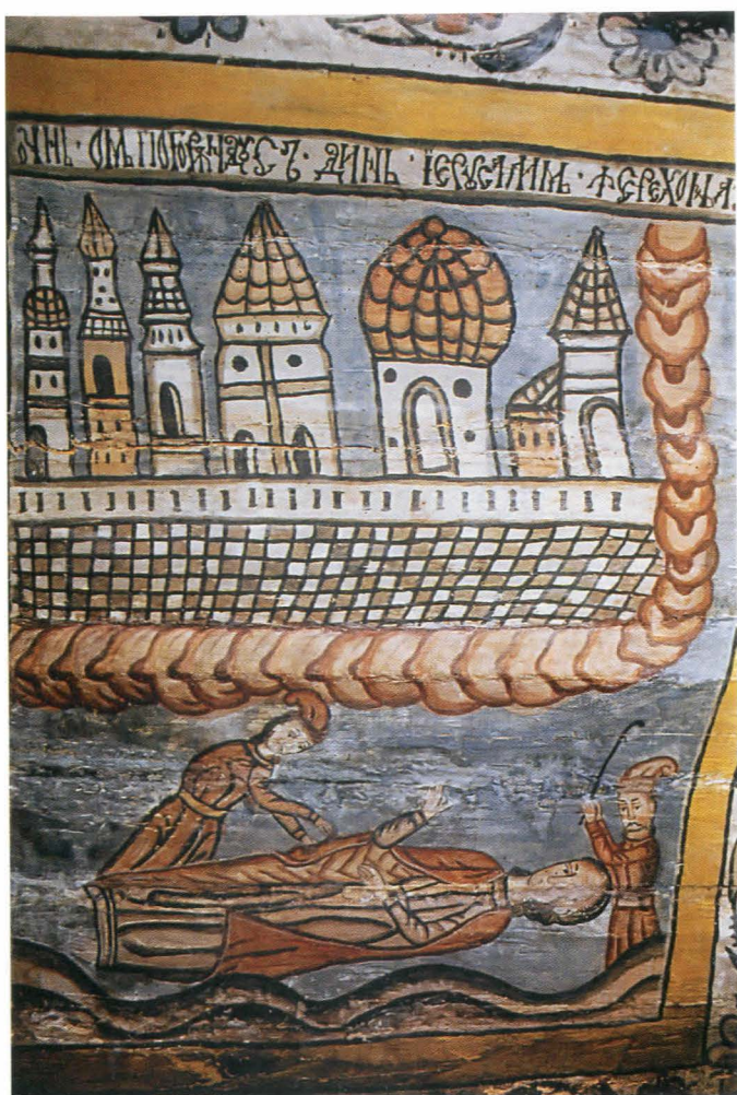
Fig.8a. Bolta naosului, Pilda celui căzut între tâlhari - după restaurare