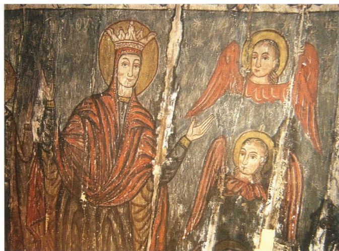
Fig. 25. Maica Domnului cu Ioachim și Ana, detaliu - în timpul restaurării: taninuri