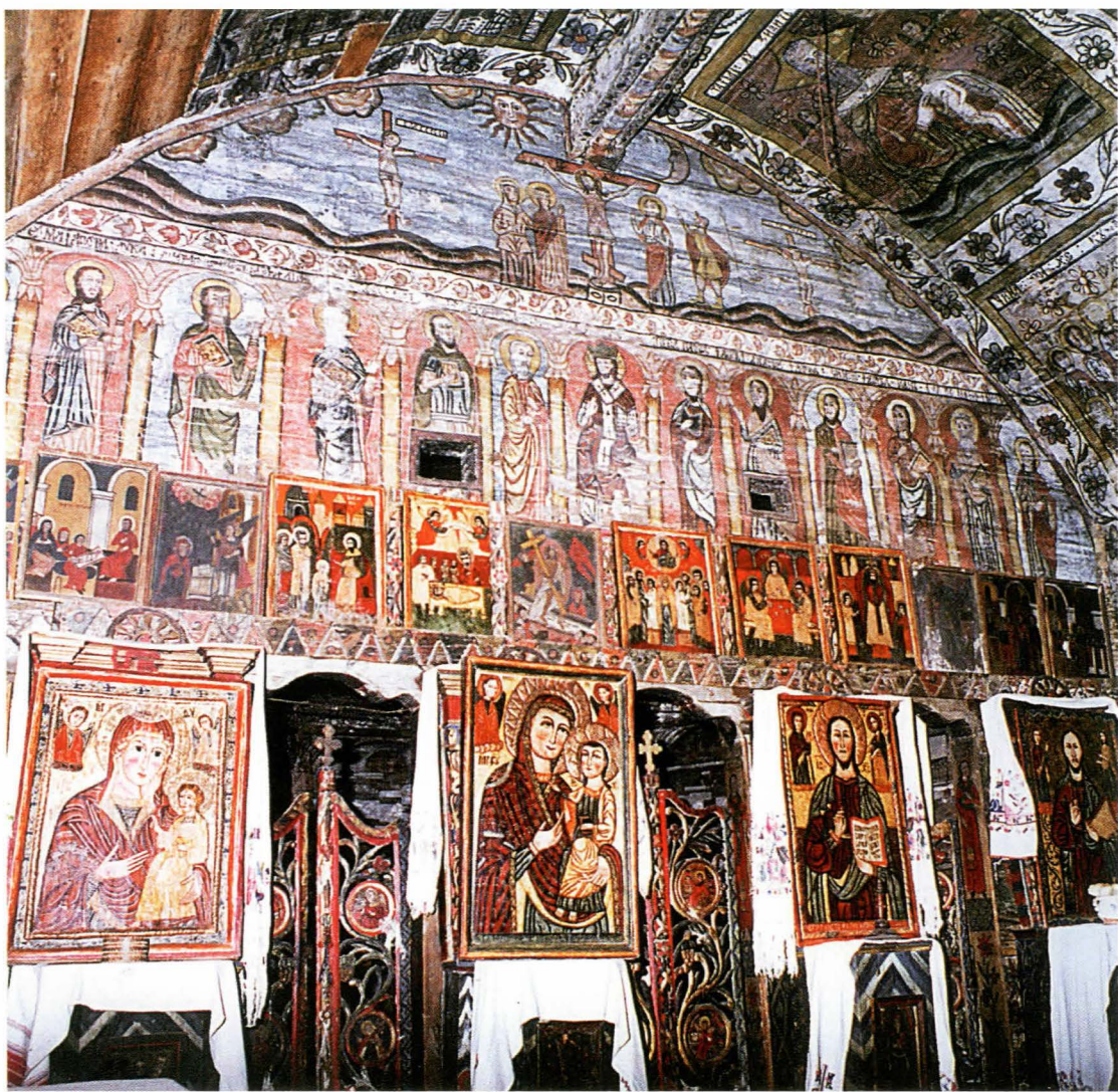
Fig. 4. Iconostasul și fragment din bolta naosului