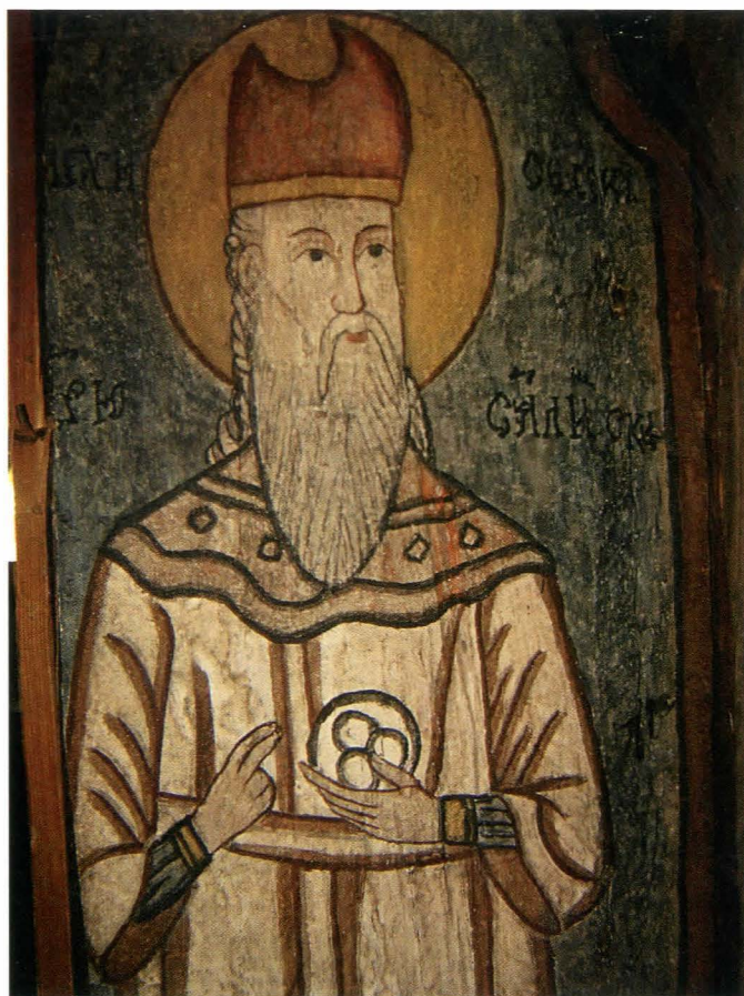
Fig.17. Marele Preot Melchisedec, detaliu - după restaurare

ia. În partea inferioară a altarului se află scena Învierii [Fig. 18], Sfinții Ierarhi Vasile cel Mare, Grigore, Ioan Gură de Aur și Atanasie [Fig. 19], Jertfa lui Avraam [Fig. 20] - spre nord și Pilda celor zece fecioare - spre sud.