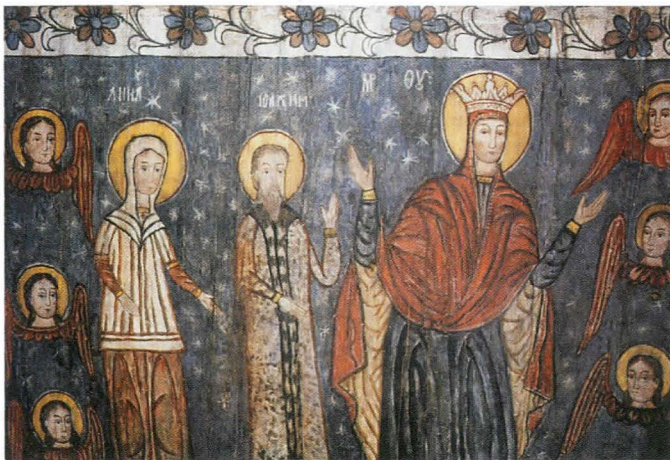
Fig.10. Maica Domnului cu Ioachim și Ana , bolta altarului - detaliu, după restaurare