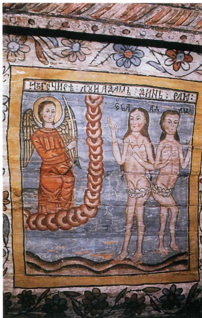
Fig. 7. Bolta naosului, Izgonirea lui Adam din Rai - după restaurare

Naosul cuprinde scene mari, ilustrând episoade din Geneză ca: Facerea lui Adam , Facerea Evei [Fig. 6], Ispitirea șarpelui , Izgonirea lui Adam și a Evei din rai [Fig. 7], Cain și Abel . Un alt tip de scene sunt cele cu semnificație moralizatoare ca: Pilda bunului Samaritean [Fig. 8a, 8b], Sodoma și Gomora , Pilda celor doi frați , și scene din ciclul Minunilor lui Iisus Hristos .