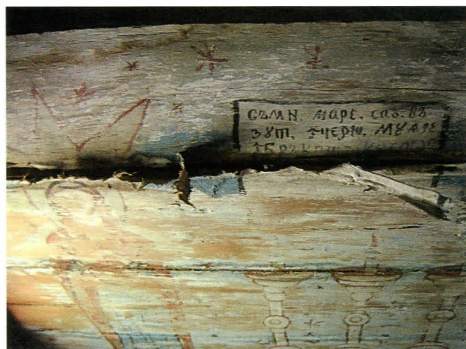
Fig. 3. Pictura de sub cafas

Odată cu montarea cafasului din naos s-a schimbat și accesul în turn, care inițial era prin pronaos. Accesul în pod a fost posibil ulterior printr-o ușă decupată în timpanul dintre naos și