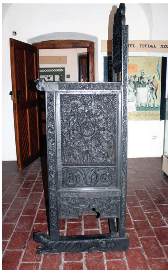
Fig. 9 - Jilț arhieresc (detaliu, panou lateral, poale, tălpi).