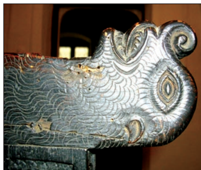
Fig. 11 - Jilț arhieresc (detaliu, brațe)