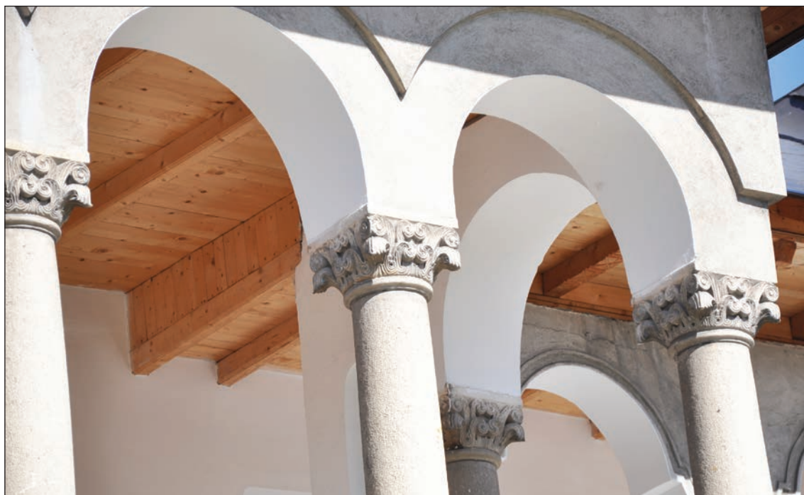
Fig. 2 - Casa brâncovenească. Foișor

ISPRAVNICI, LEAT 7220", deci 1712 13 (Fig. 3). Meșterul Lupu, sculptor în piatră ce lucra în 1712 la Câmpulung, își pusese pecetea talentului său și la mănăstirea brâncovenească din Râmnicu Sărat (1691-1697) 14 .