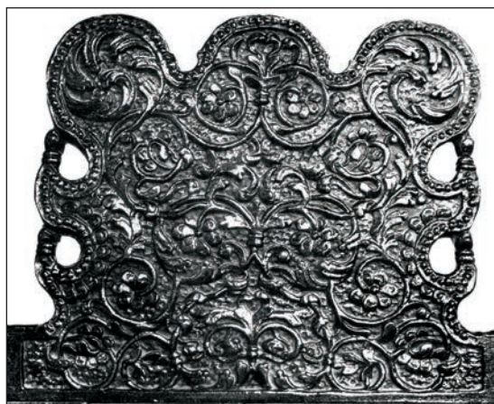
Fig. 14 - Strană (fronton), Biserica Colțea, București, începutul sec. XVIII