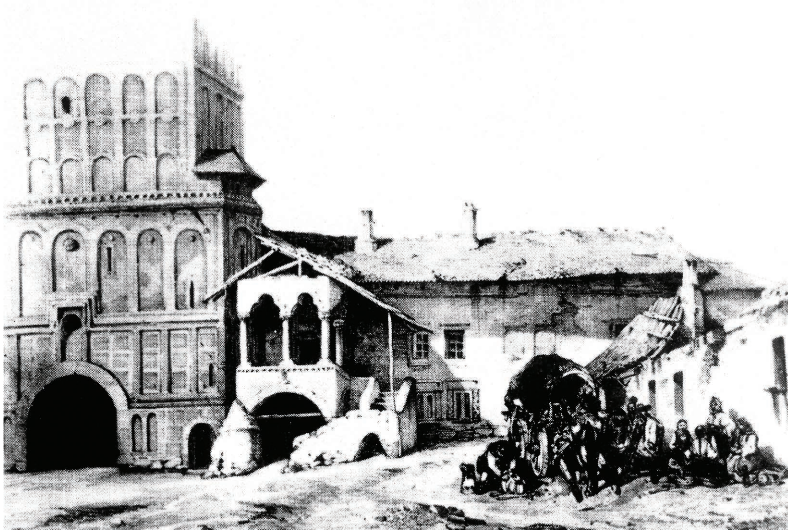
Fig. 1 - Turnul clopotniță și casa brâncovenească de la mănăstirea "Negru Vodă" (desen de M. Bouquet, 1840).

la domnie, precizând că „ce-l va găsi cu socoteală că au mâncat și au cheltuit fără de ispravă va pune la loc”. Logofătul de divan trebuia să aleagă din obștea mănăstirii Cozia un alt egumen mai de ispravă și mai vrednic, „iar pentru celălalt egumen ce au fost mai înainte - Mihail - care iaste acum la Câmpul Lung - de vreme ce cât a egumenit nu i s-a luat seama, când va fi la Bobotează și veniind toți egumenii după obicei, veți veni și unii din voi cu egumenul acesta nou ce se va așeza și să va lua seama și aceluia de la Câmpul Lung iar acestui ce iaste acum îi vor lua acum seama acolo la mănăstire și va fi și lipsit de egumenie, că așa iaste porunca Domniei mele” 7 .