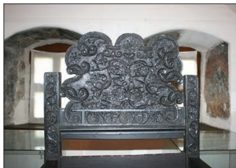
Fig. 8 - Jilț arhieresc (detaliu, fronton)