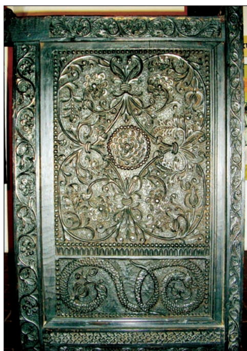
Fig. 10 - Jilț arhieresc (detaliu, panou lateral)