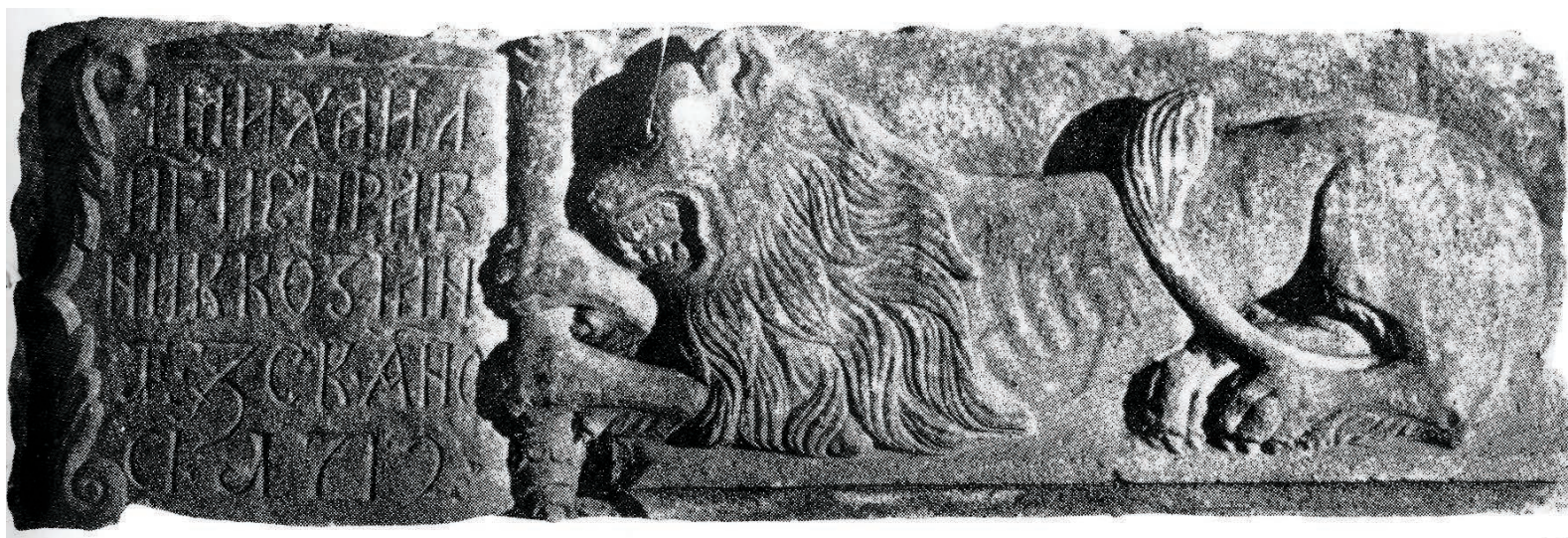
Fig. 4 - Relief de piatră așezat inițial pe zidul de vest al casei din sudul turnului clopotniță, 1712. Inscriptia menționează numele egumenului ispravnic Mihail.

Jilțul prezintă un spătar înalt (1,80 m), un șezut simplu (0,30 x 0,60 m), două panouri laterale pline (0,98 x 0,50 m), încadrate pe verticală de montanți cu plan rectangular (6,5 x 4,5 cm) ce formează, în partea inferioară, picioarele.