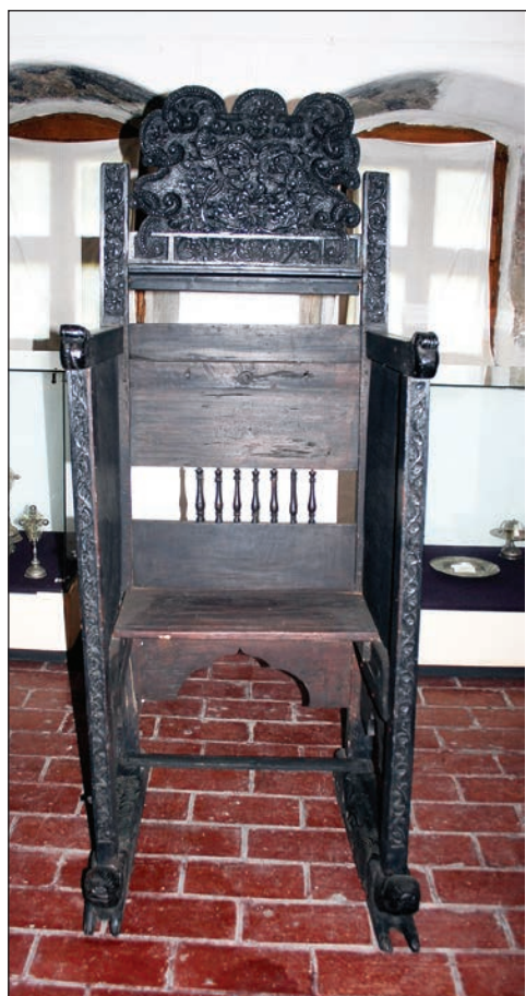
Fig. 7 - Jilț arhieresc, Mănăstirea "Negru Vodă", începutul sec. XVIII