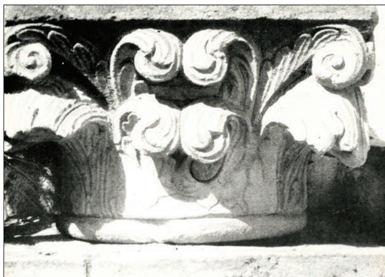
Fig. 6 - Capitel brâncovenesc

În Biblie, șarpele este amintit în câteva ipostaze. În sens negativ, el este întruchiparea Satanei în Paradis (Geneza, 3:1-14). În sens pozitiv, șarpele este menționat ca toiag a lui Aaron, toiag preschimbat în șarpe ce înghite reptile asemănătoare lui, create de vrăjitorii de la curtea faraonului (Exodul, 7: 8-13), dar și ca „șarpe de aramă”,