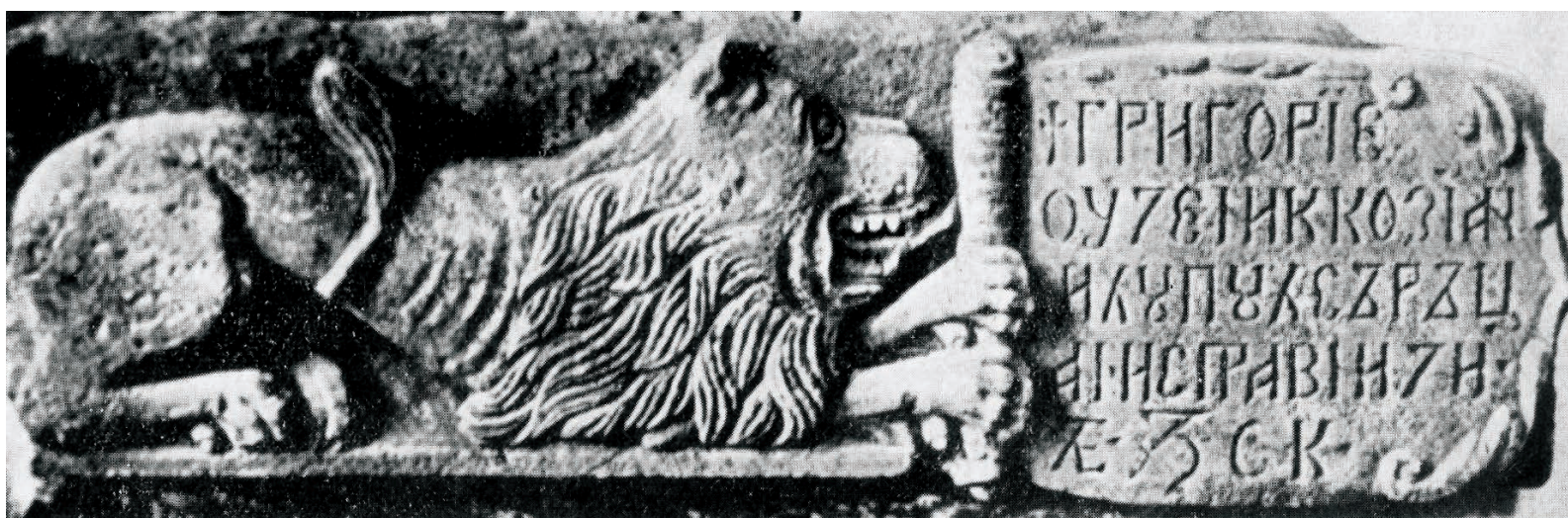
Fig. 3 - Relief de piatră așezat inițial pe zidul de vest al casei brâncovenești, 1712. Inscripția menționează numele meșterilor ispravnici "Grigorie, ucenic cozian" și "Lupul Sărățan".

aici și alte remarcabile construcții. În fața bisericii a fost zidit un „amvon” 20 și tot atunci zidurile mănăstirii au fost refăcute și consolidate, așa cum amintește un pomelnic de la jumătatea aceluia secol: „întru acestuia igumenie (Mihail ieromonah n. n.) s-au făcut cetatea împrejurul monastirii, leat 7220 (1711- 1712)” 21 . Se presupune că Mihail plănuise și executarea unui pridvor în fața bisericii. Mărturie stau câteva capiteluri (Fig. 6), fusuri sau baze de coloană, rămase nefolosite 22 . În anul 1714 egumenul Mihail se stingea din viață lăsând multe dintre proiectele acelor ani neînfăptuite. Piatra sa de mormânt, aflată la biserica bolniței mănăstirii Cozia 23 , este opera lui Grigorie, același meșter care îi executase portretul în piatră, cu doi ani în urmă. Inspirat, desigur, de reliefurile romanești căprioara șezând , încastrat astăzi pe zidul de vest al casei brâncovenești de la mănăstirea „Negru Vodă”, artistul cioplitor în piatră va reda în colțurile inferioare ale pietrei tombale amintite, câte un cerb în poziție șezând.