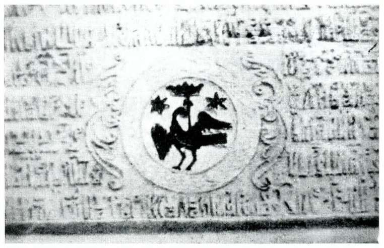
Fig. 4. Detaliu din pisania bisericii din Gherghița.

Totuși, trebuie remarcat că placa de piatră a pisaniei de la Filipeștii de Tîrg prezintă încă partea superioară a unui ancadrament cu baghete, deci că soluția a fost încercată, dar că apoi s-a renunțat la ea. Ea reprezintă din cîte știm astăzi prima atestare a unui asemenea tip de ancadrament, anterior