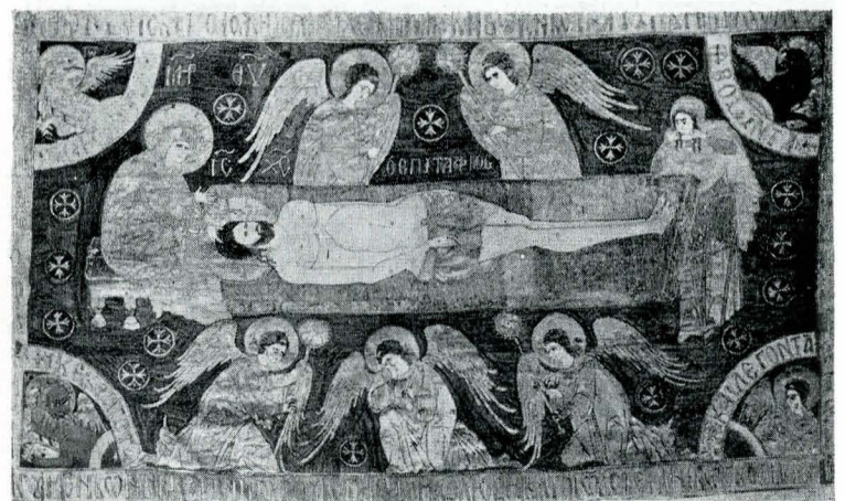
Fig. 6. Epitaful de la mănăstirea Neamț, 1437.