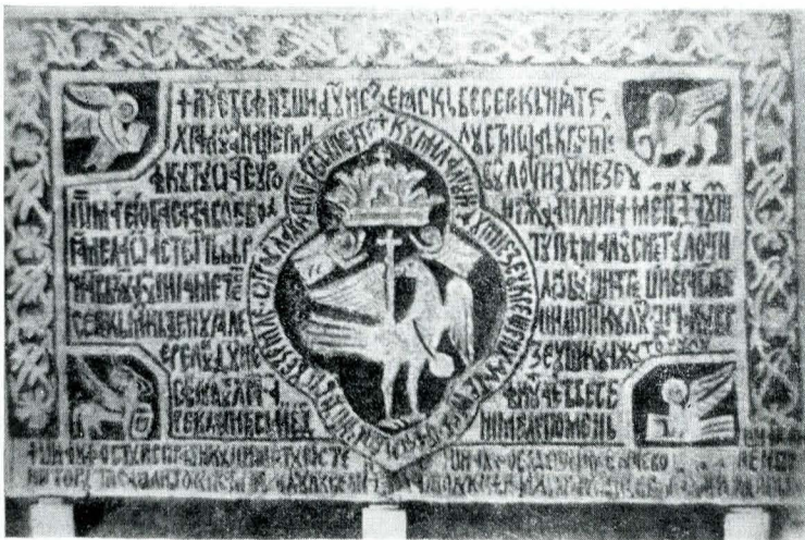
Fig. 1. Pisania fostei mănăstiri din Măxineni.