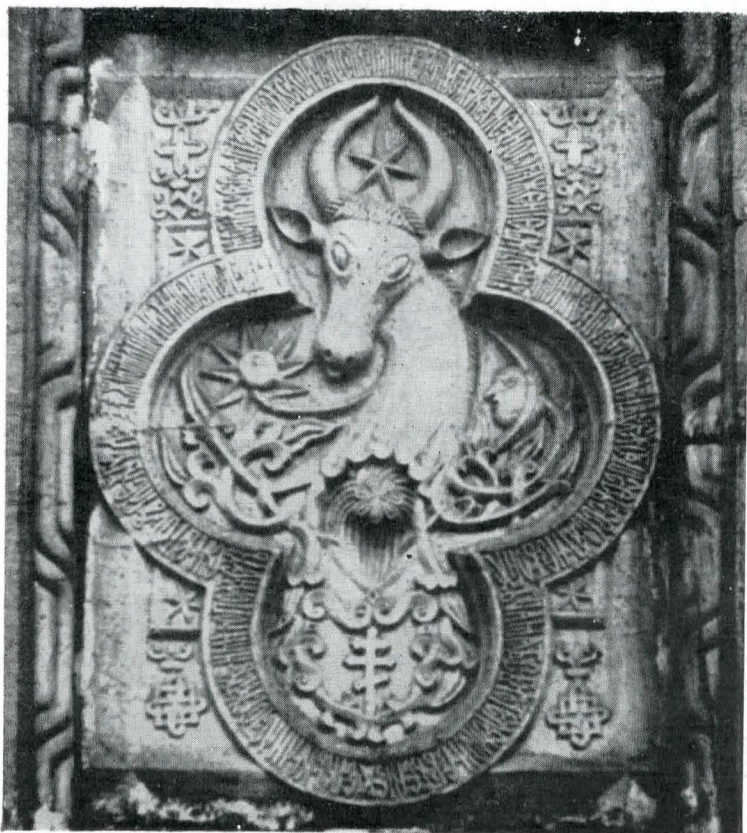
Fig. 5. Pisania incintei mănăstirii Dragomirna.

secolului al XV-lea de la clopoțnița mănăstirii Dealu, simple peceți în piatră ale comanditarilor de rang voievodal, și apropierea în spirit cu pisania bisericii Sf. Dumitru din Suceava.