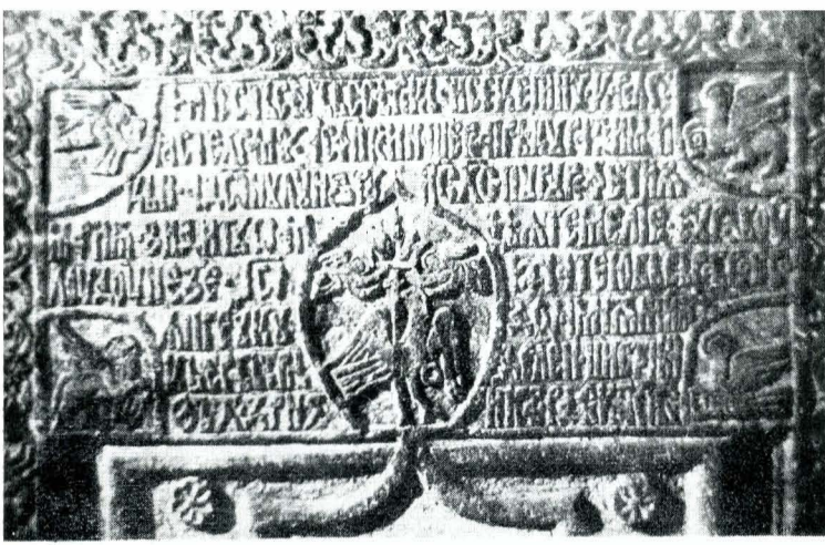
Fig. 3. Pisania schitului Pinu.

de la Măxineni, la un monument modest, dar tot ctitorie voievodală, construit sub supravegherea unui ispravnic unic, căci inscripțiile îl desemnează cu același nume și același rang: Radu vel căpitan. Dar nerepetarea inscripției în jurul stemei și o tratare mai frustă a reliefului dovedesc o altă mână în alcătuirea pisaniei, a unei persoane nefamiliarizate cu uzanța benzii purtătoare de text votiv și, în același timp, cioplitor mai puțin experimentat, care execută la cerere, după model, pisanie de la Pinu.