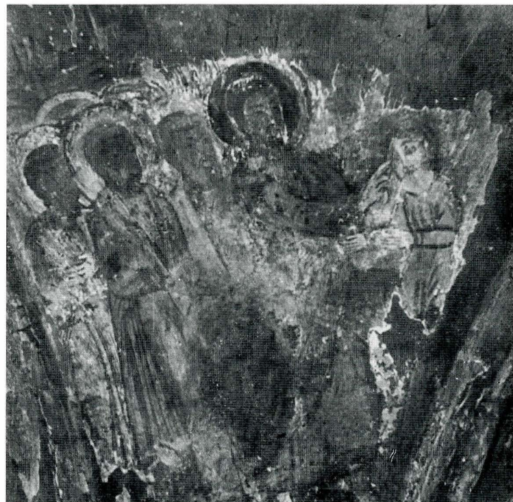
Fig. 6. „Învierea lui Lazăr” — pictură din naos.

leagd 41 (fațada de sud a navei), de pictura transilvăneană a „sintezelor locale” de la Rîmeț (1400), 42 cît și din picturile din secolul al XVI-lea din Țara Românească de la Stănești Lungești (Vîlcea).