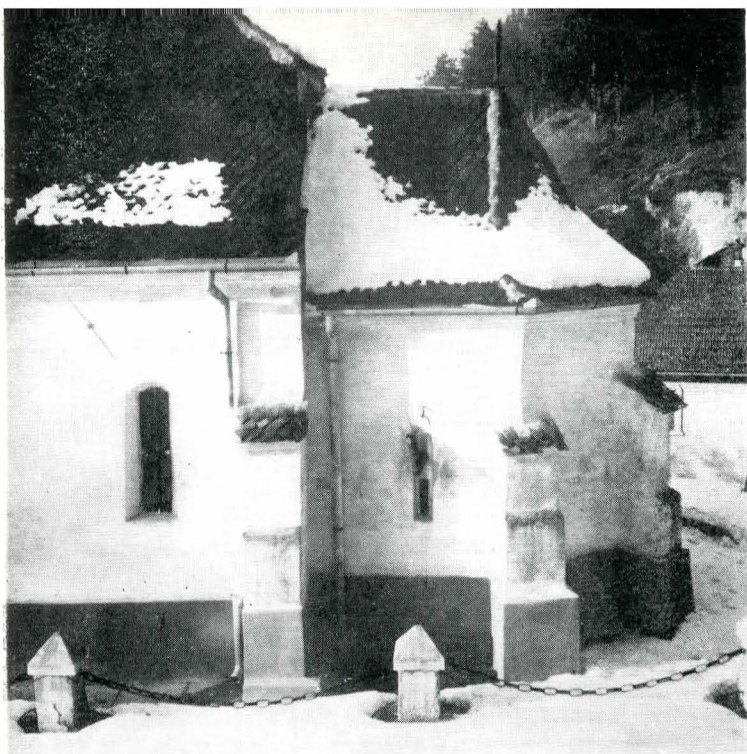
Fig. 2. Biserica Sf. Nicolae Vechi din Rîșnov (Absida altarului).

scund și mai îngust), a suferit și el probabil unele intervenții ulterioare căci O. Lugoșianu 18 , cînd vizita monumentul la sfîrșitul secolului al XIX-lea, a mai putut citi în exterior „Renovatum anno...”. Bolta altarului, avînd rolul de a acoperi spațiul format de laturile pentagonale ale zidurilor tinde spre o semicalotă, proprie arhitecturii ortodoxe, dar muchiile pentagonului se continuă și se pot observa pînă la punctul de incidență 19 .