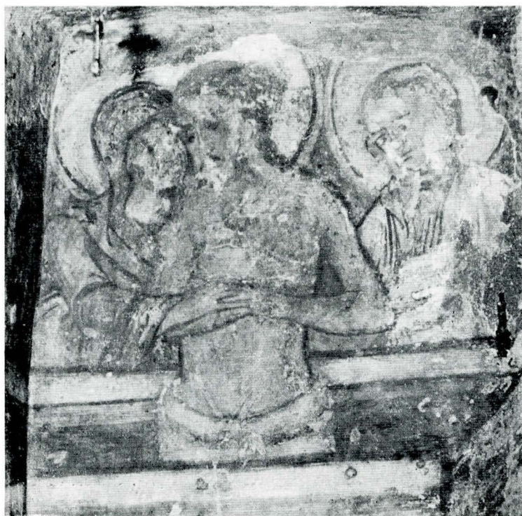
Fig. 5. Isus al Milelor (Vir dolorum) — pictură din proscomidie.

Istoria acestei biserici, un nou argument pentru neîntreruptele legături între cele două provincii românești, Țara Românească și Transilvania, se împletește cu istoria populației românești de pe aceste meleaguri ale cărei prezență și persistență sînt atestate în numeroasele documente ale epocii 28 .