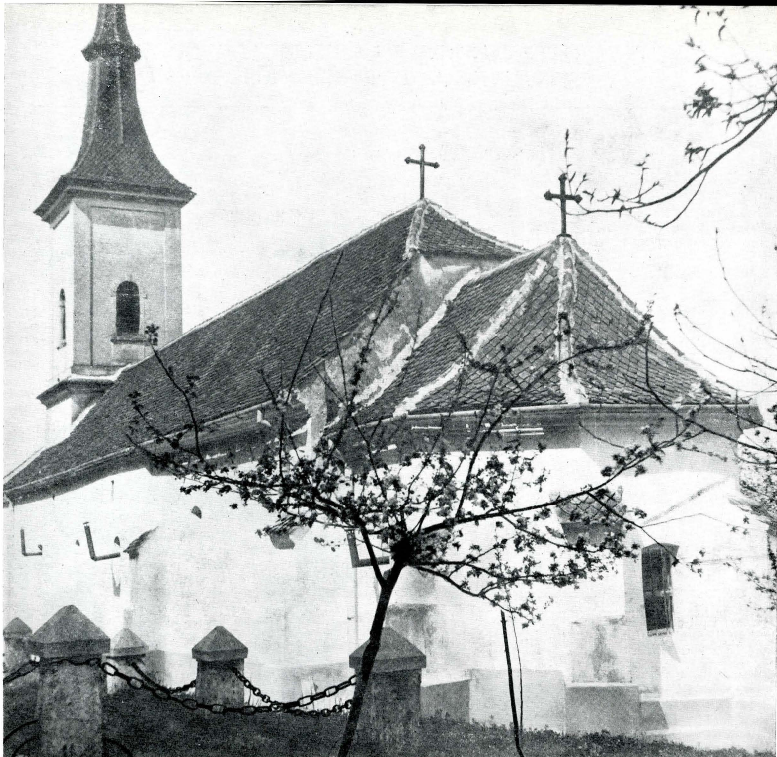
Fig. 1. Biserica Sf. Nicolae Vechi din Rîșnov (ansamblu).

continuă a zidului, de cca 15 cm în interior pînă la cca 2,4 m înălțime de la sol, adică pînă la nivelul consolelor 13 .