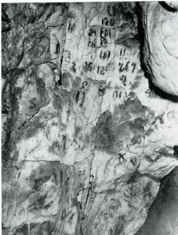
FIG. 1. PESCARI, PEȘTERA „GAURA CHINDIEI” II. INSCRIȚIA CHIRILICĂ DE PE PERETELE DE NORD-EST, ÎN DREAPTA INTRĂRII.