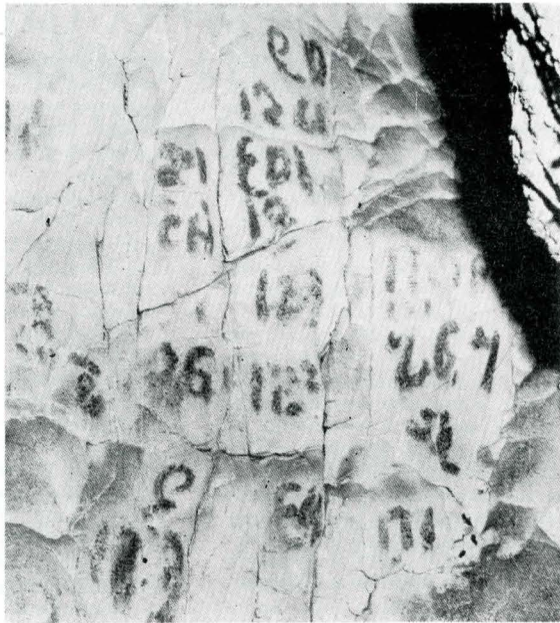
FIG. 2. PESCARI, PEȘTERA „GAURA CHINDIEI” II. INSCRIȚIA CHIRILICĂ (FOTOGRAFIATĂ ÎN CEA MAI MARE PARTE).