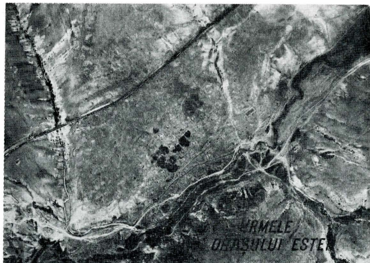
Fig. 2 Zona oraşului Ester, fotografie aeriană din 1969.

Astfel, urmele fostului oraş se găsesc pe valea Gura Dobrogei la cca 2 km înainte de confluenţa acesteia cu riul Casimcea, poziţie identică şi cu ruinele Gura Dobrogei figurate pe harta la scara 1:25.000. Se găsesc într-adevăr la poalele unui deal ale cărui cote maxime ating 150—160 m