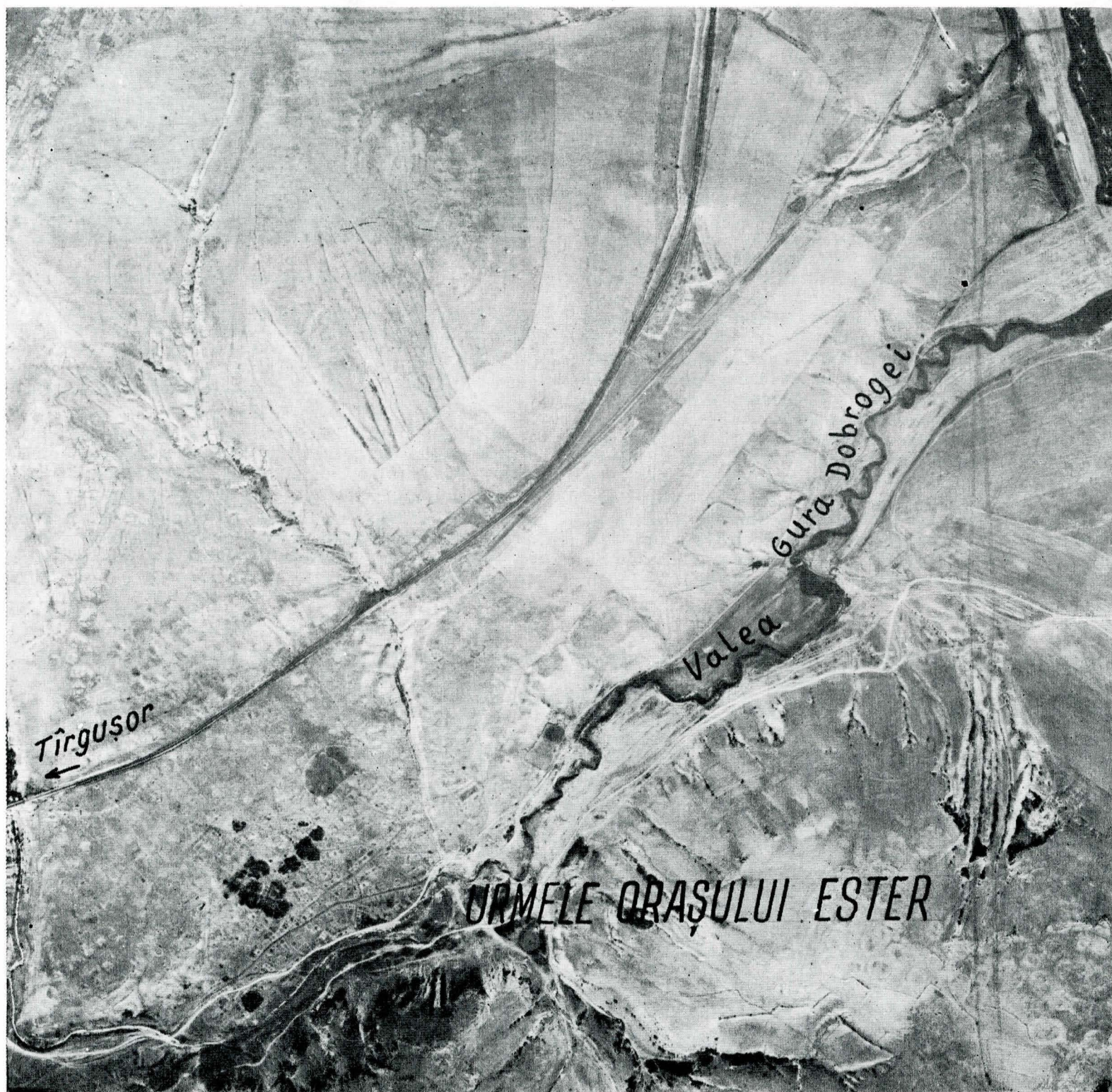
Fig. 4 Fotografia aeriană a zonei orașului Ester și împrejurimi, 1969.

Relatările solului polonez Toma Alexandrovici făcute în 1766, cum că orașul era „în ruine, între stînci”, se confirmă prin faptul că întreaga așezare este mărginită la sud, sub valea Gura Dobrogei, de un versant stîncos, cu o diferență de nivel de cca 70—80 m, localitatea însăși fiind așezată pe o pantă a cărei diferență de nivel este