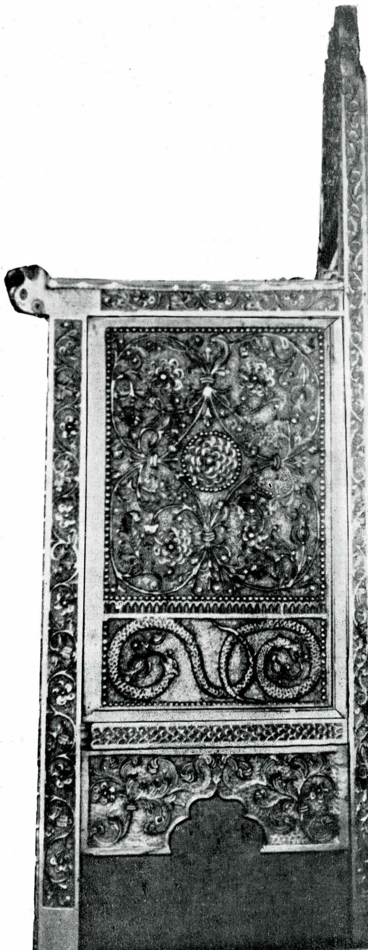
1. Jețul domnesc de la mănăstirea Negru Vodă din Cîmpulung Muscel-detailiu