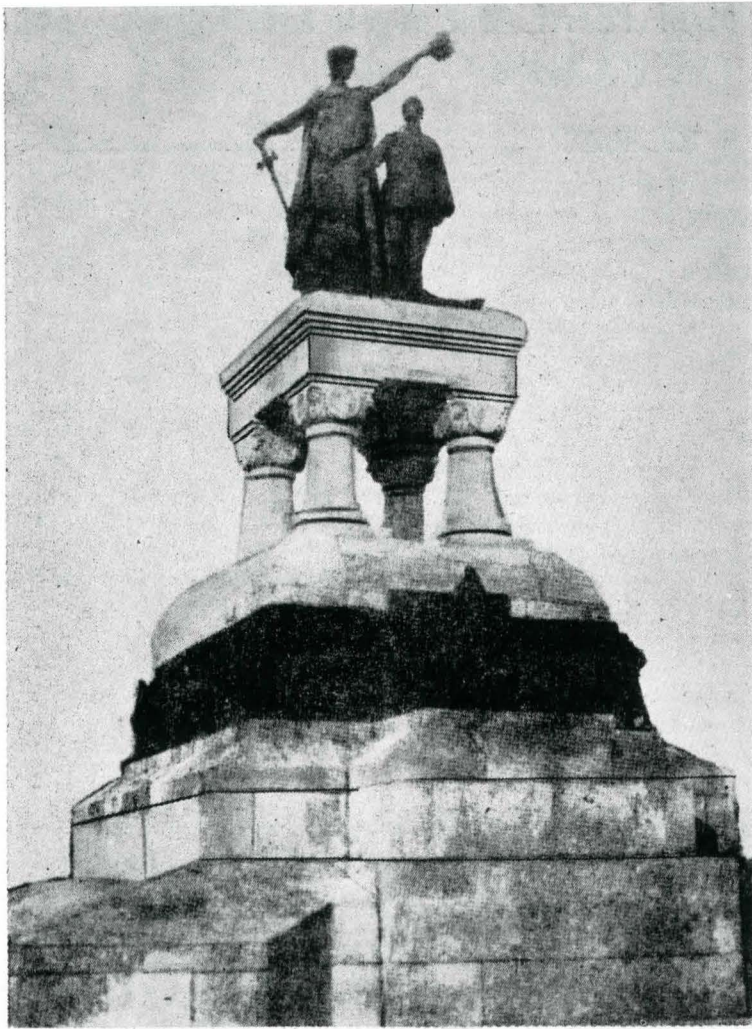
1. Monumentul eroilor militari — București 2. Mausoleul eroilor — Mărășești, jud. Vrancea