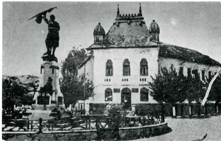
5. În memoria eroilor prahoveni — Urlați , jud. Prahova

În perioada 1919—1940, ca urmare a activității desfășurate de societățile Mormintele eroilor căzuți în război și Cultul eroilor și de Asociația Cultul Patriei , toată suflarea românească a vibrat cu emoție și a îmbrățișat, cu gândul sau cu fapta, opera măreață de cinstire a eroilor neamului. Așa cum se apreciază în literatura istorică a vremii, a fost epoca tuturor inițiativelor care au depășit orice cadru de organizații permanente, iar mijloacele materiale ce se ofereau erau de-a dreptul impresionante. Întreaga națiune