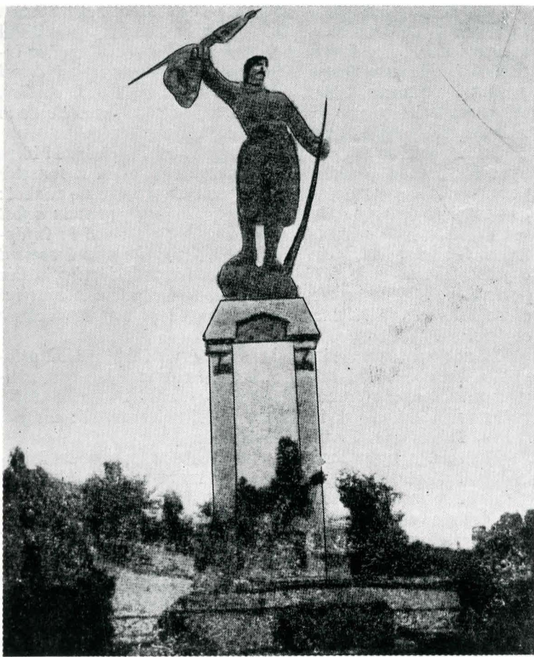
4. Monument ridicat în memoria celor căzuți în 1916—1918 — Techirghiol — jud. Constanța

au fost de la înființarea asociației, în număr de 121, dintre care : 41 generali și ofițeri superiori și inferiori, activi și de rezervă, între ei fiind cunoscuții generali C. Dragu, G. Jiti-anu, I. Manolescu, N. Petala; 18 profesori și profesori universitari, printre ei profesorii universitari D. Gusti, C. Rădulescu-Motru, dr. Gh. Marinescu; 18 înalți funcționari de stat; 9 doctori umani și veterinari; 14 avocați; 7 ziariști, între care C. Bacalbașa; 4 ingineri; 2 artiști plastici; 2 industriași; 1 arhitect; 1 preot profesor universitar; 2 judecători și 2 proprietari 18 . Membrii de onoare erau aleși de Comitetul central și recomandați adunărilor generale, din rindurile celor care „ au făcut bine neamului românesc ” 19 . Membrii activi erau socotiți cei care erau înscriși în asociație și se angajau să propage cultul patriei, iar membrii aderenți, „ .../ toți bunii români care își spun dorința să facă parte din Asociația Cultul Patriei ” 20 .