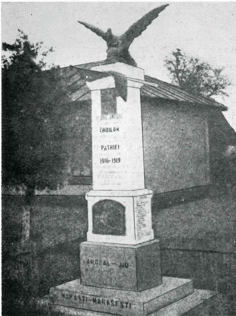
6. Monumentul eroilor din comuna Peșteana de Jos , jud. Gorj

română era angajată în cinstirea și comemorarea eroilor săi.