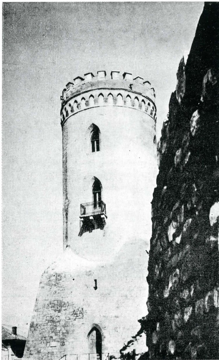
Tirgoviste. Turnul Chindiei din curtea domnească existentă în timpul lui Mircea cel Bătrîn (1386—1458).

Se pare că prima așezare fortificată s-a înjghebat în secolul al XII-lea pe dealul Cetății, care domină orașul cu cele două platouri ale sale, unde s-au desfășurat mai