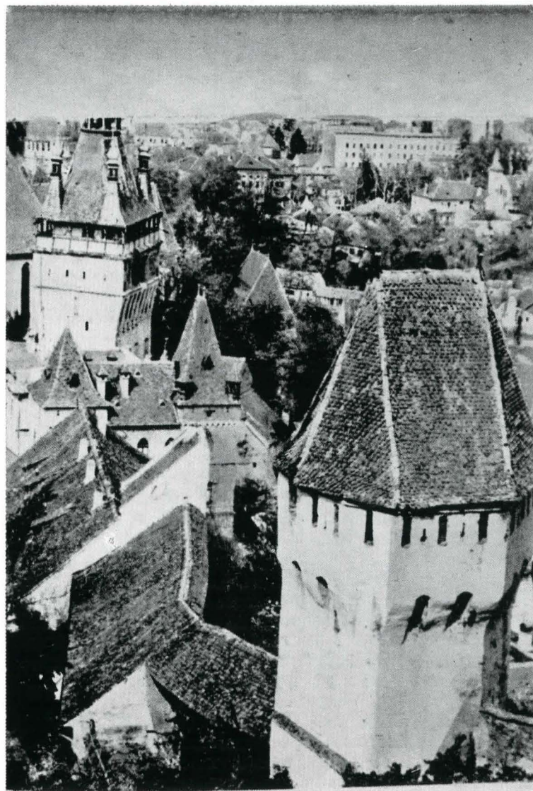
Turnul croitorilor și Turnul cu ceas se privesc peste acoperișurile caselor sibișorene înșirate de-a lungul zidului cetății.

va comporta în mod necesar distrugerea trecutului și că trecutul va putea fi salvat și inclus în prezent 5 .