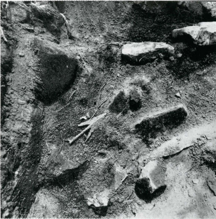
4. Ostrovu Mare . Mormîntul nr. 1, detaliu (1976).