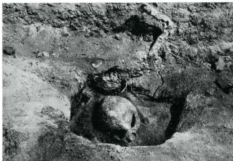
2. Castrul roman Hinova . Turnul de nord-est. Descoperirea unei amfore.