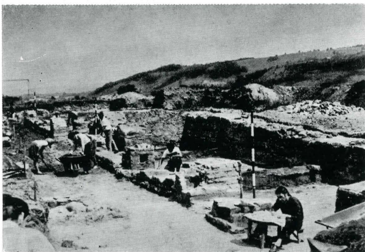
1. Castrul roman Hinova . Aspect din timpul săpăturilor, 1976.