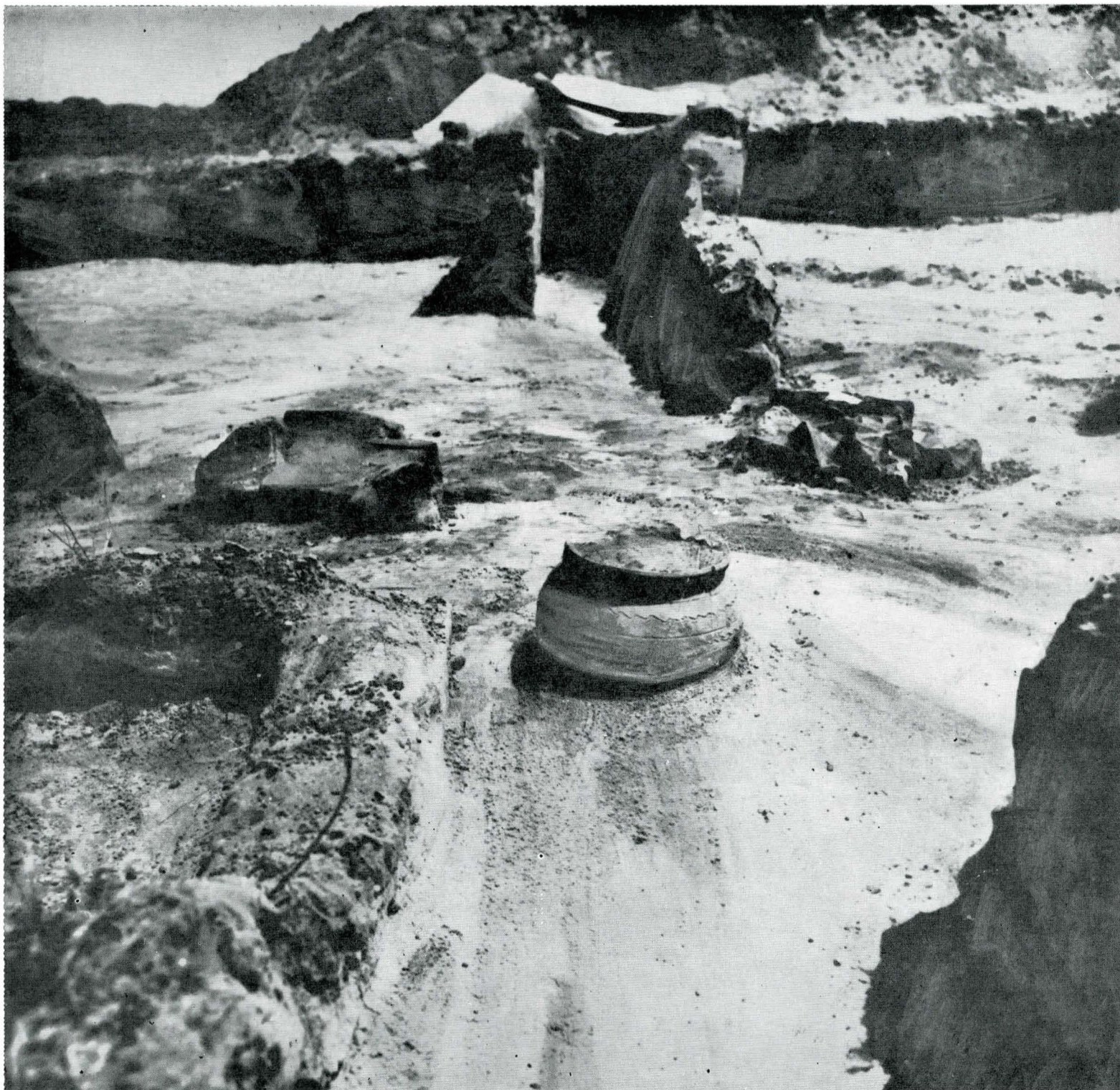
6. Ostrovu Mare , Mormintul nr. 2, cu urna cu ofrandă (1976).

Deși aflate la începutul explorării acestor bogate zone în vestigii străvechi, săpăturile arheologice anunță de pe acum rezultate deosebite în ceea ce privește întregirea cunoașterii științifice a vieții strămoșilor noștri, a procesului de formare a poporului român și menținerea unor obiceiuri mai vechi în ethnosul românesc, preluate din tradiția geto-dacă, unele din elemente perpetuate până în zilele noastre.