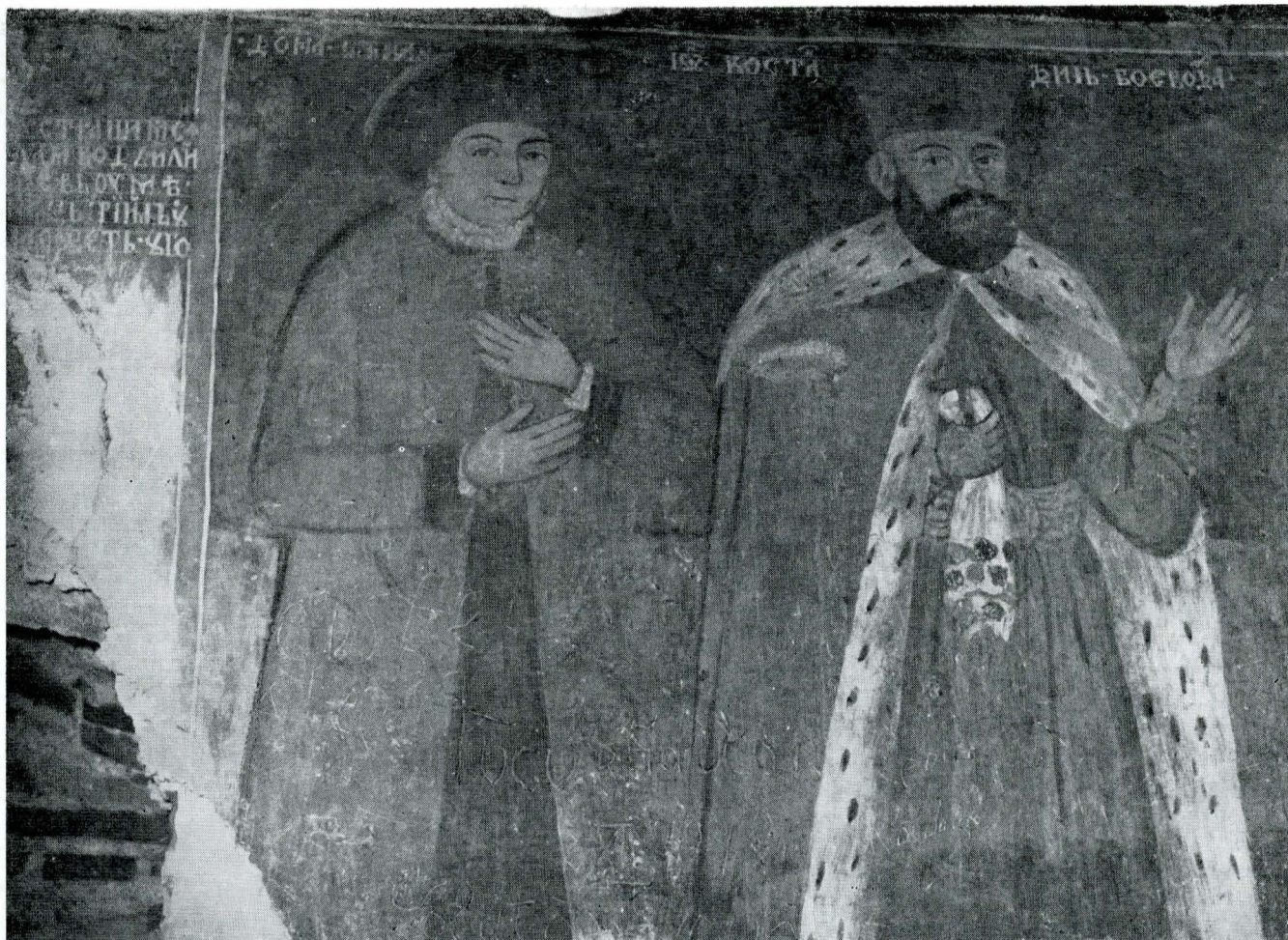
4. Constantin Brâncoveanu și soția sa.

părarea cărora participase și el încă din 1672 25 . Celelalte moșii s-au împărțit deci între alți urmași ai lui Stoian, necunoscuți nouă, existenți, desigur, în „cărțile și zapisele” după care cei 12 boieri hotărâneau moșiile lui Mănăilă, în 1704.