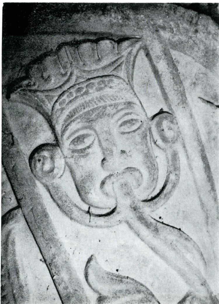
7. Mască. Detaliu, coloana de nord.

la peste 5 000 de stinjeni liniari 61 . Între aceste moșii nu se includ însă alte suprafețe achiziționate în repetate rânduri încă din 1672 : Modruzești și Sinești (acte între 1684—1687 și 1711—1718), Berindești (1693—1706), Blestematele (1696—1710), Mărăcineni (1692—1718), Negoșina (1708—1779), Măgura (1717—1720), Goniții (1695—1720) și altele 62 . Li se adaugă cumpărări de mai mică importanță : mori, vaduri, vii sau cele care ne oferă prețioase informații asupra locuințelor Căpitanului. El cumpăra astfel un loc de casă în târgul Focșanilor 63 ; așa cum se obișnuia, alte case îi aparțineau în București sau pe domeniul amintit, de la Mărăcineni, singura păstrată pînă astăzi — desigur mult modificată — fiind casa care îi poartă numele, la Buzău 64 .