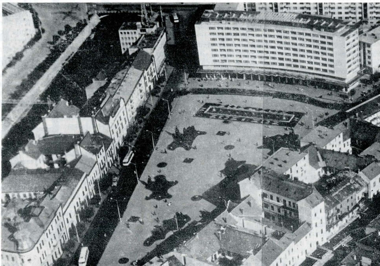
Fig. 5 — Piața Mihai Viteazu — vedere spre est

tive pentru funcțiunile ce le adăpostesc: școli, sedii administrative, ale unor societăți bancare sau comerciale, funcțiuni care au căpătat în acea epocă o pondere deosebită în oraș. S-a ajuns astfel, în linii mari, la ansamblul de azi al zonei centrale, al cărui peisaj creat de jocul acoperișurilor are un farmec deosebit, amprentă a unei personalități proprii, bine încheiate și definite.