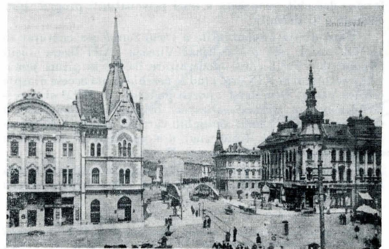
Fig. 1 — Vedere de ansamblu, după o ilustrată din 1903

Palatul Széky este situat în orașul Cluj-Napoca, pe principala arteră (str. Gh. Doja—Horea) ce face legătura centru—gară în colțul sud-vestic al podului peste riul Someșul Mic. Palatul este amplasat în imediata vecinătate a vechii incinte a orașului, ale cărei ziduri erau demolate la data edificării clădirii în anul 1893, conform datei înserise și în mozaicul holului de acces (fig. 1).