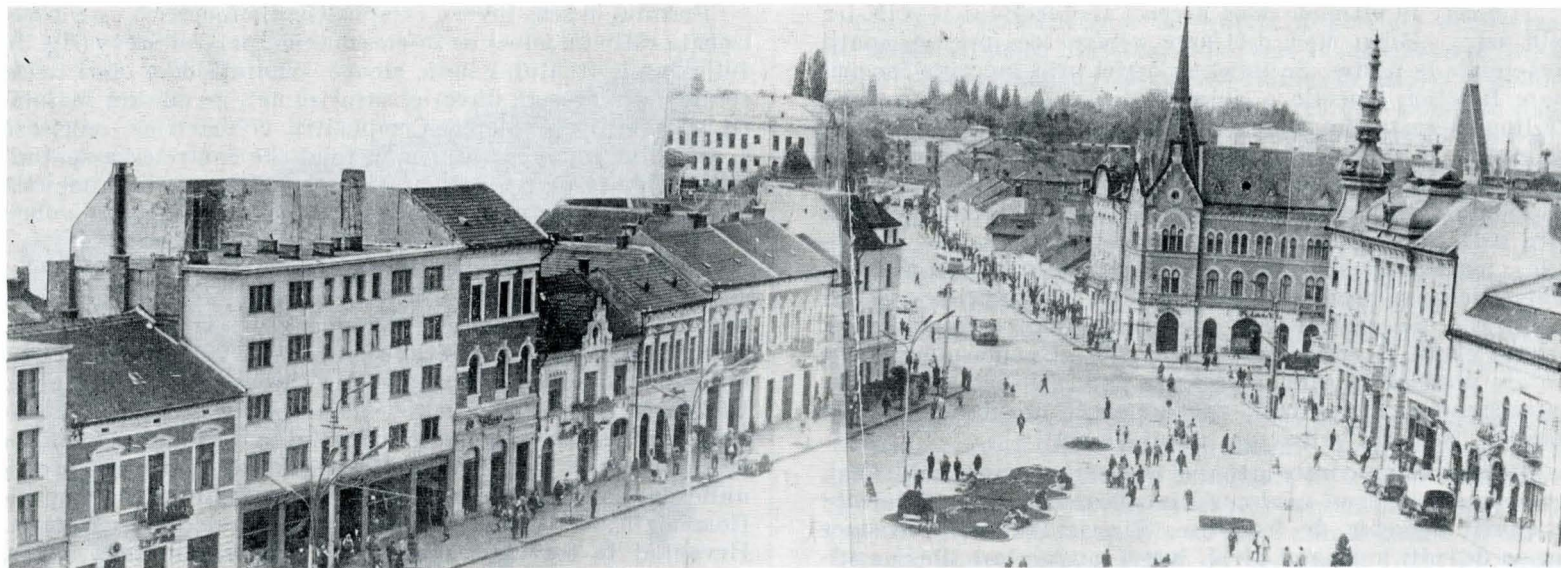
Fig. 4 — Piața Mihai Viteazu — vedere spre vest