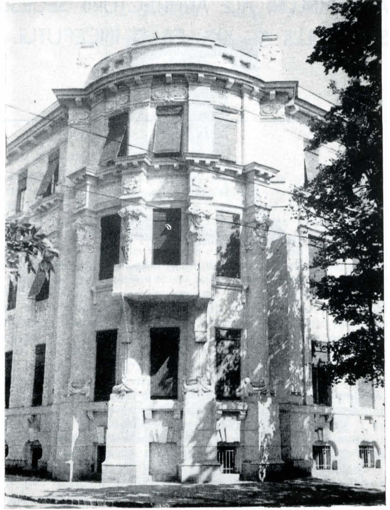
2. Imobil în stil Secession din str. 12 Aprilie 3

Decebal cu accente secession în decorația stîlpilor masivi, străjuind cele două laturi.