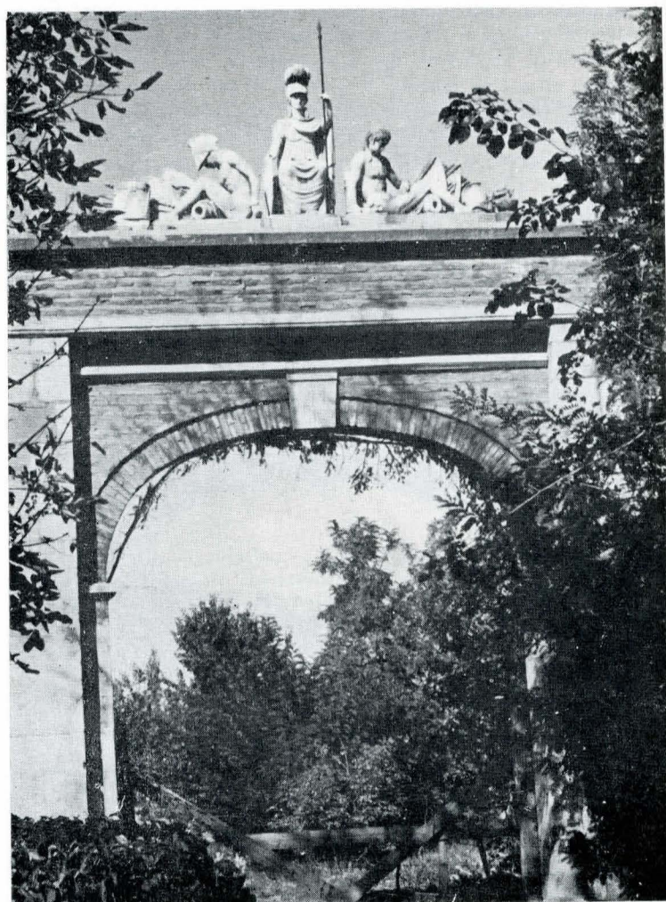
Fig. 5. Portal la Muzeul Mogoșoaia.