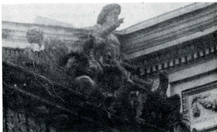
Fig. 4. Grup statuar — Apollo.

Starea proastă a fotografiei, înfățișînd portalul cu Apollo, nu ne permite să identificăm toate elementele care alcătuiesc grupul statuar, mai ales că imaginea n-a fost luată frontal, ci dintr-un unghi care deformează mult personajele, animalele și obiectele reprezentate. Distingem doar personajul principal,