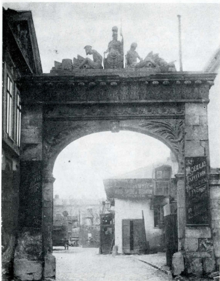
Fig. 1. Portal.