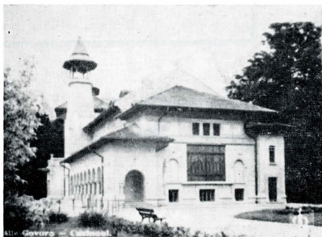
Teatrul-cinema din Govora

Concomitent cu activitatea din serviciul public, cu energia care-o caracteriza, realizează, singură sau în colaborare, o serie de clădiri monumentale cu diverse programe. Vom