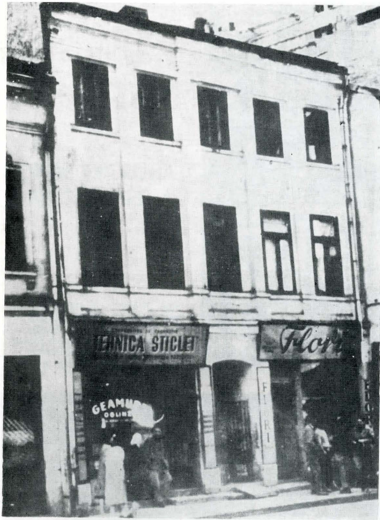
Clădirea din Piața Amzei nr. 26 cu sala „Sotir“ unde-și avea sediul organizația socialistă din București și în care s-a desfășurat Congresul de constituire a P.S.D.M.R. în 1893

str. Primăverii nr. 17, și „Lucrătorul“ (1892—1893), apărut sub direcția Clubului muncitorilor din Galați, cu sediul în casele Prasin din Strada Mare.