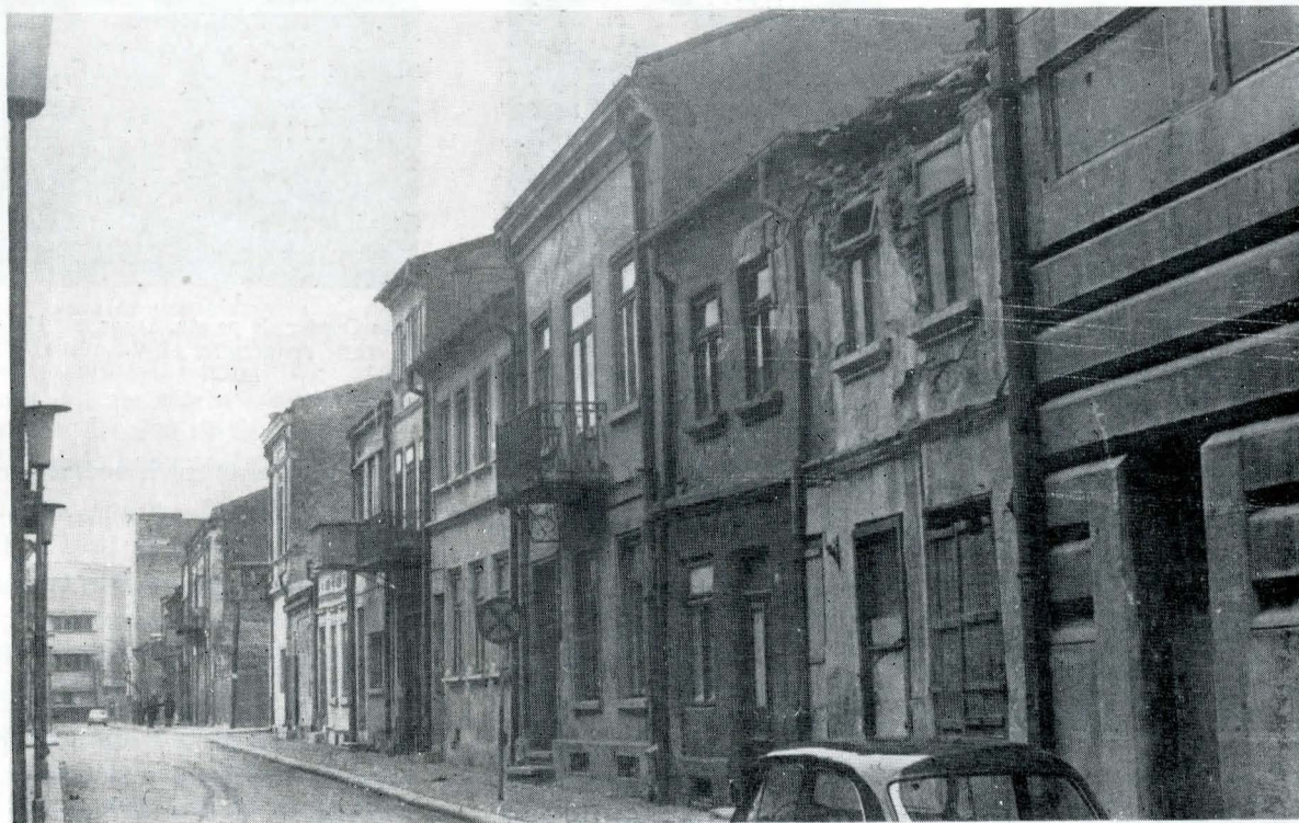
Strada Brașoveni din Brăila, pe care se afla o tipografie unde s-au tipărit numeroase publicații muncitorești

În zilele de 31 martie — 3 aprilie 1893 s-au desfășurat, la București, în Sala „Sotir“, lucrările Congresului de constituire a partidului politic al clasei muncitoare din România, moment cu adânci semnificații și rezonanțe în perspectiva istoriei. În sală erau prezenți 63 de delegați din partea organizațiilor politice și profesionale din București, Iași, Ploiești, Galați, Craiova, Bacău, Roman, Tecuci, Tîrgu-Frumos și a Grupului studenților socialiști români de la Paris. Congresul a dezbătut și aprobat programul și statutul partidului și a