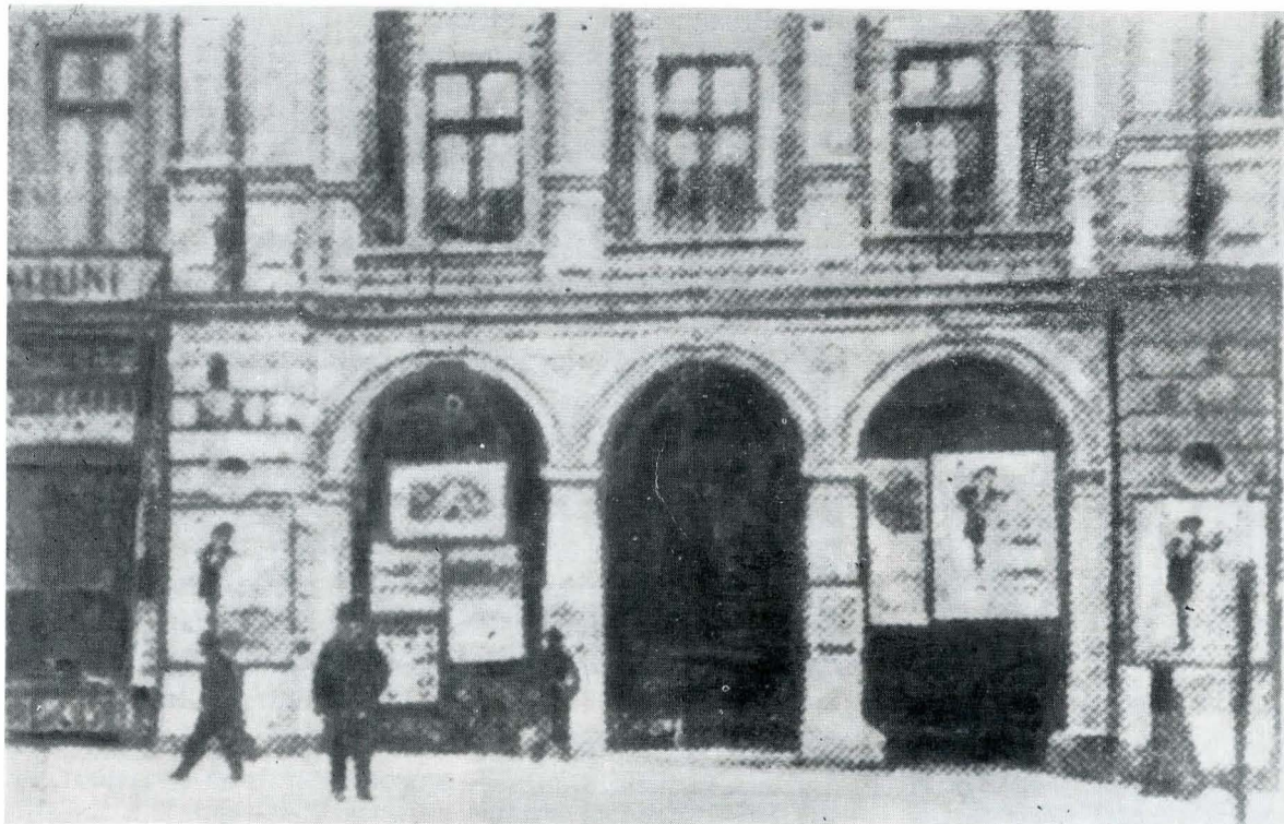
Sala „Eforia“, situată pe actualul bulevard Gheorghe Gheorghiu-Dej nr. 7, în care s-au desfășurat mari întruniri, mitinguri și adunări organizate de mișcarea socialistă din București în perioada 1894—1916