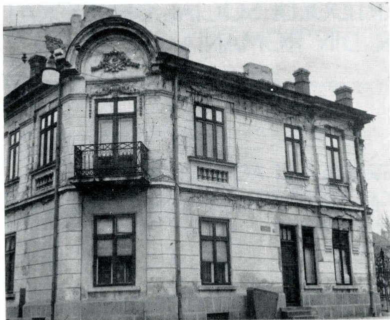
Clădirea de pe Calea Rahovei nr. 32 din București unde se află sala „Franzelari” în care a funcționat sediul Cercului de studii sociale „Drepturile omului” (1884)