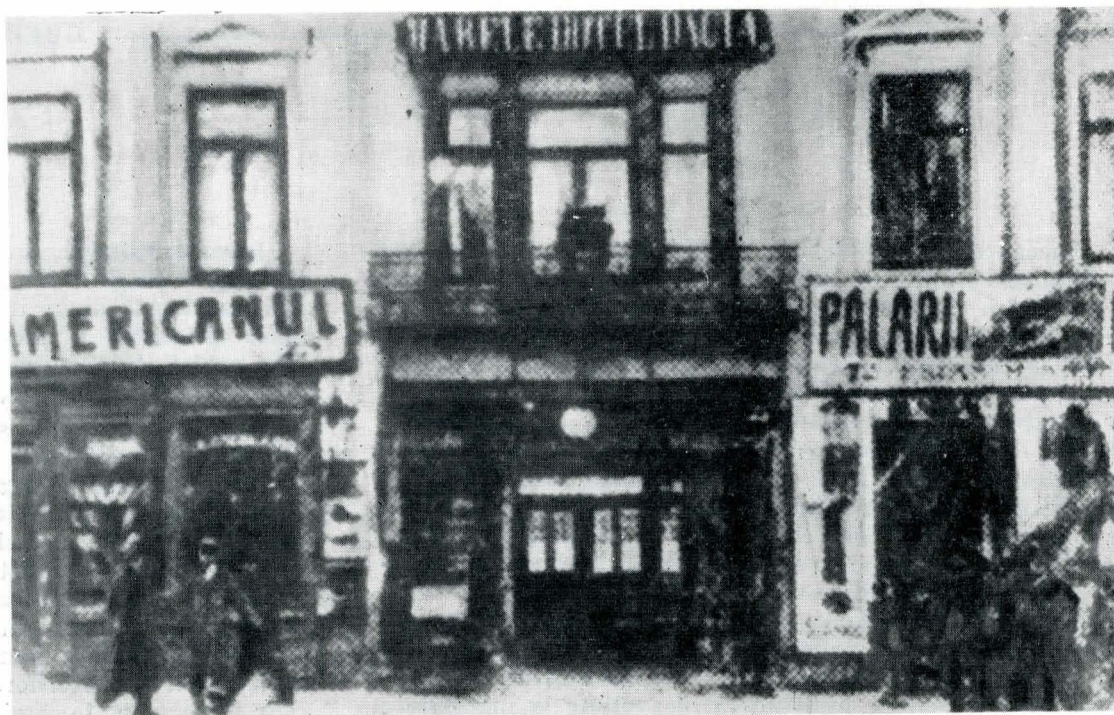
Hotelul „Dacia” din București, loc de desfășurare a numeroase întruniri, mitinguri și adunări socialiste și muncitorești la sfârșitul secolului al XIX-lea

În cadrul dezbaterilor purtate la Cercul de studii sociale „Drepturile omului” (1884–1885), al cărui sediu a funcționat în sala „Franzelari” din Calea Rahovei, colț cu Str. Sf. Apostoli, hotelul „Dacia”, precum și în publicații politice și ideologice cum au fost: „Contemporanul” (1881–1891) editat de Cercul socialist din Iași, al cărui sediu era pe str. Sărării nr. 37, în casa soților Sofia și Ioan Nădejde, „Emanciparea”, „Dacia viitoare” (1883), „Revista socială” (1884–1887), „Drepturile omului” (1885) — primul cotidian socialist român, cu redacția în Sala „Sotir” din Piața Amzei nr. 26, a izvorit programul marxist unitar de acțiune care avea să coordoneze și să îndrume activitatea întregii mișcări muncitorești din țara noastră. El a fost scris de C. Dobrogeanu-Gherea și publicat, în 1886, sub formă de lucrare intitulată „Ce vor socialiștii români”. Prin întregul său conținut acest document programatic stabilește atitudinea mișcării noastre muncitorești și socialiste cu privire la realitățile politice ale perioadei, obiectivele politice și social-economice înscrise pe stindardul de luptă al proletariatului organizat.