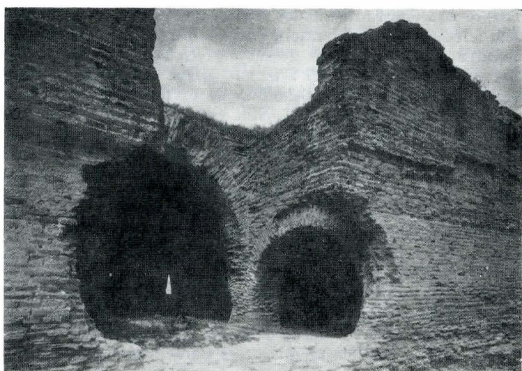
Vestigiile palatului datorat lui Matei Basarab de la Fundeni. Fotografie executată în 1937