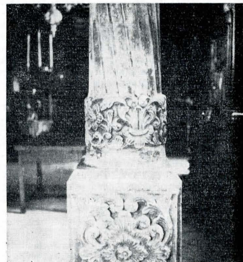
București. Biserica Fășor (1745) coloană din interior.

În ceea ce privește pictura, o lectură a frescelor monumentelor din secolul al XVIII-lea, a picturii în tempera pe lemn și a celei de icoane a prilejuit specialiștilor completarea unei mai bune cunoașteri a meșteșugului artistic în perioada pusă în discuție, cu evidențierea mutațiilor stilistice, a existenței unor puternice centre de pictură ca și a unui bogat reper-toriu de teme cu scene de o mare varietate; expresia acestora cu încărcătura nuanțelor de aspecte sociale, merge de la o reluare a formelor brincovenesti (A. Vasiliu), la împletirea elementelor tradiției (ca o prelungire a artei bizantine), tradiție ilustrată de pictura maramureșeană, de exemplu, ale cărei tendințe ne