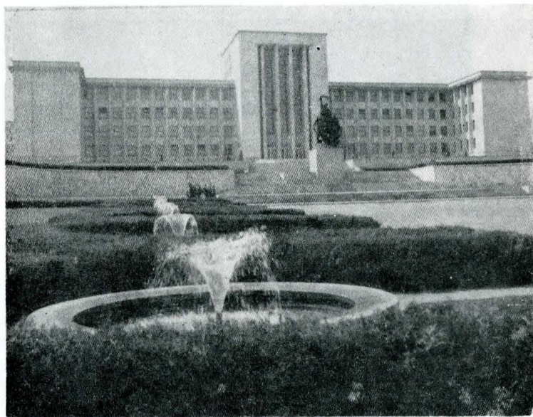
Monumentul eroilor patriei din București (colectiv condus de sculptorul Marius Butunoiu)

Martori oculari ai zilelor fierbinți de august, ai luptelor purtate pe teritoriul României, Ungariei și Cehoslovaciei și