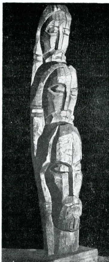
Tripticul eroilor, Ion Vlasiu

Alt monument închinat Ostașului Român a fost realizat la Baia Mare, între 1958—1960, de sculptorul Andrei Ostap. Spiritul sculpturii tradiționale este evident în acest monument evocînd patria mamă și figura ostașului român apărător al