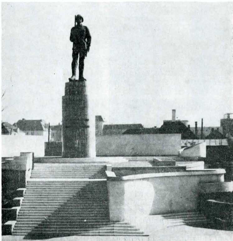
Monumentul Ostașului Român — Tg. Mureș, Petre Balog