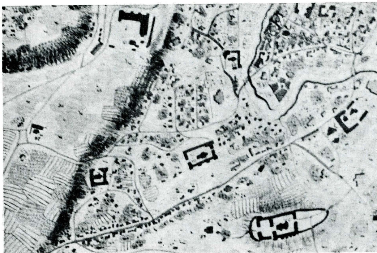
Fig. 6. Planul Purcel — Mahalalele Sf. Ioan cel Mare, Bălăceanu, Șerban Vodă, Arhimandritul, Antim, Goleșcu, Prund.

din zid un nou lăcaș pe locul celui de lemn 53 . Pare astfel puțin probabil ca același personaj, „Ianache Văcărescul vel agă neavind loc ca să-și facă casă aici în București și pohtindu a cumpăra” 54 să se străduiască să achiziționeze mărunte proprietăți în partea de nord a orașului și tot el să-și fi construit o casă cu 30 de încăperi 55 într-o mahala excentrică, în apropiere de perifericele Gorgan și Mihai Vodă.