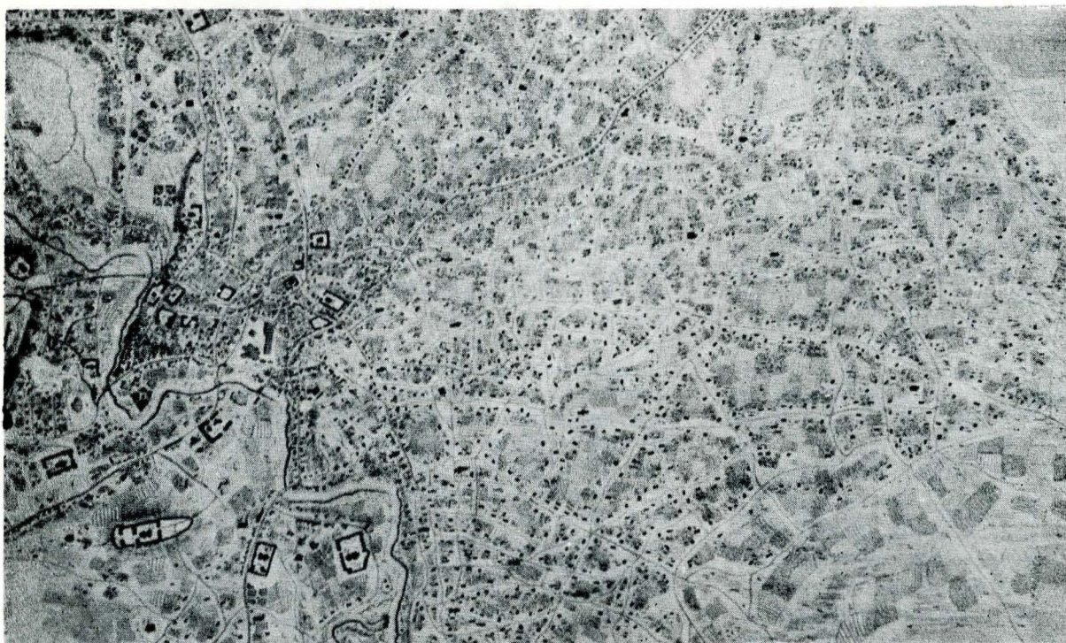
Fig. 7. Planul Purcel — Mahalalele mărginașe din zona de est a orașului.

19/7 cu lăviți/cu paticine/cu macaturi, cu uși la toate casile (camerele, T.S.) căptușite; cu ferestri de sticlă la toate casile, cu încuietori la toate ușile. Asemenea beciurile iarăși cu paturi, cu lăviți, cu uși (probabil, încăperile de la nivelul beciurilor și nu chiar acestea din urmă, T.S.); așijderea o căscioară ce este den dosul grădinii, cu locșoru ei și cu puțu în curte 65 . Aceste case — înconjurată de largi grădini, pe care nici un vizitator nu uită să le amintească și pe care baronul Purcel le desenează (fig. 3) și le colorează cu plăcere — dominau cu silueta lor cu două nivele mediul înconjurător, format fie din mai mici case de cărămidă, fie din foarte numeroasele locuințe din lemn — nu neapărat sărace, de vreme ce actele de vânzare nu specifică nici măcar în cazul tuturor edificiilor boierești că ar fi fost „din piatră” 66 — De prezența lor sînt pline documentele care menționează frecvent „lemnele” casei 67 , iar în zonele preponderent meșteșugărești și comerciale „lemnele” prăvăliilor, adesea numai ele proprietatea negustorului sau a meșteșugarului, alcătuind o bina care putea fi mutată, în cazul în care stăpînul respectivului loc (domnia, un boier, o mănăstire, un alt particular mai mărunț) nu mai voia să îl închirieze sau găsea un platnic mai bun 68 .