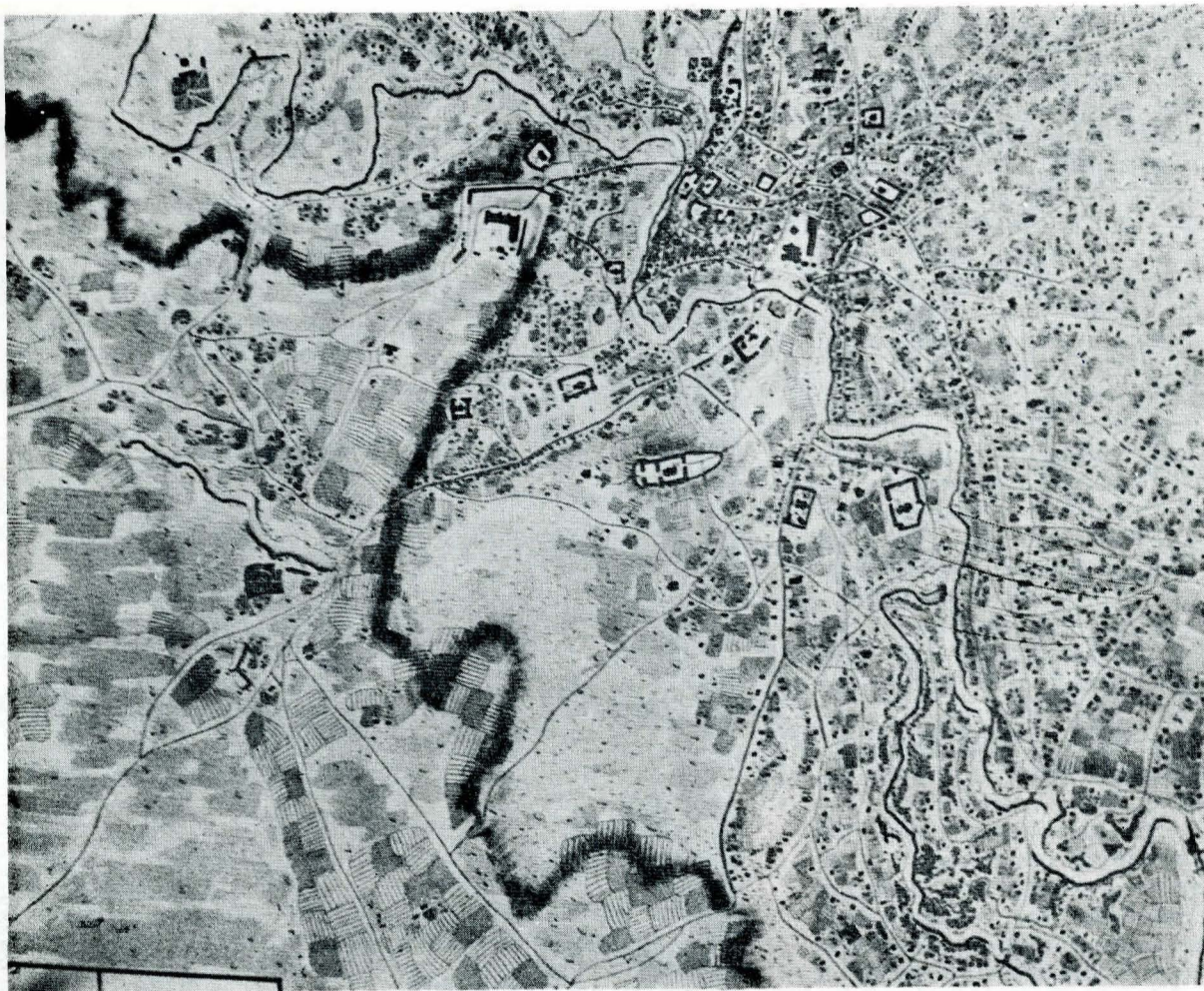
Fig. 3. Planul Purcel — Zona centrală și cea de sud a Bucureștilor.

200 de moaște și clopotul cel mare din Petersburg sînt demne de văzut 21 . Clopotnița ctitoriei lui Mihail Cantacuzino spătarul este amintită indirect și de misionarul franciscan Blasius Kleiner, în 1761. Prezența acesteia îi folosește pentru a evalua întinderea orașului, care „este așa de mare, încît dacă un om s-ar urca în turnul din mijlocul său (Turnul Colței), cu greu ar putea să vadă de la un capăt la altul 22 . Acest personaj, căruia îi datorăm prima listă completă a bisericilor bucureștene 23 , remarcă și el ulițele podite, „locuințele, care, dacă lași la o parte Curtea domnească, casele boierești sau una-două case de negustori, sînt destul de neînsemnate, căci casele sînt mici, îngrămădite, făcute simplu pe dinăuntru și împodobite pe dinafară“. El găsește trei lucruri demne de văzut în oraș: 1. diversitatea de neamuri și de limbi vorbite; 2. bogăția, care face ca, „pe cît acest oraș este întrecut în frumusețe de altele, pe atît le întrece el în bogăție“; 3. numărul foarte mare de biserici — dintre care cea mai frumoasă i se pare a fi Sf. Gheorghe —, „mulțimea uimitoare a clerului“, cele „20.000 de du-ghe“ 24 (cifră, desigur, exagerată).