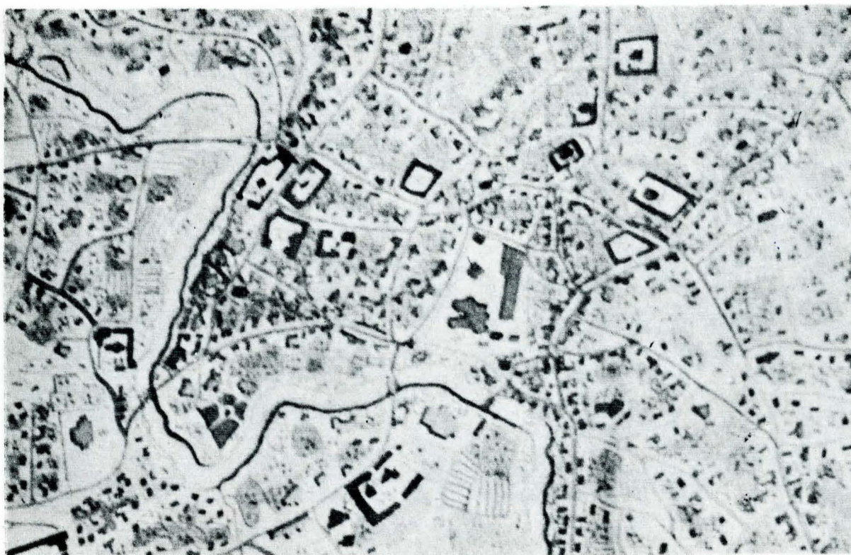
Fig. 5. Planul Purcel - Zona din jurul Curții Domnești, Podul Mogoșoaiei, Podul Tîrgului din Afară - cu zona comercială, mahalalele Prundul și Arhimandritul.

răspîndirea și, mai cu seamă, identificarea lor, constituie o problemă pasionantă. Urmărirea pe cît posibilă a actelor privitoare la una și aceeași proprietate oferă uneori posibilitatea de a stabili, în mare, și evoluția ansamblului arhitectonic. Este foarte puțin probabil să se fi dărîmat „case de piatră” sau chiar „pivnițe de piatră” 39 , (adesea deosebite de „pivnița” independentă, uneori de lemn, aflată în curte 40 ), în scopul ridicării de edificii în întregime noi. Era mai logic, pentru epocă, — și săpăturile arheologice din cîteva puncte ale Capitalei, unde au fost dezvelite în suprafață vestigiile unor mari ansambluri boierești (Casa Cantacuzino-Dudescu din fosta mahala a Arhimandritului 41 , casa din str. actuală Mihai Vodă 42 ) sau acolo unde s-au putut face observații fugare pe șantierele de construcții (ca în zona de la nord de biserica Domnița Bălașa 43 ) o confirmă, — ca, de regulă, atunci cînd se pune problema amplificării unei case, să se procedeze prin adîncirea de spații noi. Aspectul beciurilor — căci, în genere, doar acestea s-au conservat fragmentar — apare ca un conglomerat de încăperi, care păstrează anumite trăsături stilistice (compartimentare interioară, tipuri de boltire, goluri), permițînd, cel puțin cu aproximație, încadrarea cronologică a fazelor construcției 44 .