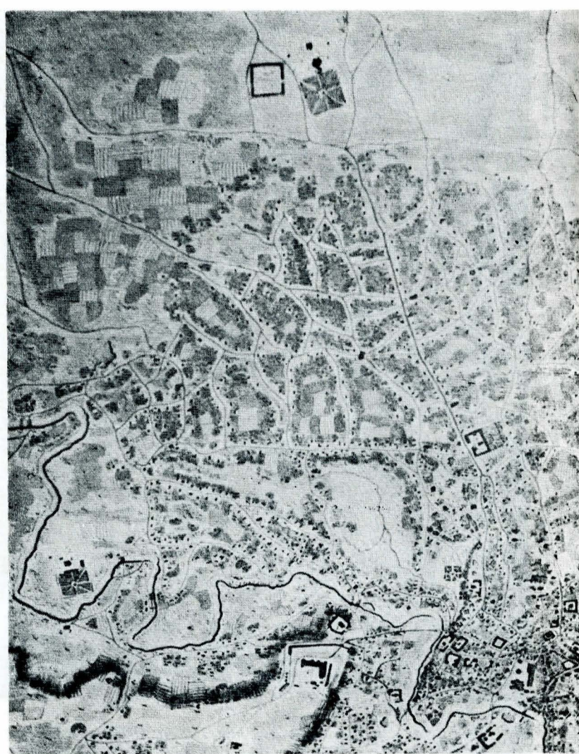
Fig. 4 — Planul Purcel — Zona centrală și cea de nord a Bucureștilor.

Două tipuri de surse mi-au facilitat această încercare: deja amintitele sute de documente, pe de o parte, iar pe de alta, atenta examinare a planurilor Bucureștilor (fig. 1, 2), ridicate — ce e drept — de abia în a doua jumătate a veacului al XVIII-lea, deci dincolo de limita superioară de timp a intervalului pe care mi