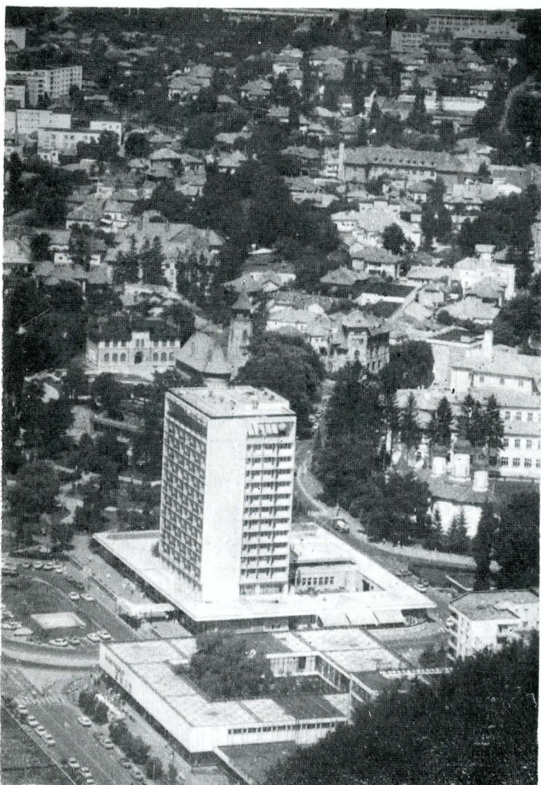
Aspect panoramic al dispoziției orașului Piatra Neamț pe treptele reliefului

În cazul zonei centrale din Tîrgu Mureș, noul ansamblu modern al Teatrului Național (preluînd elemente ale stilului Secession) se încadrează compozițional fericit esplanadei Trandafirilor.