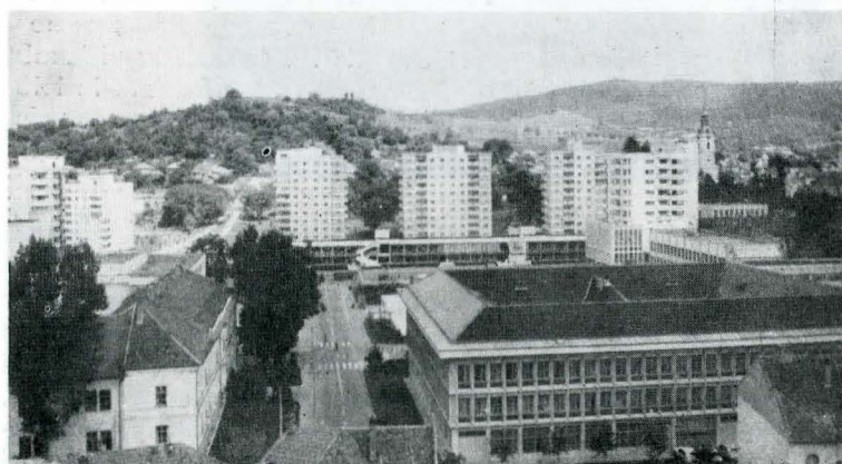
Noua siluetă a orașului Zalău, integrând elemente ale fondului moștenit

oglundindu-și siluetele arhitecturale în apele Dâmboviței, mari lucrări executându-se, în continuare, pe acest riu, în aval de oraș și pe Argeș, pentru realizarea canalului navigabil pînă în anul 1990, cînd Bucureștii vor deveni port la Dunăre și Marea Neagră; metroul, a cărui rețea va atinge 60 km, ca și numeroasele pasaje și poduri rutiere permit desfășurarea unei circulații lesnicioase; noul centru politico-administrativ, ale cărui lucrări continuă, va înfrumuseța aspectul edilitar-urbanistic al Capitalei. Așa cum sublinia, de altfel, secretarul