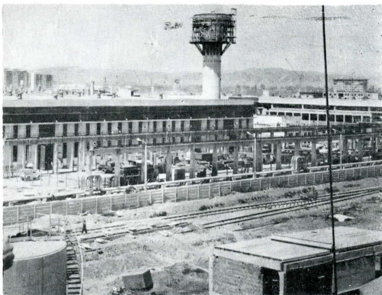
Întreprinderea de strunguri „Saro“ din Tîrgoviște