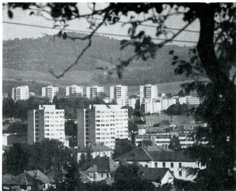
Armonii arhitecturale în cadrul natural al orașului Odorheiu Secuiesc