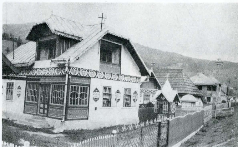
Arhitectură populară contemporană în satul Ciocănești, județul Suceava.

Amenajarea complexă a teritoriului și realizarea construcțiilor prevăzute necesită participarea activă, nemișlocită, a specialiștilor din diferite domenii (arhitecți, ingineri, economiști, sociologi, demografi, geografi, istorici, matematicieni etc.), arhitecții și alte cadre de specialiști cu pregătire temeinică fiind cei care să elaboreze, în final, proiectele, pe baza sintetizării tuturor informațiilor reieșite din studiile interdisciplinare: sociologice, etnografice și de arhitectură tradițională, din teren, într-un material cuprinzător pentru elaborarea proiectelor privind, de exemplu, tipologia locuinței rurale și a celei din localitățile urbane mici pînă la 10 000—15 000 locuitori. În acest sens, documentațiile, puse la dispoziția factorilor de decizie, vor evalua elementele planime-