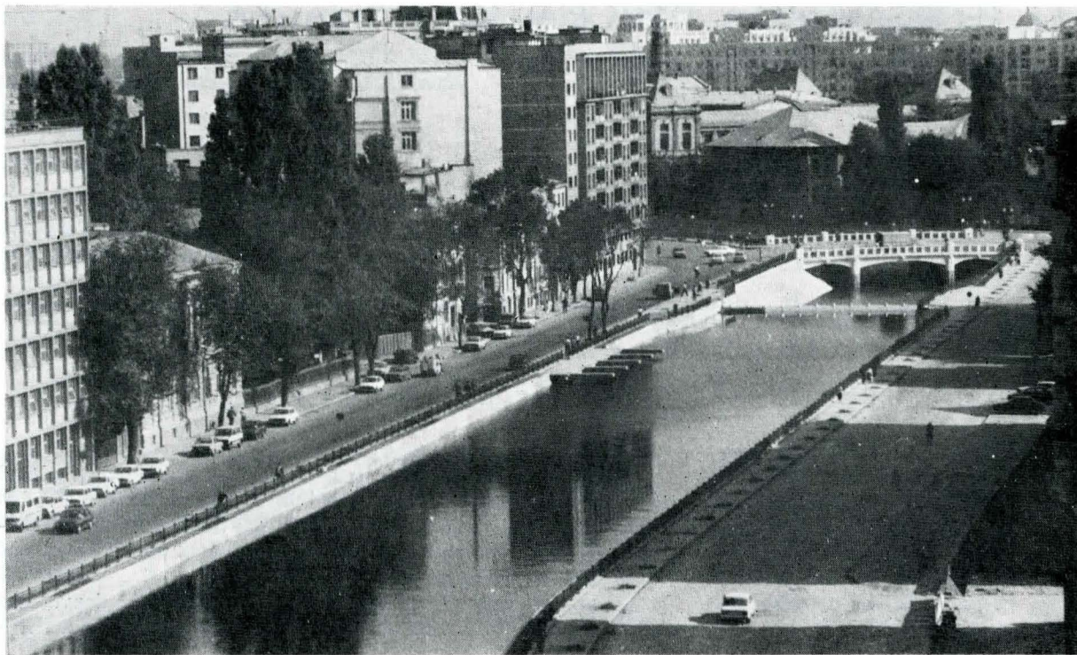
Noul aspect al Dâmboviței Bucureștene