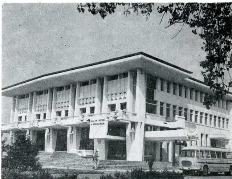
Casa de cultură a sindicatelor din Baia Mare

Soluții opuse celor din centrele orașelor Craiova, Vaslui, Botoșani sînt cele adoptate la Sibiu, unde noul centru civic continuă pe cel vechi (articulate fiind de străzi comerciale), la Bistrița și Baia Mare. La Satu Mare, ca urmare a creșterii populației orașenești — expresie a politicii de industrializare a țării — teritoriul urban s-a extins pe malul opus al Someșului, creîndu-se centrul nou care continuă, de fapt, vechea Piață a Libertății cu ansamblul de dotări revitalizate, adăugînd zestrei istorice noul patrimoniu arhitectural.