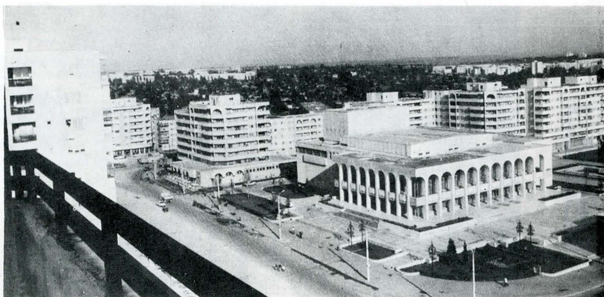
Siluețe ale arhitecturii con- temporane la Constanța