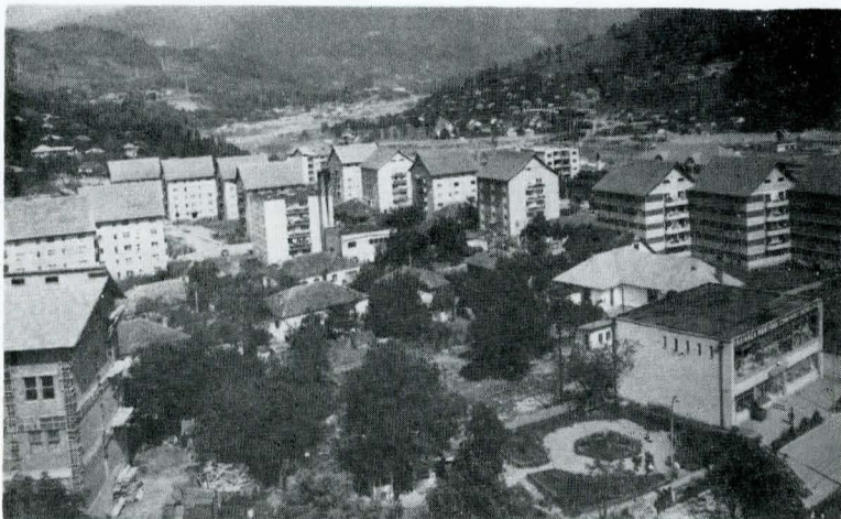
Efecte ale arhitecturii noi din comuna Nehoiu, județul Buzău

Baia Mare și Constanța, care, mergînd într-un fel pe linia continuității tradiției, se exprimă în zone de înnoiri, care au căpătat ele însele caracter specific, de continuare a orașului istoric de secol XIX.