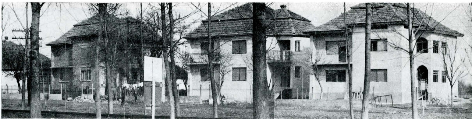
Din arhitectura nouă a comunei Vama, de lângă Negrești-Oaș