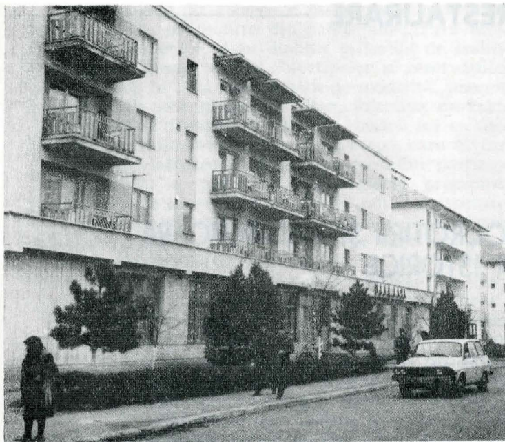
Arhitectură contemporană în comuna Trușești (județul Botoșani)