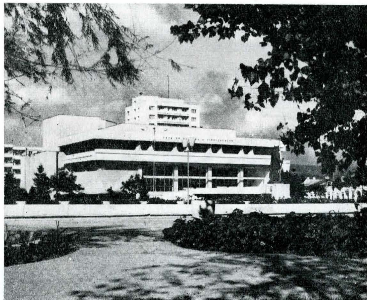
Centrul de creație și cultură socialistă „Cîntarea României” al sindicatelor din orașul Vaslui

În ultimii ani s-au înregistrat o serie de schimbări în înfățișarea localităților, ca urmare a amplelor acțiuni — la scară generală — de modernizare și reconstrucție a orașelor, de sistematizare urbană, în special a unor piețe și centre istorice, a dezvoltării puternice a con-