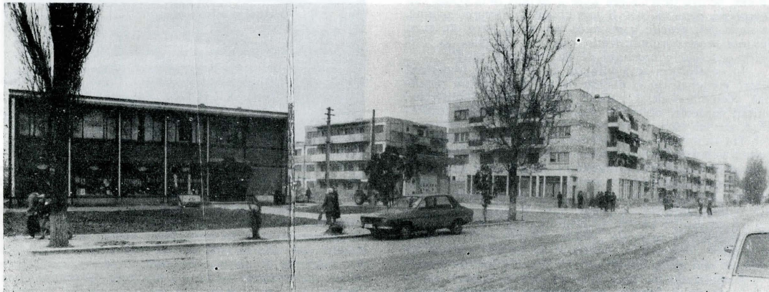
Noua arhitectură a comunei Ianca, județul Brăila

În Expunerea ținută în cadrul Plenarei comune a C.C. al P.C.R., a organismelor democratice și organizațiilor de masă și obștești din noiembrie 1988, documente de o însemnătate deosebită pentru dezvoltarea viitoare a țării, constituindu-se într-o analiză amplă și exigentă a stadiului actual al construcției socialiste și perspectivei dezvoltării societății socialiste românești, a etapelor dezvoltării istorice a poporului român, această problemă este din nou analizată în special privind ansamblul localităților rurale. Imaginea social-economică și tehnic-edilitară a viitoarelor orașe agroindustriale, al căror sistem va cuprinde cca 550 noi astfel de așezări, centre actuale ale consiliilor unice agro-