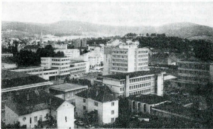
Noi armonii arhitecturale în orașul Zalău (județul Sălaj)