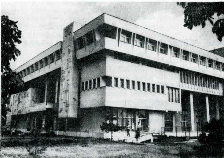
Centrul de creație științifică și tehnică al tineretului din municipiul Timișoara

Accelerarea modernizării așezărilor, avînd în vedere cele arătate pe linia valorificării superioare a marilor resurse locale, a folosirii raționale a pămîntului și fondului moștenit, dezvoltarea și diversificarea, în continuare, a micii industrii la sate, dezvoltarea agriculturii, repartizarea armonioasă și echilibrată a obiectivelor industriale în teritoriul comunelor mari, ca o condiție esențială a dezvoltării viitoarelor centre urbane agroindustriale, sînt cîteva din orientările, de mare însemnătate și actualitate, înscrise în documentele de partid.