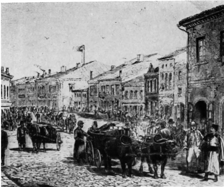
Fig. 3—4. Galații în anii 1877—1878.