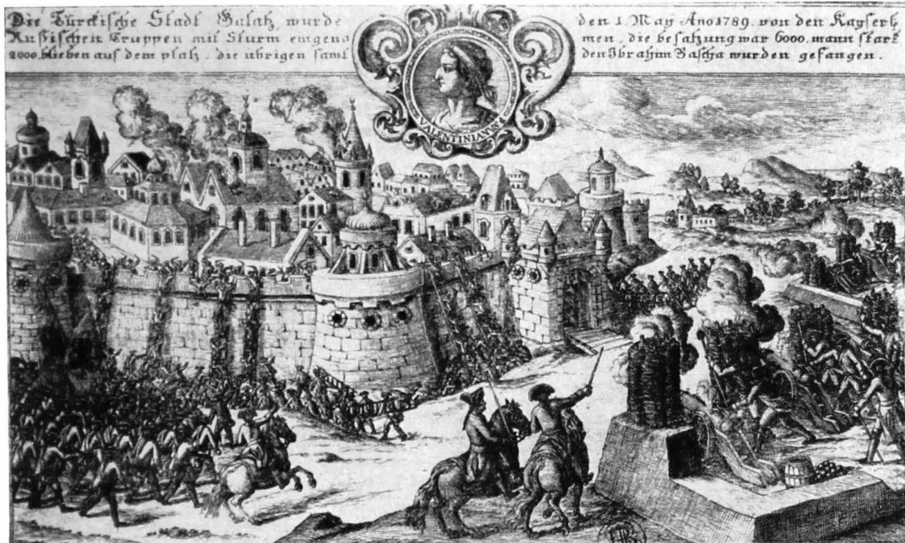
Fig. 1. Galații în anul 1789, reprezentare imaginară.