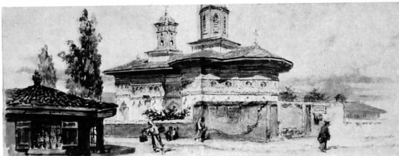
Amedeo Preziosi — Râscruce la biserica Batiște (București 1869).

Pictorul Preziosi s-a născut în localitatea La Valetta, capitală a insulei Malta, ca fiu al conțelui Giovanni Francesco Preziosi, de origine italiană și al Margaretei Preziosi, de origine franceză, născută Renó—in grafie franceză Reynaud —, la 2 decembrie 1816, după cum rezultă din actul