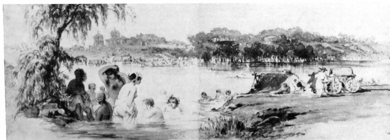
Amedeo Preziosi – Peisaj pe Dimbovița (1869).

artistică, de care ne-am ocupat în parte, luând schițe după care a executat, la Constantinopol, opere pe care a pus data schiței, lucru de care trebuie neapărat să se țină seama la un eventual catalog al lucrărilor sale. Albumul de schițe din 1868, dacă a existat vreodată, nu se cunoaște. Cel din 1869 se găsește în Muzeul de istorie a orașului București și constituie unul din obiectele de mare valoare din bogata colecție a acestui muzeu.