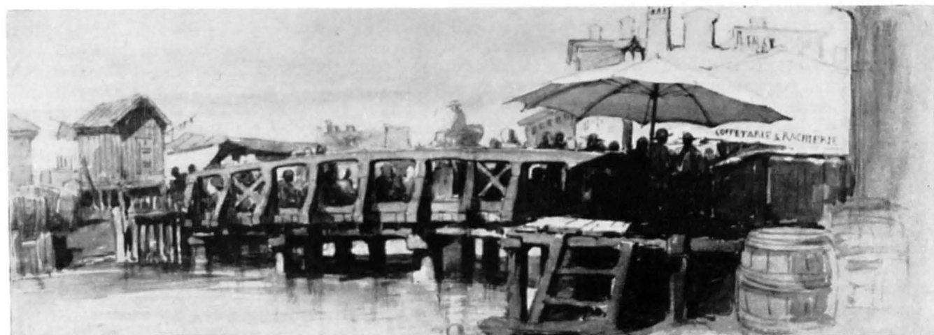
Amadeo Preziosi — Vederea unui pod peste Dimbovița (București 1869).

eliberat de biserica „S. Mariae Portus Salutis Urbis Valletae Maletensis Diocessos“, din 1957, în posesia autorului acestui studiu.