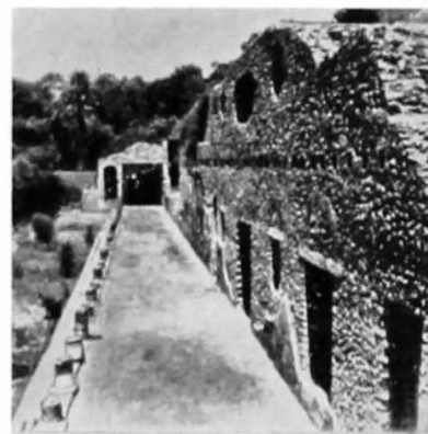
Fig. 1. Pompei Villa di Porta Marina: porticul.

a complexului de clădiri din imediata vecinătate a mării arene, construită prin anii 80 î.e.n. și obiectivul principal al săpăturilor din veacul al XVIII-lea. La vestul „Pieții Amfiteatrului” s-a degajat intrarea în incinta grandioasă a Palestrei, unde se țineau jocurile anuale ale „Colegiului tinerilor” (Collegium Iuvenum). Această clădire sportivă se compune dintr-o mare arenă pătrată, lungă de cca 130—140 m, închisă de un perete înalt, cu intrări spațioase în părțile estice și vestice. În interior se află un lung portic ornamental cu trei laturi, iar în centrul terenului un mare bazin de înot (natatio), înconjurat de platani seculari, care ofereau tinerilor atleți și luptători răcoarea în timpul repausului. Rădăcinile unui astfel de arbore uriaș se mai pot vedea și astăzi. În unghiul de sud-est al Palestrei