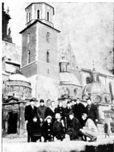
Un grup de vizitatori români în fața castelului Wawel.

Catedrala se află în imediata vecinătate a castelului. Capela ei mai păstrează și astăzi mormintele ultimilor doi Jagelloni. Această capelă este una dintre cele mai desăvârșite din punct de vedere arhitectural, mai ales prin splendidul ornament sculptural, operă a florentinului Bartolomeu Berrecci. Castelul și catedrala de pe colinele Wawel reprezintă podoabele fără de preț ale orașului milenar Cracovia și cea mai mare atracție turistică a Poloniei — spun prospectele agenției de turism Orbis. Iar noi, cei care le-am vizitat, spunem cu certitudine că sînt de neuitat.