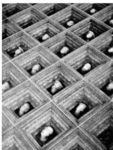
Detaliu dintr-un tavan cu sculpturi satirice.

cupe și tăvi de aur de pe vremea lui Cazimir cel Mare, coroane, coliere și diademe aparținînd familiilor regale precum și cadoul oferit de Papa Inocentius al XI-lea lui Sobieski al III-lea, cadou compus dintr-o pălărie cu fireturi de aur și o sabie de asemenea tot din aur. Mare parte din exponatele trezoreriei vizitate de noi au luat calea pribegiei în timpul celui de-al doilea război mondial. Am aflat cu emoție că toate aceste piese unice, de o valoare extrem de mare, au fost salvate și transportate în septembrie 1939, prin România și din portul Constanța au fost imbarcate spre Canada, care le-a găzduit mai bine de 15 ani. Astăzi ele și-au reluat locul în trezoreria din castelul Wawel și pot fi admirate de zecile de mii de vizitatori care trec prin fața lor în fiecare an.