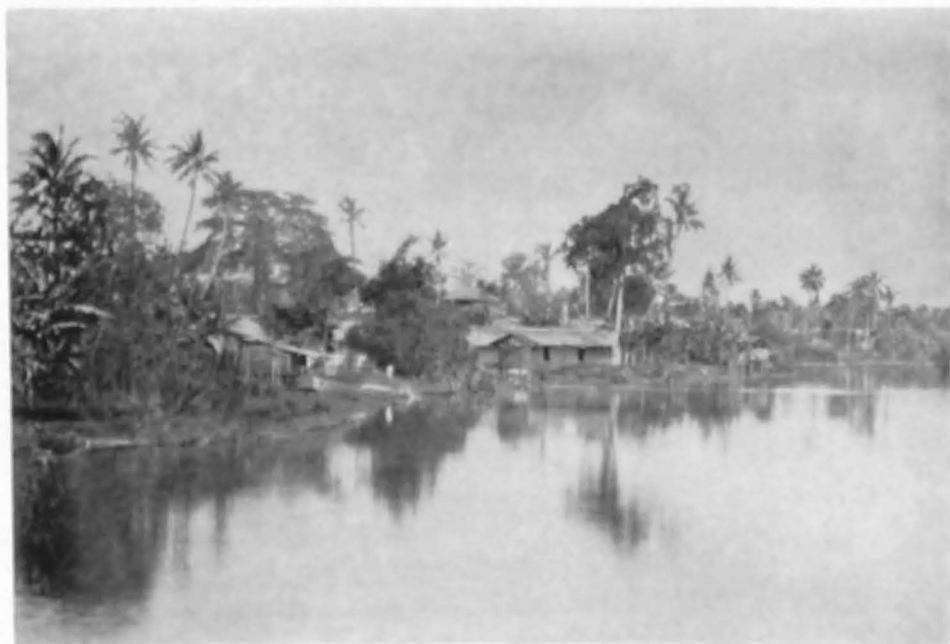
Pe malul râului Atjeh (Sumatra).