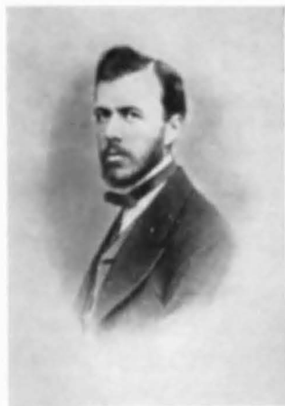
Mitrea student în Cluj.