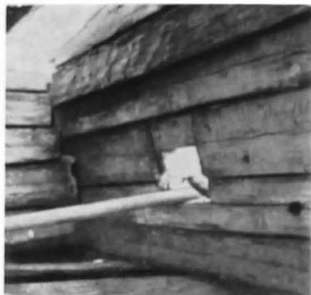
Fig. 2. Interiorul casei din Muonio.