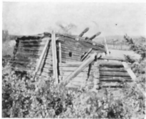
Fig. 1. Veche gospodărie de pescari din 1608, Muonio.

Acum această veche locuință a fost transferată la Keimiönemi pentru muzeu, alături de alte gospodării.