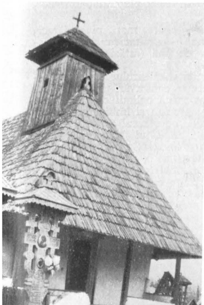
Biserica veche din satul Novaci Români.