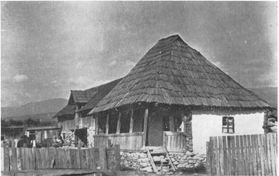
Casă țărănească din satul Hirișești. Începutul secolului al XIX-lea..