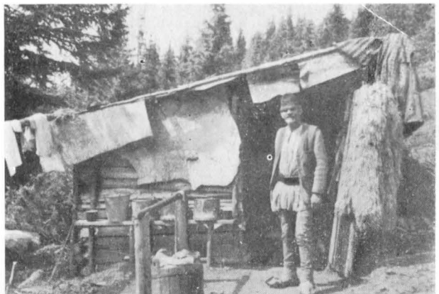
Stînă de novăceni pe muntele Pravățul.