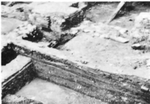
Fig. 6. Profil stratigrafic în tranșee 2 de pe latura de est a cetății.