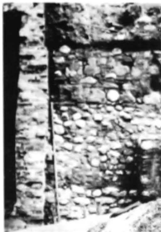
Fig. 5. Zid bolovanit din sec. al XV-lea.

Fără îndoială că se mai poate discuta chiar și în aceste condiții stabilirea castelanului Dragomir valahul la București, după cum argumente pro și contra vin în întîmpinarea evenimentelor din 1396. Existența acestei fortărețe putea asigura adăpostul familiei voievodale și ca atare Ștîbor a luptat aici. Dar admitînd că documentul regal de răsplată din 8 decembrie 1397 reflectă adevărul, subliniind greaua și îndelungata luptă între transilvăneni și Vlad Uzurpatorul, ar putea fi ridicate semne de îndoială asupra capacității de rezistență a unui atare loc întărit. Ceea ce rămîne o realitate este faptul că, în zona de centru a Bucureștilor de azi, a dăinuit în veacul al XIV-lea