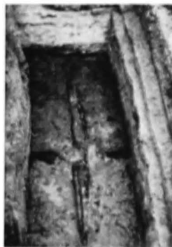
Fig. 3. Birne de lemn descoperite în Țanțul de pe latura de sud a cetățuii.

O notă aparte se degajă din studiul cercetătorului Ștefan Olteanu, care consideră că Bucureștii nu au beneficiat de o cetate în înțelesul propriu al noțiunii, ci de unele întărituri ce înconjurau tirgul medieval 30 .