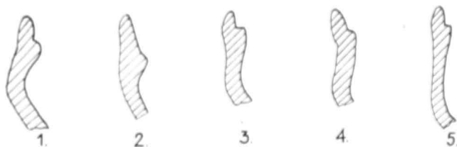
Fig. 2. Profile de vase descoperite în Țanțul cetățuii.

Istoriografia contemporană a continuat dezbaterea acestei probleme atît în cadrul unor studii, cit și în lucrările de sinteză. Dar și de data aceasta părerile sînt împărțite: prof. C.C. Giurescu, în ultima sinteză privind Istoria Bucureștilor , admite existența tirgului de aici, înainte de 1300, și presupune identificarea reședinței pîrcălabului de Ilfov, chiar pe locul unde va fi viitoarea Curte domnească 26 . De asemenea domnia sa reia însemnările lui Giacomo di Pietro Luccari, publicate în 1605 la Veneția, care cuprindeau știrea că, pe la 1310, Negru Vodă a făcut cetatea Cîmpulungului și a ridicat din cărămidă cetățui la București, Tirgoviște, Floci și Buzău 27 . La rîndul său, Dan Berindei într-un studiu și apoi în lucrarea monografică ce a văzut lumina tiparului în 1963, admite Bucureștii ca « un punct militar în valea de jos a Dimboviței și în același timp un mic centru meșteșugăresc și un loc de popas pentru negustorii care lucrau cu orașele dundrene... » 28 situație anterioară jumătății sec. al XV-lea. În primul volum al Istoriei orașului București , editat de Muzeul de istorie a orașului București, deși se consemnează prezența vestigiilor din sec. al XIV-lea pe teritoriul orașului, se admitea aici o cetate abia din timpul lui Vlad Țepeș 29 .