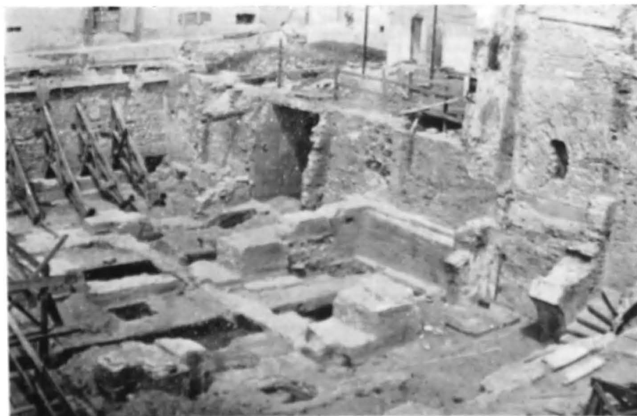
Fig. 7. Vedere a laturii de est a cetății Bucureștilor.