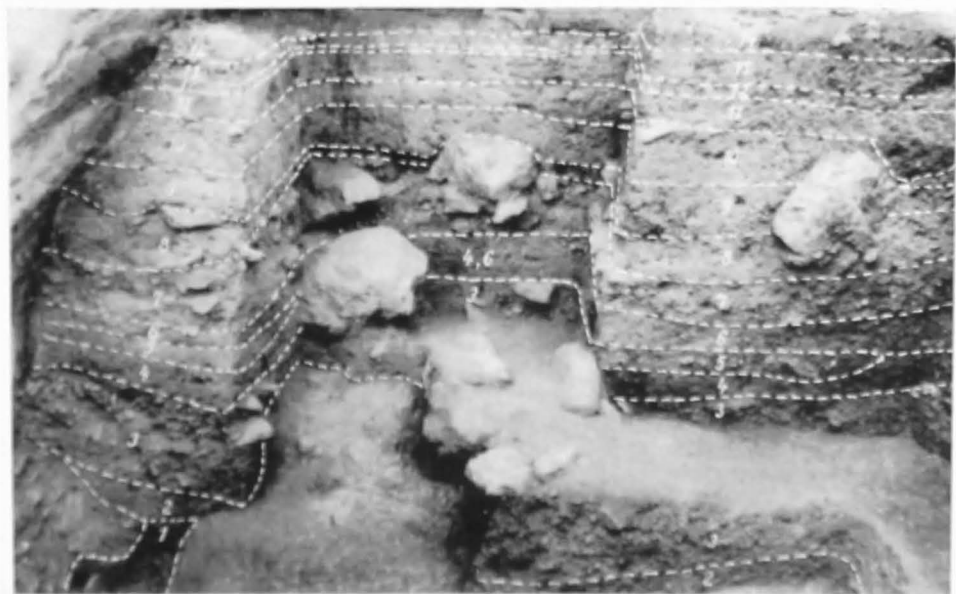
Fig. 2. Ciuina Turcului - Profil stratigrafic (vezi nota 2).