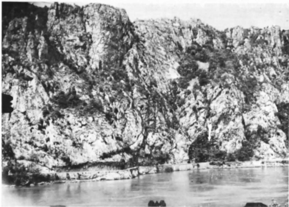
Fig. 1. Adăpostul sub stîncă Ciuina Turcului - Dabova, situat în masivul calcareos Ciucarul Mare - vedere generală (siglata indică adăpostul).