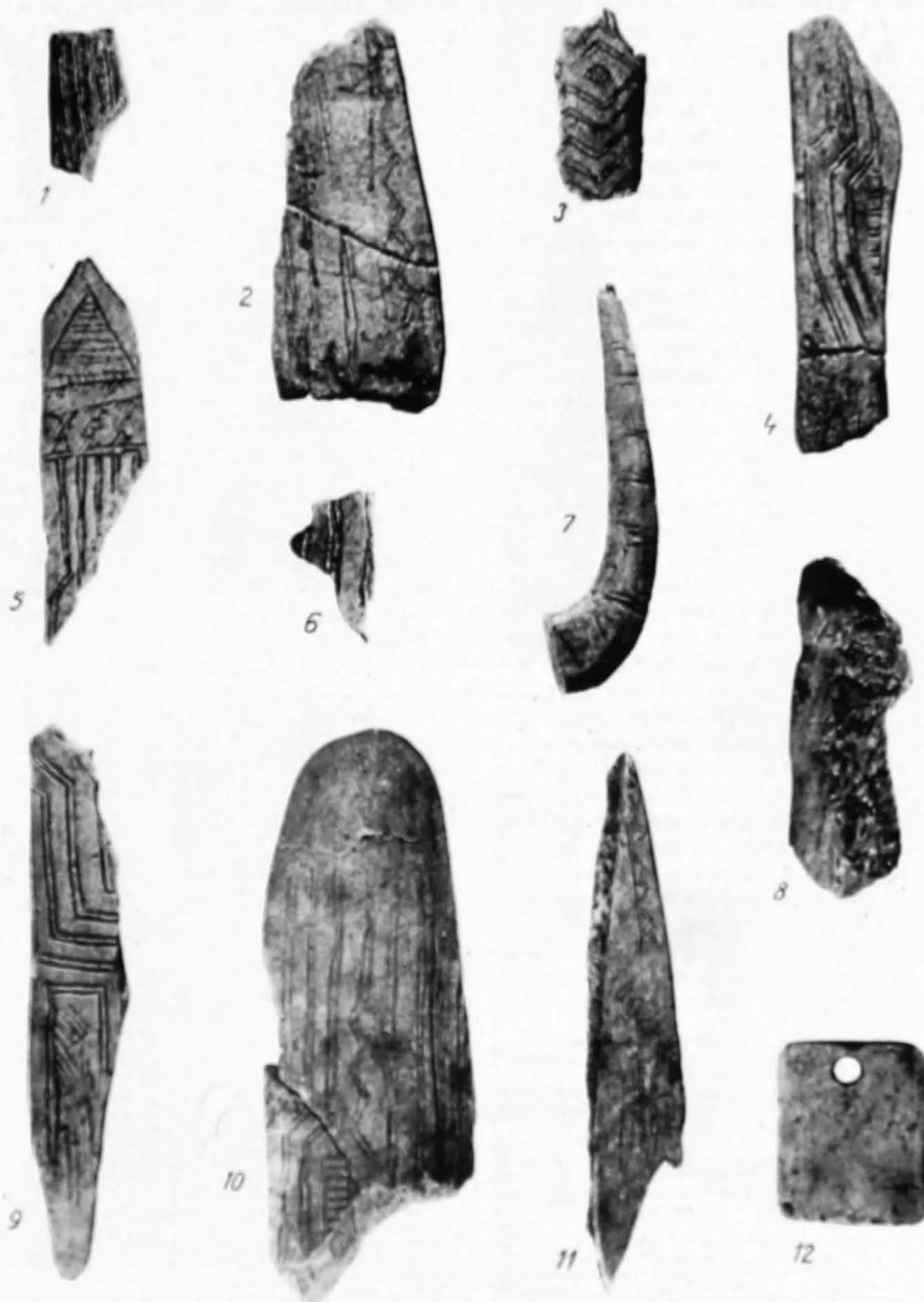
Fig. 3. Cuina Turcului - Obiecte de artă din os și corn, cu decore geometrice incizate, 1 - 11, stratul I epipaleolitic; 12 (obiect de podină, perforat la un capăt), stratul II epipaleolitic.