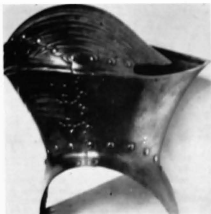
Fig. 1. Cască germană de turnir – sfîrșitul sec. XV.

Armurile de luptă aveau, pe lângă alte piese (dublură de pieptar, mînușă de mîină stîngă etc.), un coif de rezervă cu o vizieră grea, cu un singur orificiu de rezervă și tăieturi pe partea dreaptă. În cazul unui singur coif, rezerva era