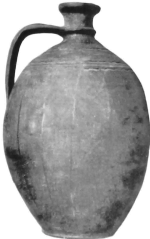
Urcior lucrat de Vasile Ochiană din Crețești.