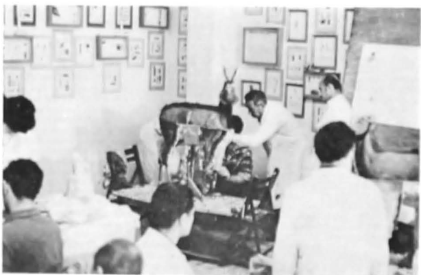
Naturalizarea unui câprior prin metoda dermatoplastiei.