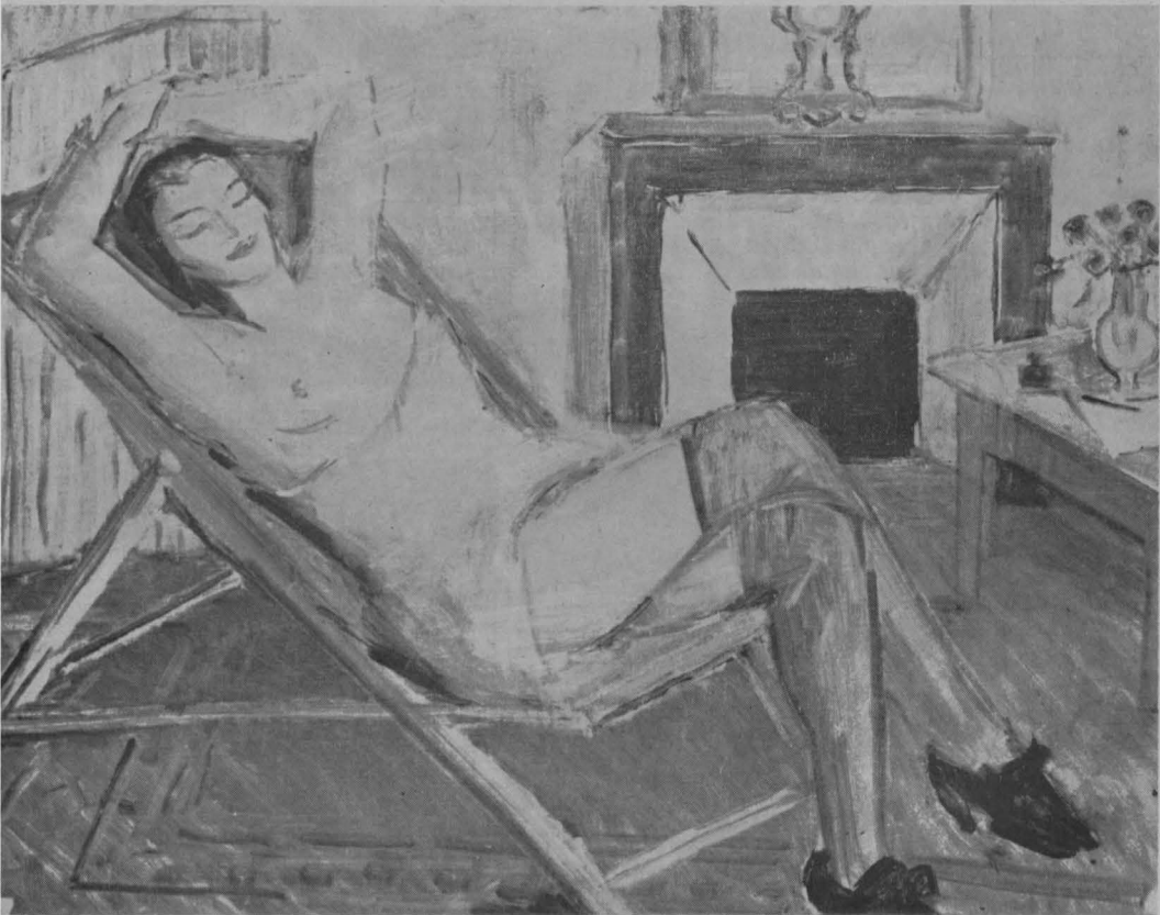
Theodor Pallady, Nud în chaise-longue.