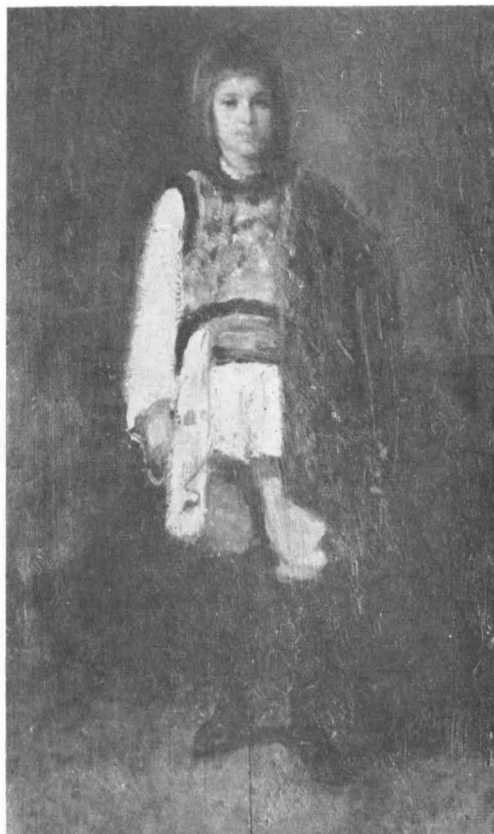
Nicolae Grigorescu, Copil.