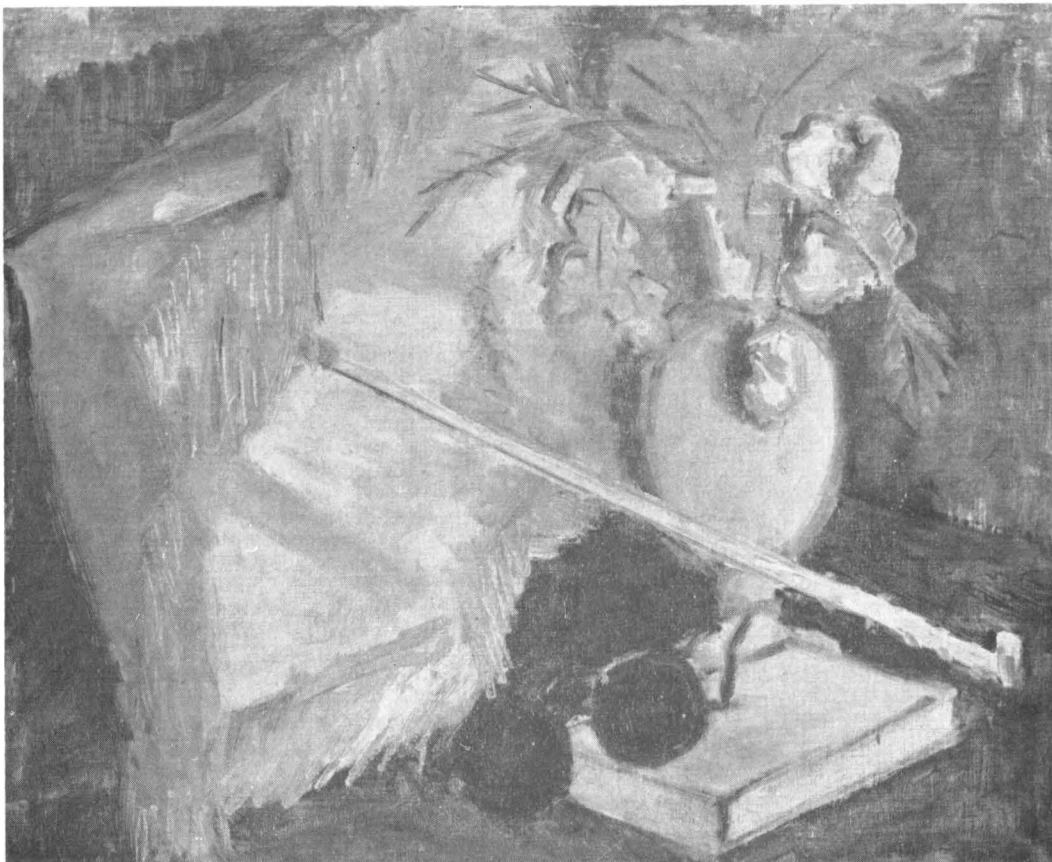
Theodor Pallady, Natură statică cu umbrelă.