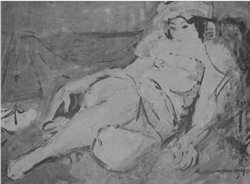
Alexandru Ciucurencu, Femeie în violet.