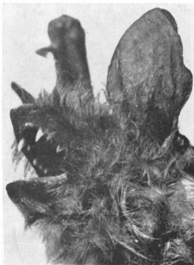
Fig. 2. Myotis emarginatus (Capul liliacului).