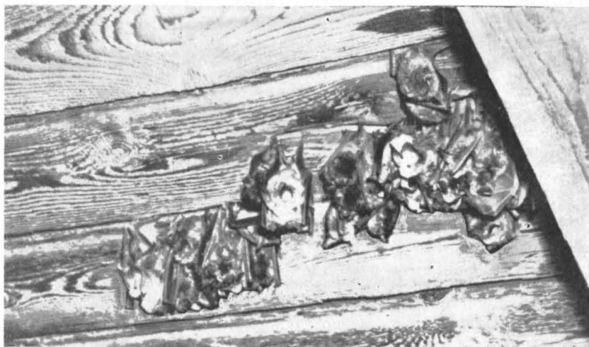
Fig. 1. Aspect din populația de Chiroptere de la biserica Runcu — Gorj (în pod).