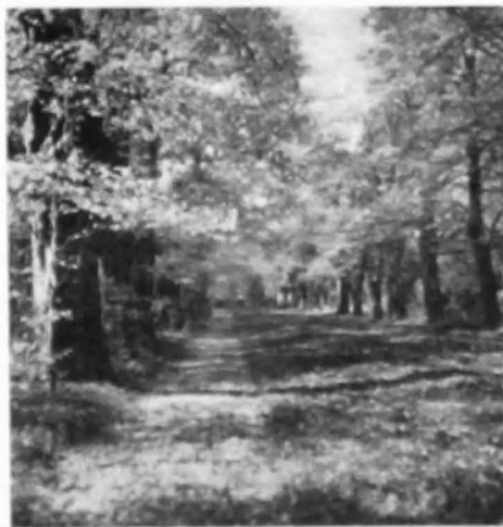
Fig. 3 — ALEEA PRINCIPALĂ A FRUMOSULUI PARC DE LA GRUMĂZEȘTI (1939) ÎN CARE A. CARADJA A FĂCUT MULTE OBSERVAȚII ECOLOGICE ȘI CAPTURI DE MICROLEPIDOPTERE, FOARTE IMPORTANTE PENTRU FAUNA ȚĂRII.