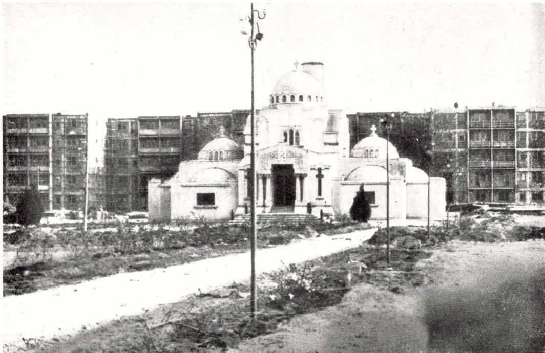
Mausoleul din Focșani, înconjurat de construcții recente.

Organele locale trebuie să aibă în vedere că fiecare an ce trece duce la accentuarea degradării unor monumente: în felul acesta, aminându-se luarea unor măsuri de salvare, sumele cheltuite pentru restaurare vor fi mai mari, iar lucrările mai dificile.