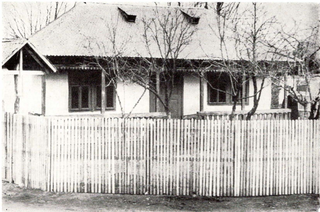
Proiectata casă-muzeu din Gugești

Nerepresentativă din punct de vedere arhitectonic, nepotrivită pentru destinația pe care urmează să o primească, este și amplasată într-un loc destul de greu accesibil turiștilor. În afara acestor inconveniente, colecția ce urmează să fie expusă este haotic întocmită și aproape fără valoare.