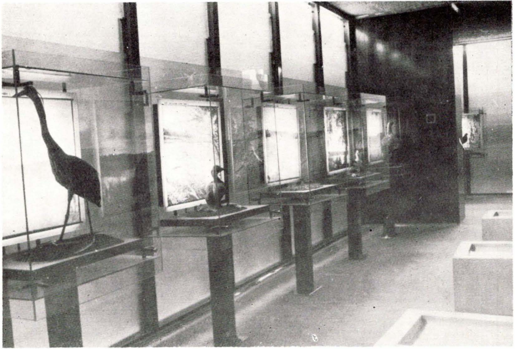
Muzeul de științele naturii. Aspect din expoziție

Toate acestea, împreună cu permanenta grijă pentru păstrarea unor legături strinse cu publicul, fac din Muzeul de științele naturii din Focșani o unitate modernă, cu care muzeografia noastră se poate mindri. Ținând seama tocmai de aceste realizări, Comitetul județean pentru cultură și artă ar trebui să-i acorde o atenție sporită, rezolvind în primul rînd problema spațiului de depozitare, din păcate nu numai insuficient, dar și impropriu.