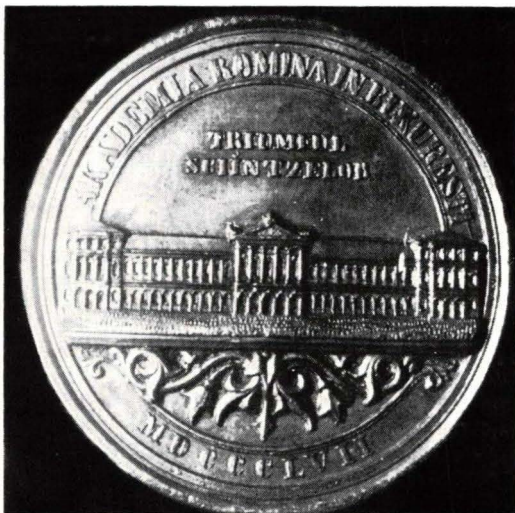
MEDALIA COMEMORATIVĂ EMISĂ CU PRILEJUL PUNERII PIETREI FUNDAMENTALE A UNIVERSITĂȚII DIN BUCUREȘTI, 10 OCT. 1857.