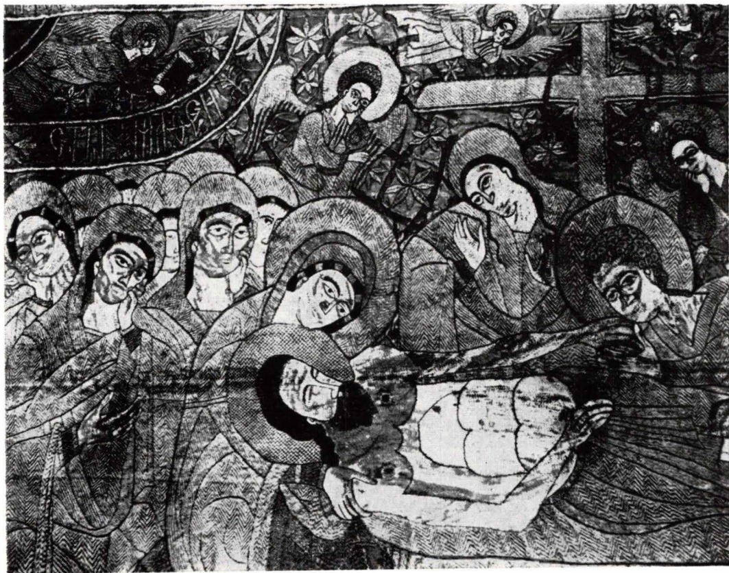
FIG. 2. EPITAFUL DE LA KIEV (DETALIU).