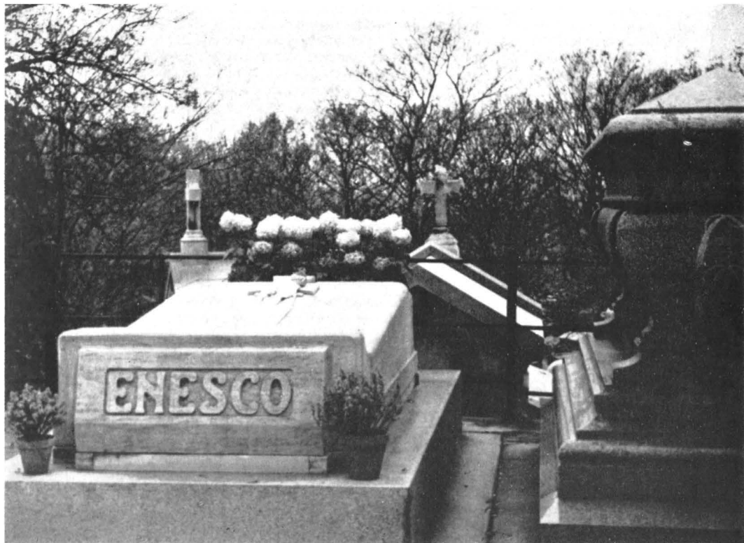
Mormintul lui George Enescu din cimitirul Père Lachaise, din Paris.

să-și ducă copilul la învățătură la Viena. Enescu a fost atras întotdeauna mai puternic de creație, decît de arta interpretării.