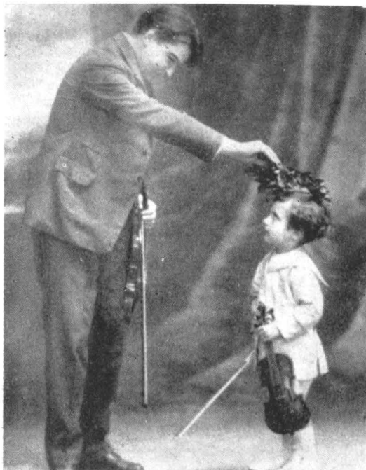
George Enescu îl încoronază pe Dinu Lipatti (1921).