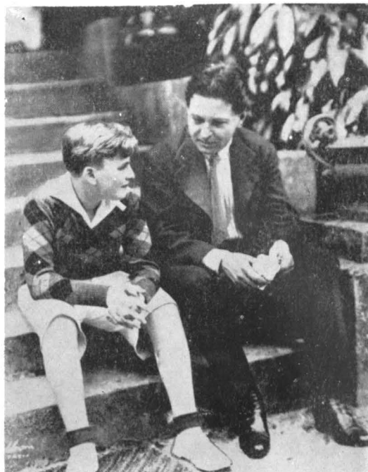
Cu Yehudi Menuhin la Paris, la Villa Bellevue.

George Enescu, — de la a cărui naștere s-au împlinit la 19 august, 90 de ani — a trecut în posteritate ca una dintre cele mai strălucite personalități muzicale contemporane.