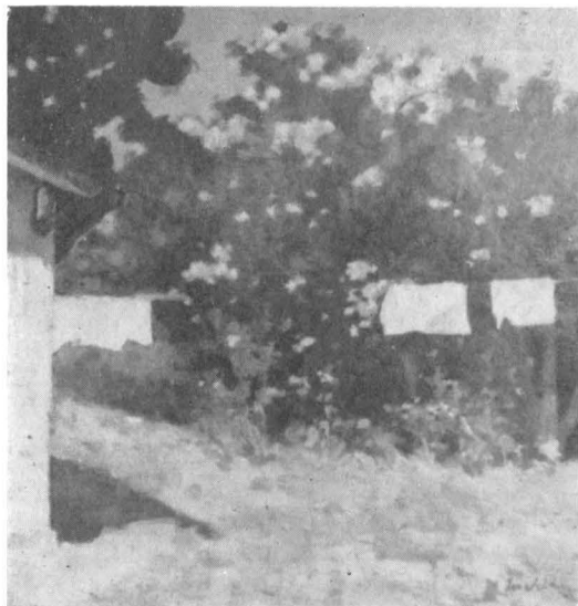
Șt. Luchian, În fundul curții.